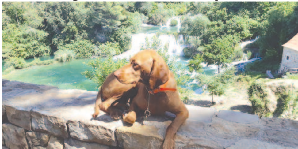
Gyurkóvári Pisze boldogan nyaral a családdal