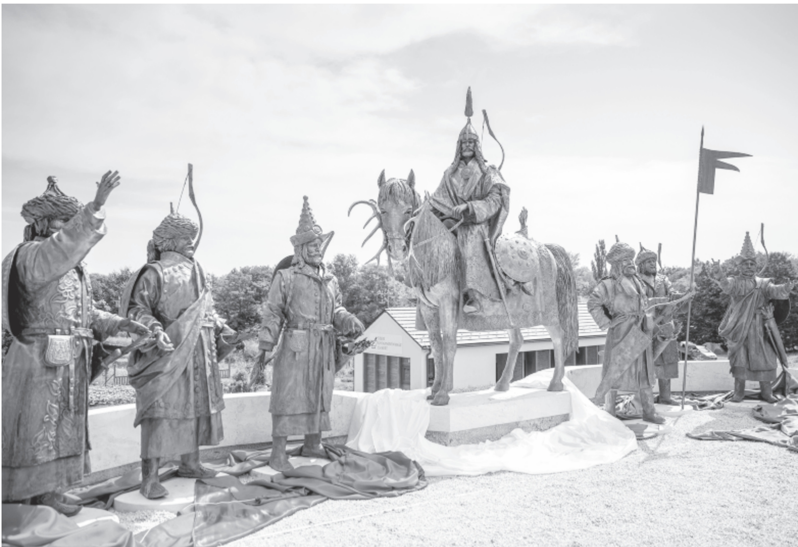
Felavatták az Árpád és vezérei szoborcsoportot Ópusztaszeren

Közölte: a Magyarok Országos Gyűlésének 2009-es elindításával, majd tavalyi újraindításával egy olyan hagyomány született, amely méltán nevezhető a nemzeti összetartozás ünnepének. A rendezvényen a fiatalok és idősek, kultúrára és kikapcsolódásra vágyók, anyaországi és külföldi magyarok egyaránt megtalálhatják, amit keresnek, hisz ez az esemény nemcsak a programok tárháza, hanem valódi találkozási pont a magyarság számára.