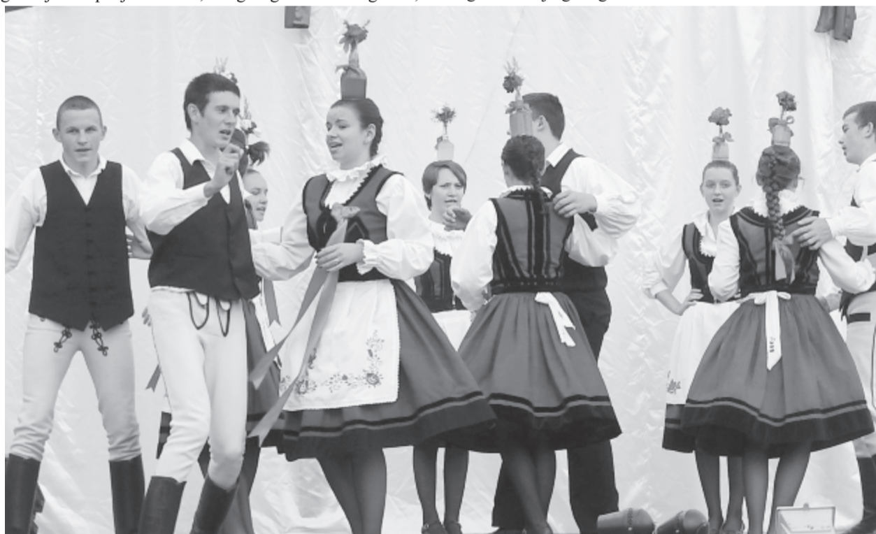
Hagyományápolástól sport- és ifjúsági rendezvényekig, szociális szolgáltatásokig 529 projektet támogatnak idén

A megyei tanács utólag egy újabb 100 ezer lejes keretet hirdetett pályázatot július 4-én, itt ifjúsági projektek támogatására lehetett kérelmeket benyújtani július 5-ig. A kiírásra 30 projekt érkezett, ebből 12 nem felelt meg a követelményeknek (két óvat is benyújtottak, de mindkettőt elutasította a bizottság), így a keretösszeget 18 kezdeményezésre osztják szét, ám a megítélt összegek nagyságát augusztus 1-jéig még nem tették közzé.