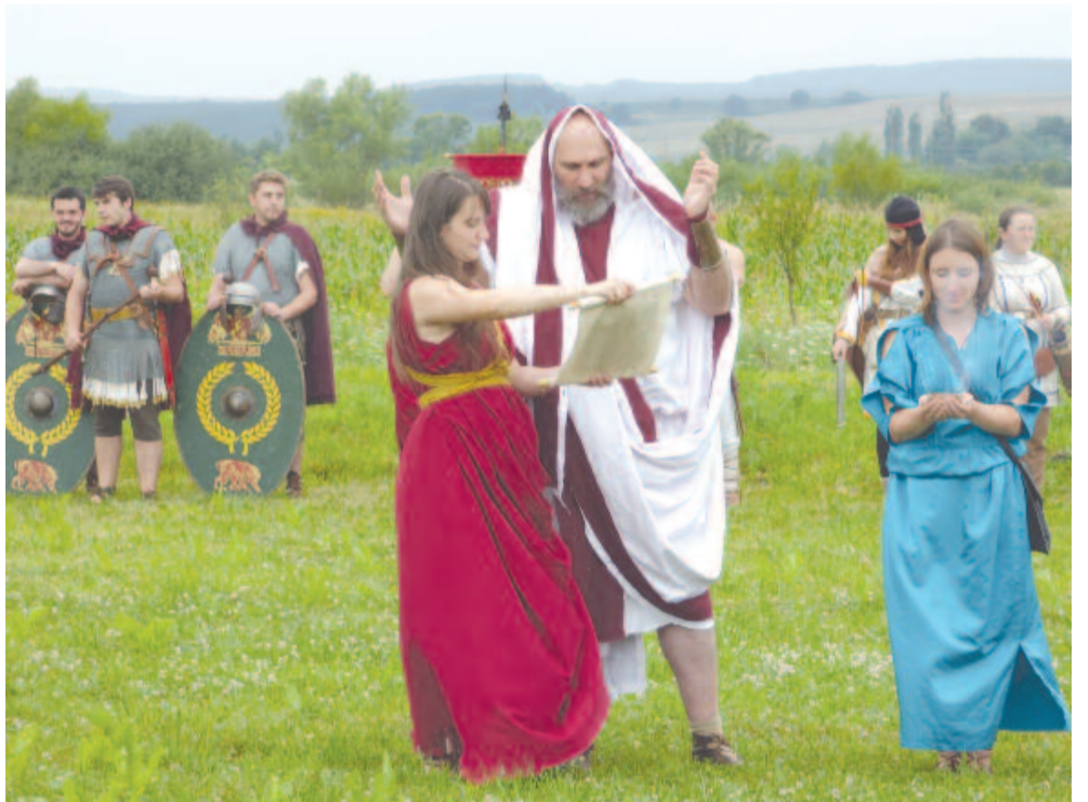
A szertartások fontos szerepet tölthettek be az ókorban