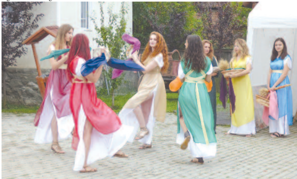
A viselet és tánc is a mesés Keletre kalauzolta a nézőt