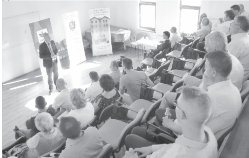
A parlamenti munka elmúlt három évét és a jövő évi terveket ismertették a honatyák

polgármesteri széket, és erre Marosvásárhely esetében is lehetőség van. Ugyanakkor a parlamenti bejutási küszöböt is el kell érni. Az önkormányzati munka kezd beérni, minden településen vannak eredmények, és van amivel kiállni a választópolgárok elé a következő évben – mondta a megyei elnök. A jelenlevőket Magyarország csíkszeredai főkonzulátusának vezetője, Tóth László is üdvözölte, ismertette a főkonzulátus munkáját, amelyet Nyárádszeredába is lehoznának, de szólt