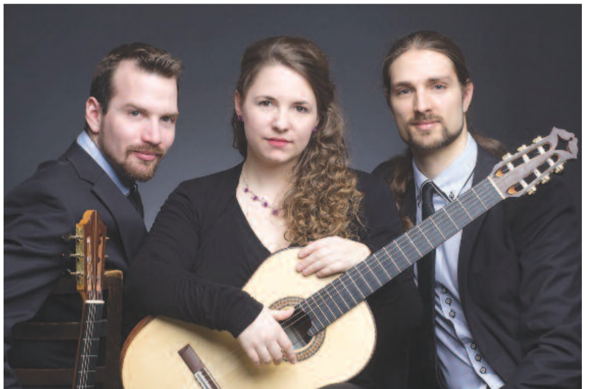
A Venti Chiavi gitártrío