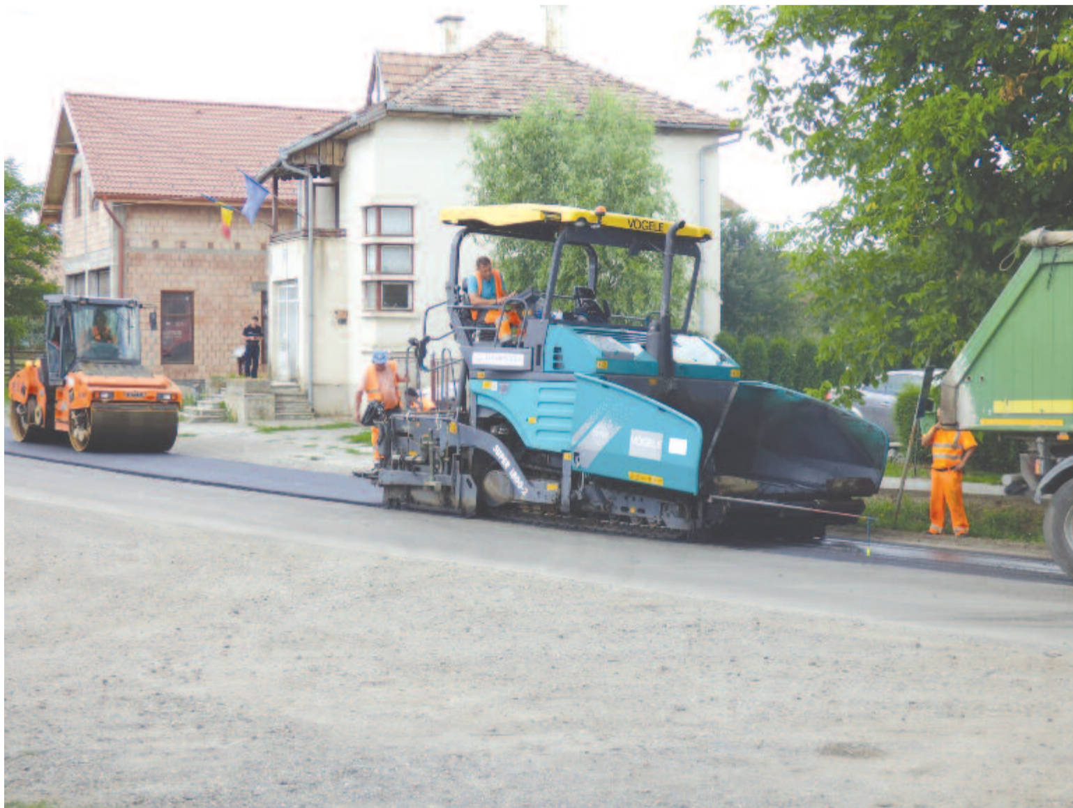
Több mint 92 km megyei útszakaszra kerül új aszfaltréteg