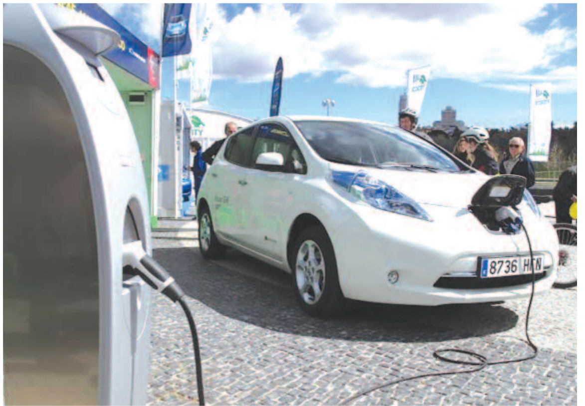
Mégsem az elektromos hajtás a legtisztább?

https://www.adac.de/verkehr/tanken-kraftstoff-antrieb/alternative-antriebe/co2-treibhausgasbilanzstudie/ (MTI)