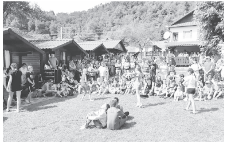
Nemcsak a résztvevők, hanem a záróelőadás nézőinek száma is évről évre gyarapodik