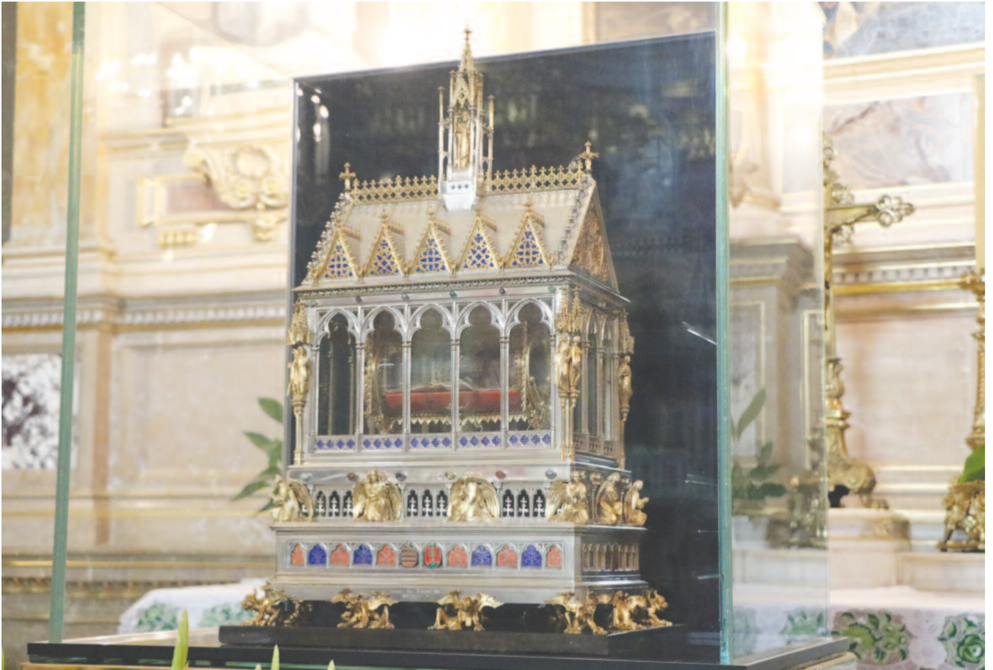
A budapesti Szent István-bazilikában levő Szent Jobb-kápolnában őrzik Szent István mumifikálódott jobb kezét. Ünnepi gondolatok a 3. oldalon.