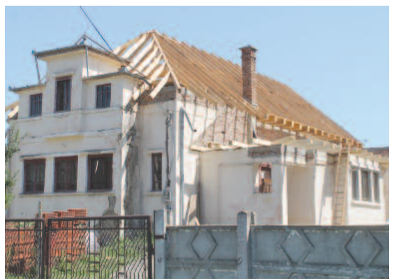
Újrafedték a gyülekezeti otthon