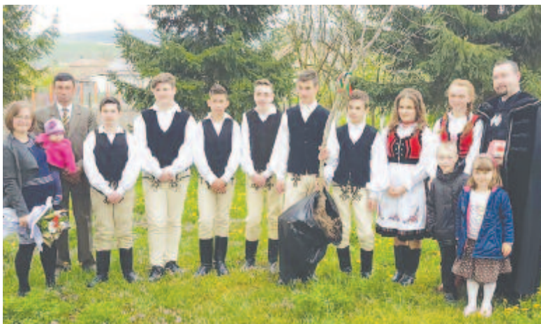
Az ideai konfirmálók