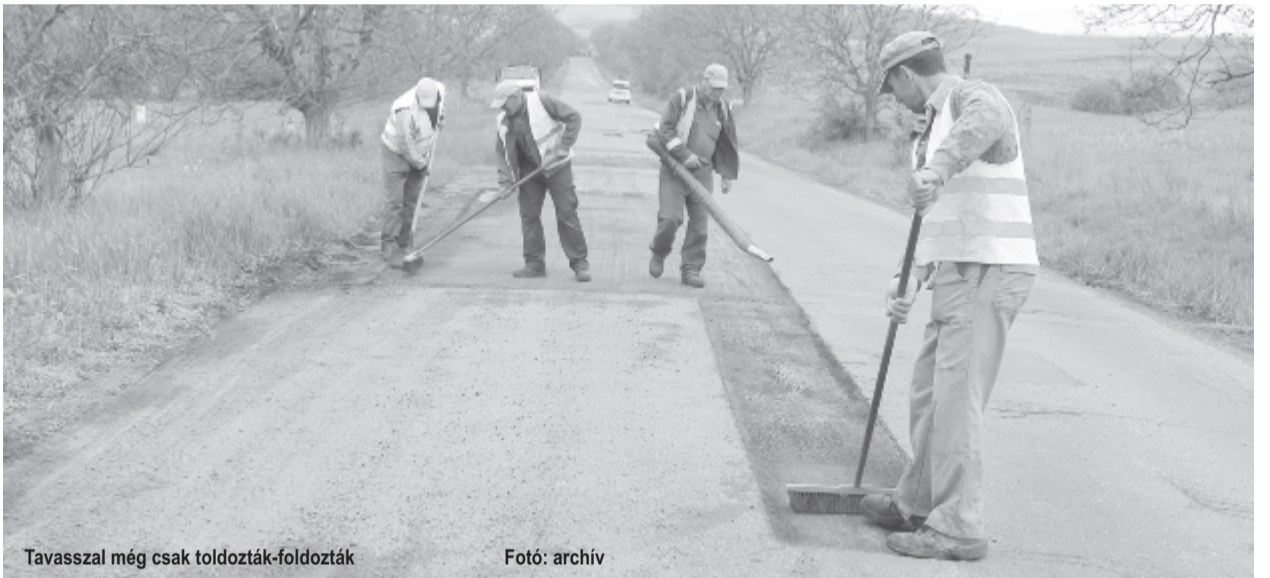
Tavasszal még csak toldozták-foldozták