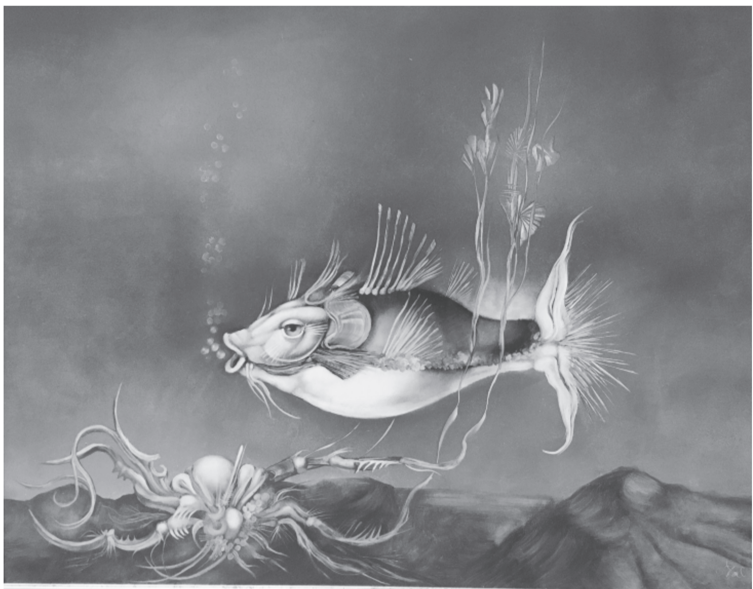
Mellékletünket Szász Endre alkotásaival illusztráltuk

1967. augusztus 6-án, 52 éve hunyt el a József Attila-díjas költő, műfordító, Jékely Zoltán édesapja, az erdélyi magyar irodalom egyik legjelentősebb alkotója.