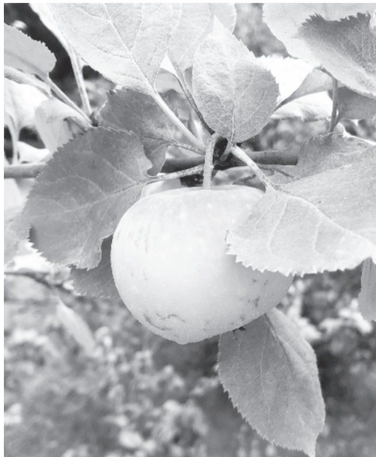
Adta jókedvébe s vette kegyelmébe ezt a fát az Isten – Bolyai-féle pónyikalmafa termés Szentendrén