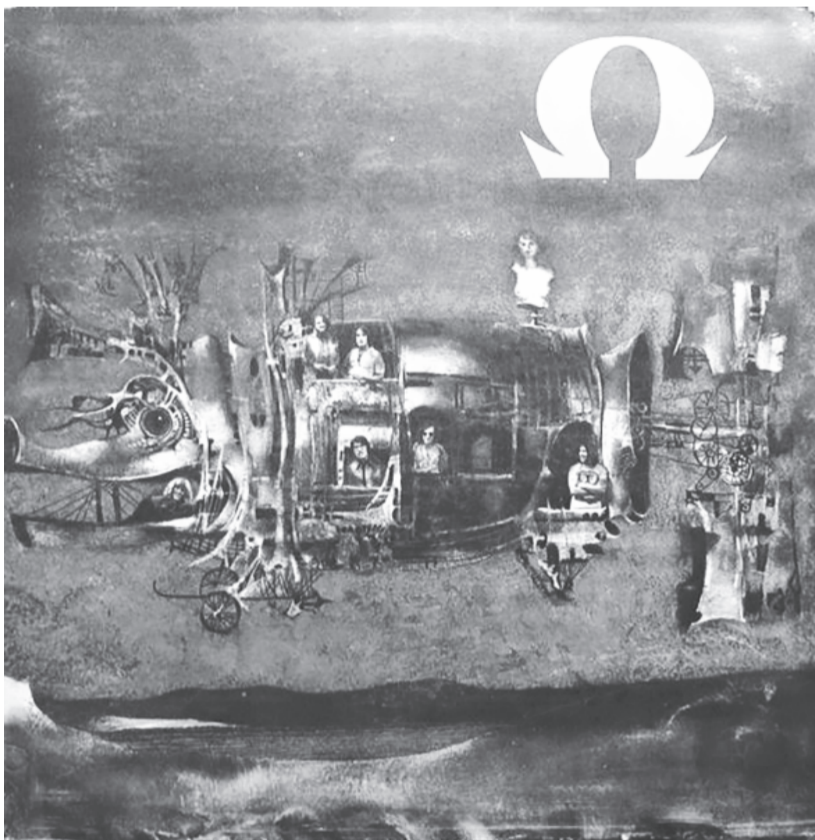
Az Omega Éjszakai országot című lemezének borítója (Szász Endre alkotása)

Sir Alfred Hitchcock 1980. április 29-én halt meg Los Angelesben. Halála után három évtizeddel a Brit Filmintézet kampányt indított filmjei „örökbefogadására”, hogy pénzt gyűjtsenek kilenc némafilmjének digitális restaurálására. A legkorábbinak vélt, The White Shadow című filmjét 2011-ben mutatták be, a 2012-es londoni ötkarikás játékokat kísérő kulturális olimpián némafilmjeit felújított változatban, új zenei aláfestéssel vetítették. Ugyancsak 2012-ben életrajzi filmet forgattak róla, a legendás rendezőt Anthony Hopkins, feleségét Helen Mirren formálta meg. Néhány éve bejelentették, hogy bemutatják holokauszt-dokumentumfilmjét, amelyet eddig még nem láthatott a közönség. A Madarak 2016-ban – nyolcadik alkotásaként – az amerikai filmörökség része lett. A filmtörténet egyik legnagyobb rendezőjének arcképe bélyegen is megjelent.