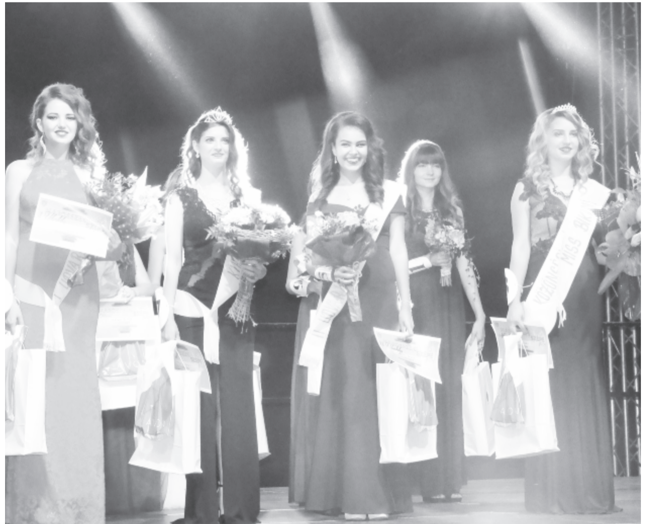
A községi napok egyik látványossága és érdekessége a szépségverseny