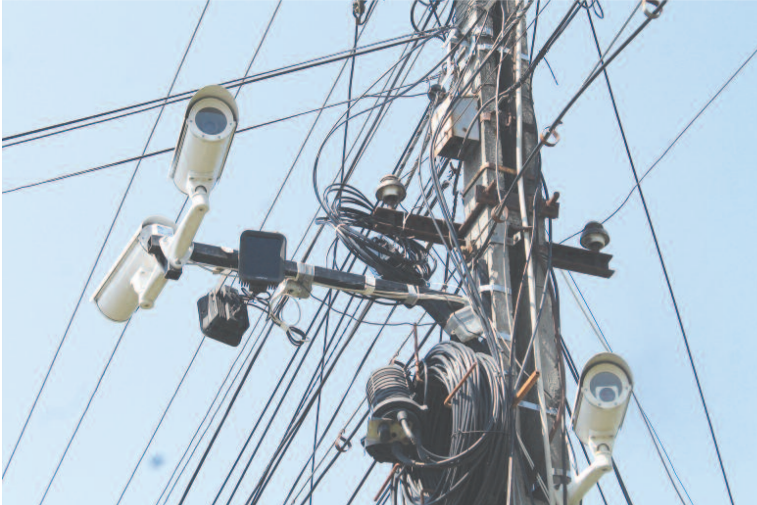
Szovátai vendégoldalunk a 6. oldalon