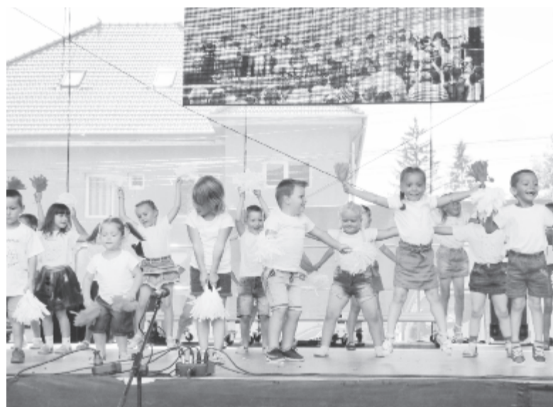
Minden évben tartalmas programokkal várja hazatérő gyermekeit és vendégeit Gyulakuta