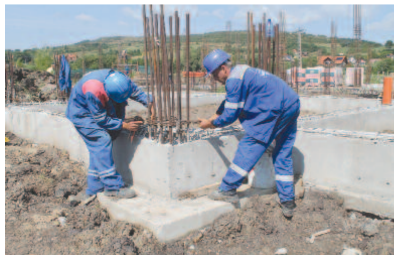
Épül az óvoda

Véleménye szerint kormány szinten kellene lépni, kiegészítést utalni ki a fejlesztési alapokból. Erre azonban egyelőre még ígéret sincs. – Beszéltem a gyulafehérvári központi fejlesztési régió igazgatójával, szerinte is ez lenne a megoldás. Ez a három projektünk, amelyekben nagyon sok munka van, amelyeken az elmúlt három évben rengeteget dolgoztunk.