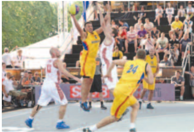
Olimpiai sporttá lehet, ezért felértékelődött a jelentősége.

A streetball-bajnokság az idén azért értékelődött fel a szövetség szemében, mert Tokióban a sportág bekerült az olimpiai programba, és a föderáció vezetői abban bíznak, hogy sikerülhet kiharcolni a részvételt az ötkarikás játékokon. A bajnokságban emiatt is kizárólag román állampolgárságú játékosok képviselhetik a klubokat. (bálint)