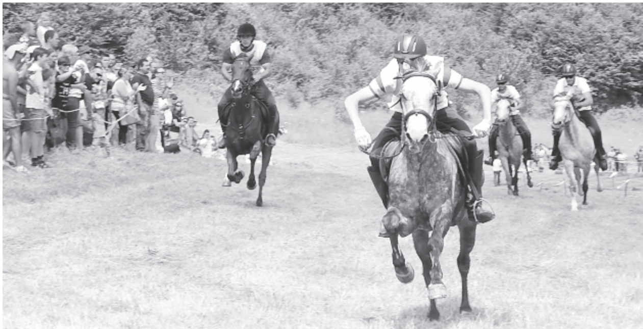
A lovas sportok kora ismét felemelkedőben van – most Nagyernye ad otthont egy vágtnak