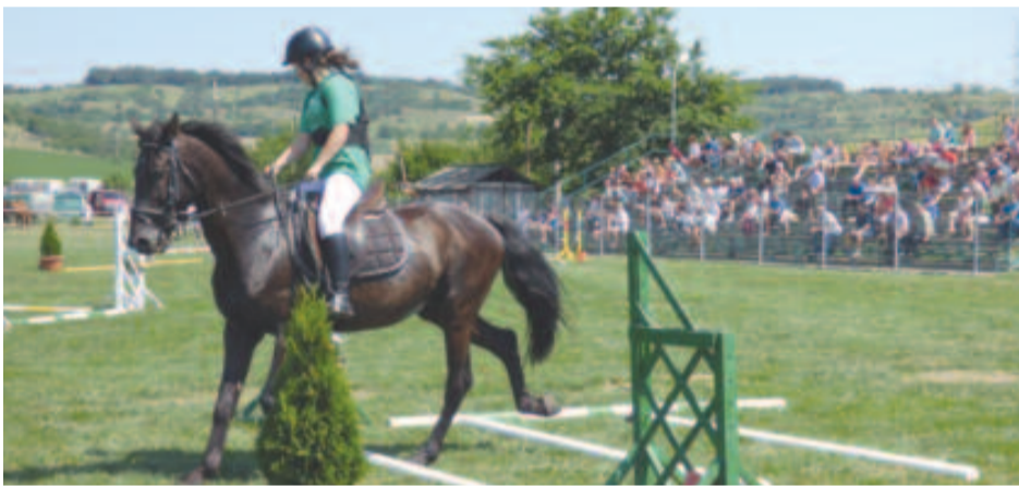
Szombaton 97 lovas és 70 ló állt rajtvonalhoz a IV. Székelyföldi Regionális Díjugrató Kupa versenyein.