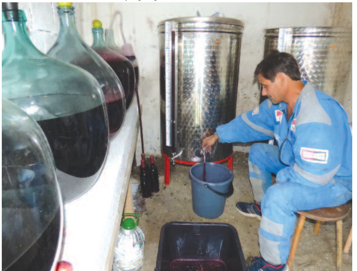
Már telnek a tartályok, korsók és palackok a friss ribizliborral

nyekre szükséges és a megrendelőknél szállítandó rengeteg cukros és cukormentes termék. Az áfonya-, málna-, bodza-, citromfű, menta- és szurokfű szörpök elkészültek már, ezután még almából és berkenyéből szorítanak levét. A lekvároknak való gyümölcsmennyiség biztosított, de a szörpökre már kevesebb jutott. A pincében már forr a ribizlibor, a tavalyinál hamarabb beindult az erjedése, de almaciderrel is kísérleteznek – mutatja a gazda, miközben úgy jósolja: a szilvalekvár főzése idén is tartalmas lesz, és még pálinkának is marad a beszterceiből.