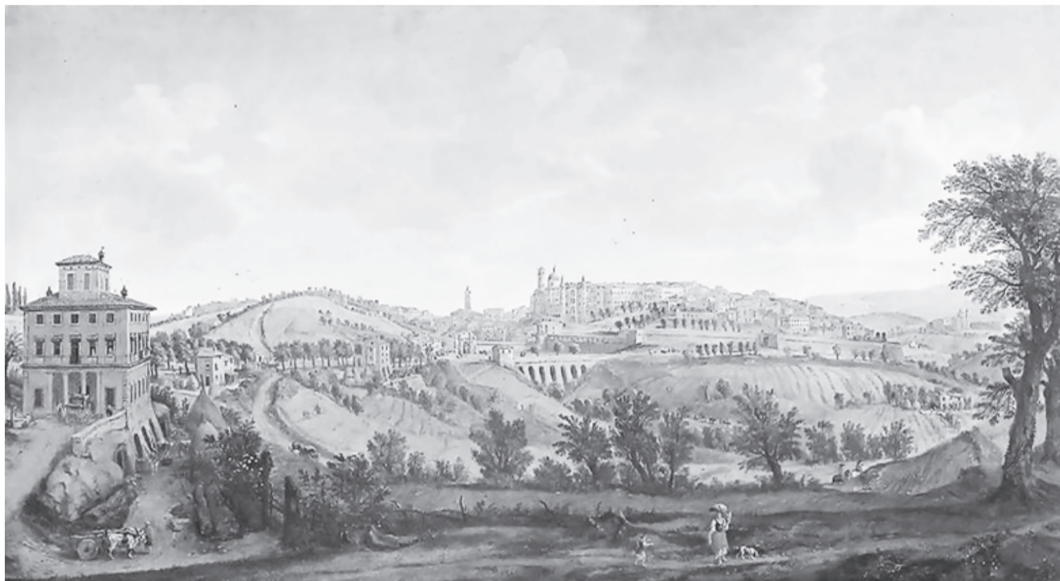
Gaspar Van Wittel (1653–1736): Urbino