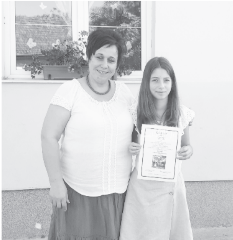
Zsuzsa megírta, a tanítónő beküldte pályázatára a történetet – különdíj lett az eredmény

– Elektronikus postán értesítettek, hogy különdíjban részesült a pályamunka, azon este továbbítottam is a kislánynak, hogy a család együtt élje meg ezt az örömet. Másnap reggel csillogó szemmel érkezett a család az iskolába, és mesélték, hogy mekkora öröm volt este, s milyen boldog a nagytata, aki Szatmáron él, hogy az unokáját ennyire megérintette a történet, hogy fontosnak tartotta másokkal is megosztani – mesélte el lapunknak a tanítónő.