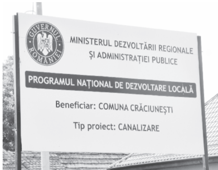
Évek munkájába telt, amíg elkezdődött a csatornázás, de két hónap után le is állt