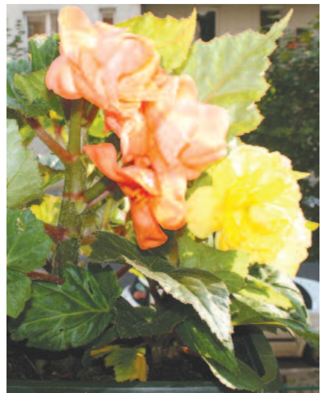
Égnek a begóniák

De hát az ármány, hol ember van, mindig megjelenik. Régi történet. 583 évvel ezelőtt, 1436. június 6-án született Königsbergben Johannes Regiomontanus – sok régi kalendárium Királyhegyi Jánosa – késő középkori német matematikus, csillagász. 1467-ben Vitéz János esztergomi érsek hívására Magyarországra jött, aki az akkor újonnan megalapított pozsonyi egyetem ( Academia Istropolitana ) professzorának is meghívta. Mátyás király udvarában a Corvina könyvtár görög kéziratait rendezte. (Három évvel hamarabb, 1464. június 7-én nevezte ki Mátyás király Vitéz János akkor még váradi püspököt Bihar megye örökös főispánjává a Szent Korona kiváltásában szerzett érdemeiért.) Magyarországon írta Ephemerides című csillagászati művét, amelyet Kolumbusz is felhasznált felfedezőútján, valamint itt készítette el trigonometriai munkáját és táblázatait. 1471-ben Nürnbergbe távozott, ahol további csillagászati megfigyeléseket végzett. Ő készítette 1473-ban az első olyan táblázatot, amely bármely időpontra meghatározza a Nap és a Hold egymáshoz viszonyított helyzetét. Ennek a földrajzi hosszúság meghatározásában volt fontos szerepe, különösen az éjszakai hajózásnál. 1475-ben IV. Sixtus pápa Rómába hívta, hogy a naptárreformban