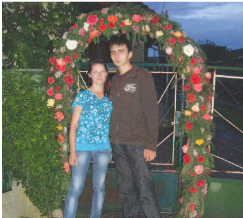
A paniti bolthajtás mint szerelmi ajándék (2010)

A múlt század közepéig a kistáj mindenik falujában gyakorolták a tavaszi zöldág-állítás szokását valamelyik jeles napon, ünnepen. A Maros melletti Szentannán, Udvarfalván és Várhegyen, valamint a közeli Galambodon és Mezőfelében húsvét a zöldágazás, bokrétázás alkalma, Mezőmadarason pedig a május elseji májusfaállításra emlékeznek. Mezősámszónon májusfát is tettek, és pünkösdkor is, „kizöldágasták” a leányok kapuit a legények, Mezőcsáváson áldozócsütörtökön és pünkösdkor is zöldágastak, aki mindkét alkalommal