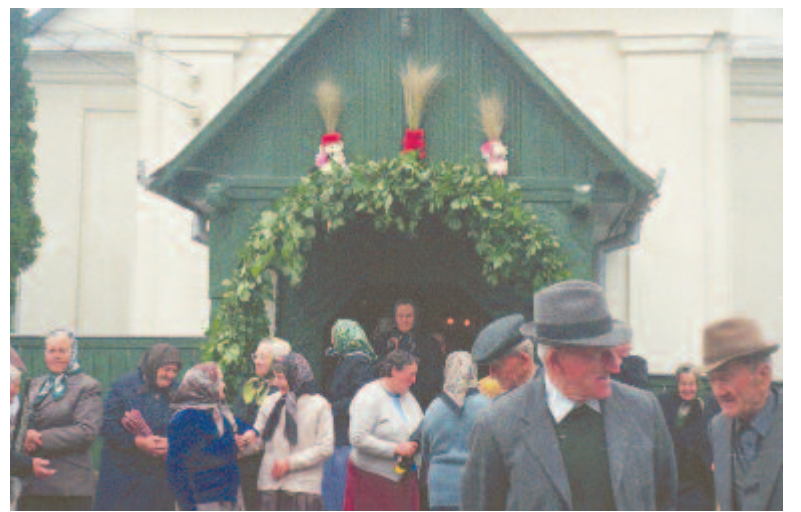
Pünkösdi virágokkal ékes templom előtt... (Csittszentiván, 2001)

Mezőpanitban a nagyleányok kapuját szintén bolthajtás díszíti, akkora, hogy a földtől a kapu tetejéig ér. Az egész vidéken itt a legszínesebbek és legdúsabbak a bolthajtások. Böven van belőlük napjainkban is, több évben tizenöt-husz leány is kapott bolthajtást. Napjainkban nemcsak Panitban állítanak „panitias” bolthajtást, hanem a környező falvakban, Harcón, Székelykövesden, Csittszentivánon, sőt Marosvásárhelyen is, ahová a paniti legények udvarolnak. Azok a serdülő leányok, akik abban az évben konfirmáltak, már kaphatnak koszorút, koronát vagy csokrot, s ezt a tornácba vagy az ajtó fölé helyezik el a fiúk. Ezekből is ugyanannyit látni a faluban, mint bolthajtásból. Többévi megfigyelés alapján állíthatom, hogy a paniti és a többi falubeli leányok nagyon örülnek a sokféle virágból, rózsából álló bolthajtásnak, koszorúnak, virágcsokornak, nagyon várják, a fiúk néha szégyenlősen, néha nagy hévvel mesélik virágserzési élménye-