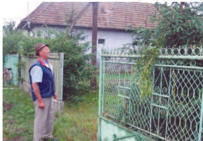
Az éjszaka nyomai: elvitték a kaput, letörték a fenyőágakat (Mezőpanit, 2009)

három-négy lánynak díszíti bolthajtás vagy koszorú a kapuját, itt nemcsak a férjhez menendőkét, hanem a fiatalabbakét is. Itt kevesebb a leány, mint Szabédon, de jóval több