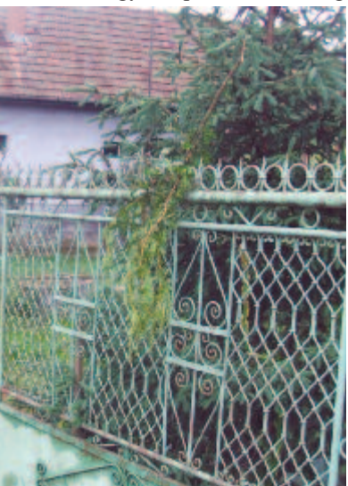
Az éjszaka nyomai: elvitték a kaput, letörték a fenyőágakat (Mezőpanit, 2009)

A virágkozás szokását gyakorló közösségekben és főleg a legények-leányok körében általános az a vélekedés, hogy a kapura kerülő virág