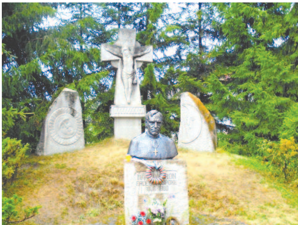
Márton Áron Nap és Hold között szülőfalujában