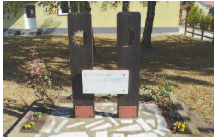
Római katolikus templom és kopjafa a templomkertben

Akasztófát Titónak, Békét ifjúságunknak!). A Tito sugárútról letérve újabb kétnyelvű felirat tünteti fel a Jugoszláv Néphadsereg utcát, egyszerűen J. N. H.