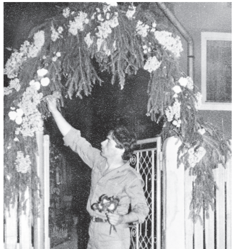
Hajnalfelé készen a szabédi bolthajtás (1988)

annál értékesebb, minél nehezebben lehet megszerezni, begyűjteni. Ha saját kertből szedik vagy kérik, nem sokat ér, akkor értékes, ha lopják. A legénycapatok, suhancok éjszakai foglalatossága a viráglopás, sok házigazdáé, háziasszonyé a virágkert őrzése. Erre az éjszakára szinte kettéválik a falu: virágörzökre és virágtolvajokra, akár egy rokonságon vagy utcán belül is. Ezt mindenki tudja, legtöbbször elfogadják a viráglopást, csak kíméletes, szelíd formáit igénylik. Az egész vidéken a legutóbbi időig élt a virággal köszöntő szokás fordítottja is: a büszke, haragtartó leánynak bosszúból lerágott kukoricaszárakat, csalánt vagy egy zsúp körét állítottak a kapujához. Azt hamar el kellett tüntetni, de úgymint hamar híre ment, hogy a leányok-legények közül ki van éppen haragban. Arra napjainkban is ébredhet a leányos gazda pünkösöd reggelén, hogy a kiskaput a harmadik szomszédba vitték, vagy kicserélték a tréfás kedvű legények vagy a legénysorba így belépni kívánó suhancok. Ezért az öregek és a tréfát nem ismerő felnőttek haragszanak, a leányok egyenesen büszkék arra, hogy ez miattuk – értük történik.