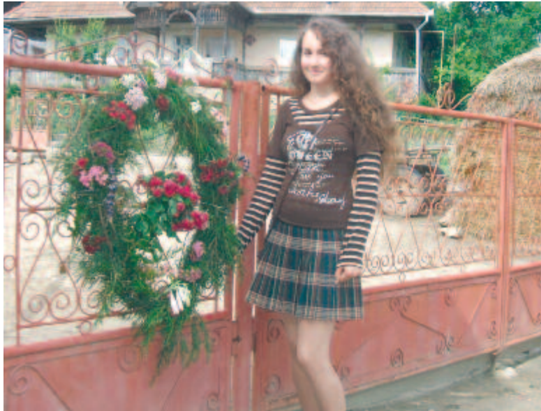
Mezőkölpényi leány koszorúja (2009)

Csittszentivánon az a gyakorlat, hogy az elmúlt évben konfirmált fiúk közösségi feladata a református templom két ajtajának, portikusának és a papilak kapujának felvirágozása. Az erdőről kizöldült, sudár