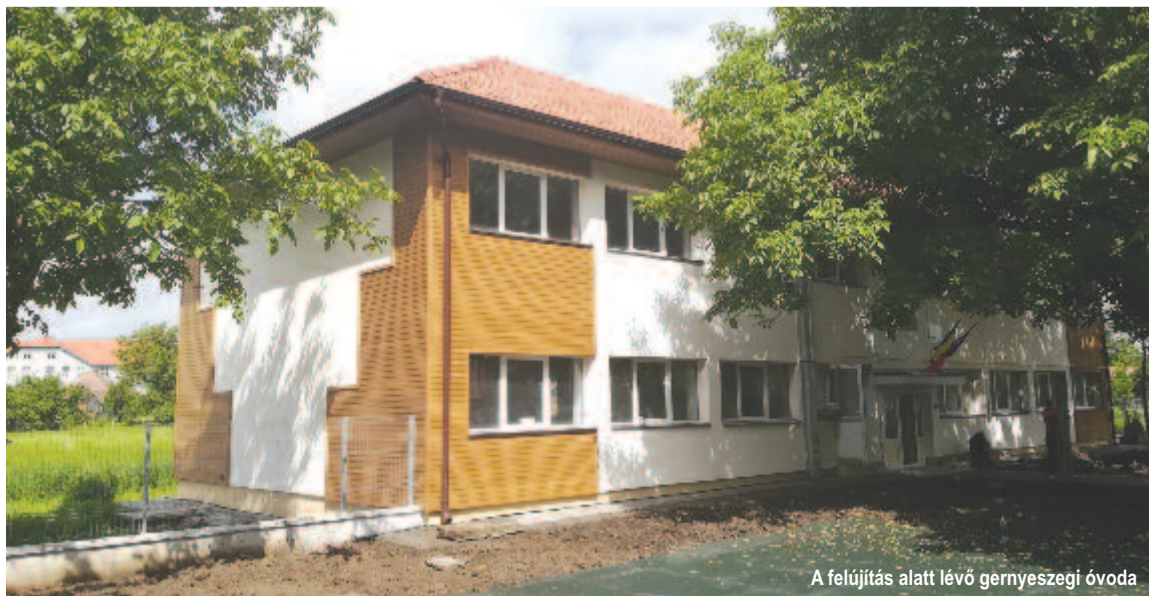
A felújítás alatt lévő gernyeszegi óvoda

kezdődött, szerdán kilépett a medréről a péterlaki patak, Körtvélyfájan elárasztotta az utat és pár házát is. Körtvélyfája fekvésileg is eléggé sűjtött, mert a belső falvainkból is mind ide folyik le a víz, ami ilyenkor problémát okoz, ráadásul a falu felső felét a Peteléből lezúduló víz sújtja. Ezelőtt három évvel emiatt a régi aszfaltot átvágtuk és elhelyeztünk egy áteresztőt, ami a Maros felé vezeti a vizet, most pedig egy újat tettünk le Petele mellett, hogy a régi állami gazdaságtól lezúduló vizet eltereljük a falu elől. Az árvíz házakat is érintett, de kilaoltatni nem kellett, inkább udvarokat, pincéket mosott el az ár. Község szinten nyolc-tíz házról van szó, ami aránylag szerencsés, hiszen voltak országsszerte súlyosabb helyzetek is.