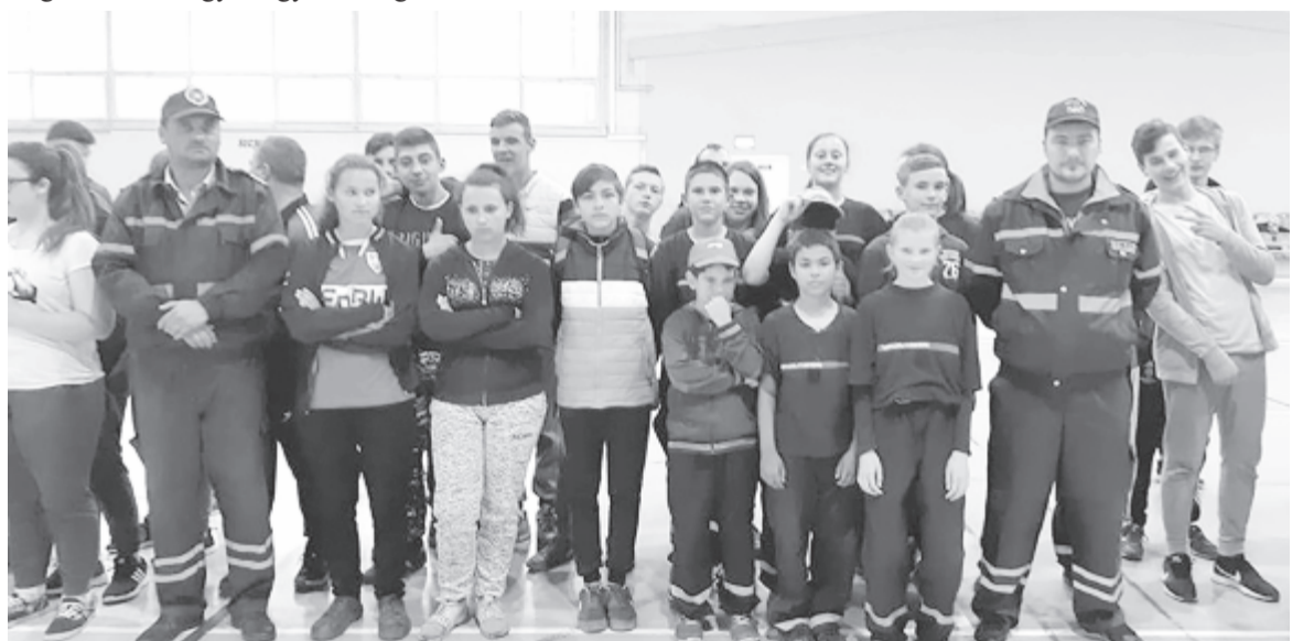
Két nap alatt két versenyen jeleskedtek a szeredai gyermek tűzoltók