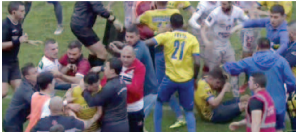
A mérkőzés lefújását követően a képen látható módon folytatódott az összecsapás