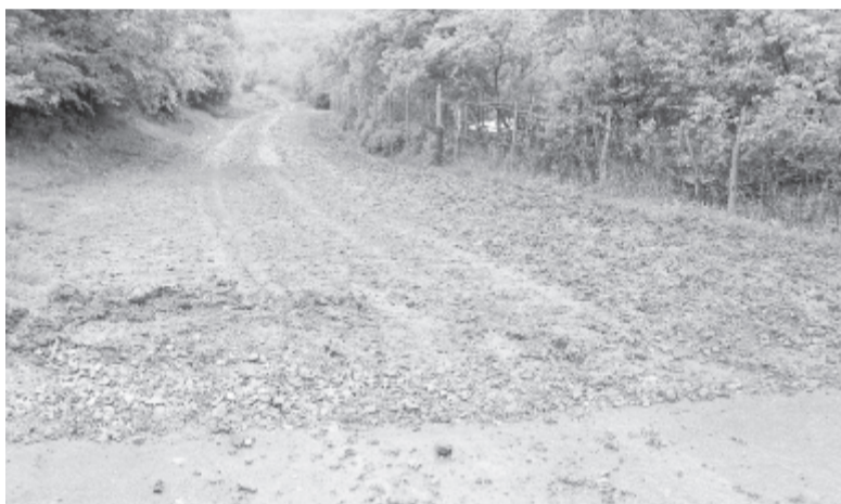
Az Erdőalja felé vezető földút

A terv szerint a Vámosgálfalván áthaladó 142-es megyei útról a nemrég leaszfaltozott 79-es küküllőpócsfalvi községi úton és a 79/A úton lehet majd Erdőaljára, onnan Gyulasra és Marosugrára jutni civilizált körülmények között. Jelenleg Erdőaljára földút vezet, esős időben személyautóval nem közelíthető meg. A tervek szerint a Küküllőpócsfalvát Erdőaljával összekötő hat km-es útszakasz öt méter széles lesz, kétoldalt ötven-ötven centiméteres kövezett útpadkával. Ezt a tervet az Országos Beruházási Alap támogatásával valósítanák meg. Azonban nem elhanyagolandó a bürokratikus ügyintézés jellemző munkaritmus, mivel egy pályázat benyújtásától a tényleges munkálatok elkezdéséig két és fél-három év is eltelhet – tájékoztatott a polgármester.