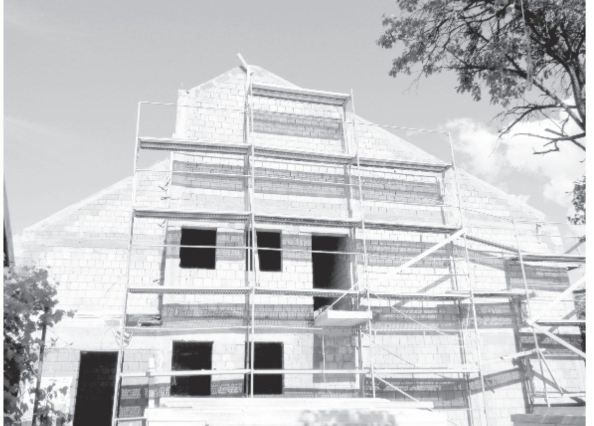
Jövő nyáron kell átadni az épületet, még nem késtek el vele, de a közösség már nagyon várja