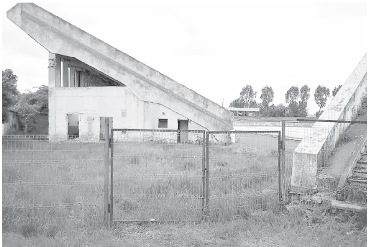
Bejárat a ligeti stadion fő lelátósorára: a kapun lakat, mögötte derékig érő fű.

Pénz tehát van, csak meg kell találni a megfelelő forrást, és elsősorban akaratra van szükség döntéshozói szinten – volt a következtetés.