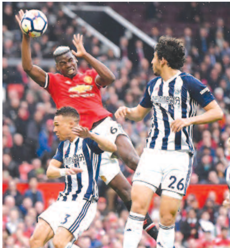
A kézzel vagy karral elért gólok a jövőben nem érvényesek, függetlenül attól, hogy a játékos véletlenül ért-e a labdához vagy sem.

További módosítás, hogy a kezdésnél a pénzfeldobást nyerő csapat választhatja a kezdőrúgás elvégzése vagy a térfélválasztás között.