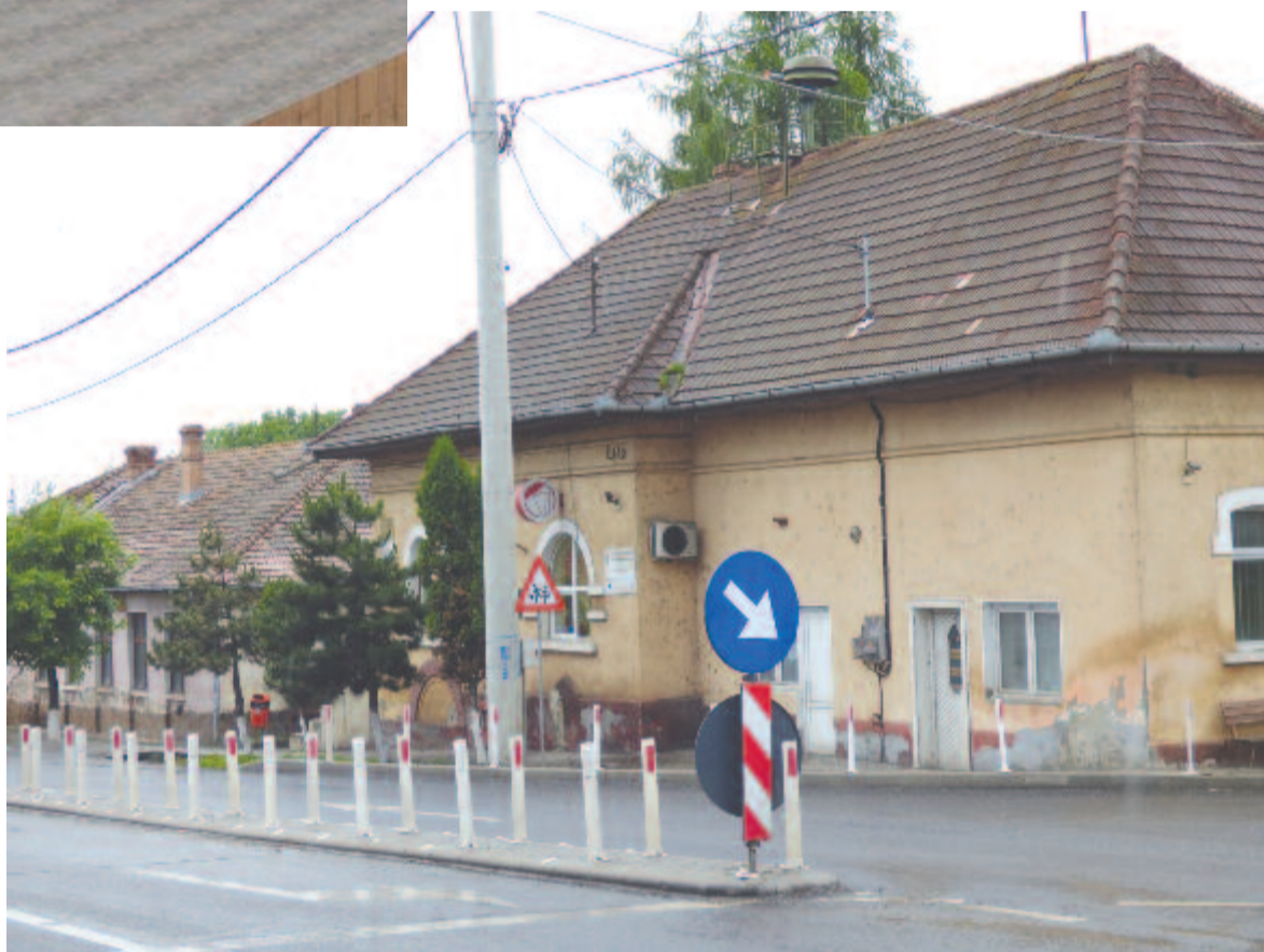
Ákosfalván kibővítik, korszerűsítik a kultúrotthon épületét, megújítják a környezetét

Mivel tágas terület áll rendelkezésükre, az udvaron játszótér is lesz, parkolót is kialakítanak, a fennmaradó helyre pedig egy műfüves kispályát terveznek, ám azt nem ebből a beruházásból, hanem más projekt keretében valósítják majd meg.