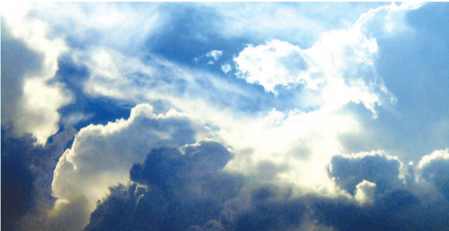
Az örök ég örök hajósa lenni

Tűzét megrakoljuk, négy szögre rakoljuk, egyik szögén ülnek szép öreg emberek, másik szögén ülnek szép öreg asszonyok, harmadikán ülnek szép ifjú legények, negyedikén ülnek szép hajadon lányok.