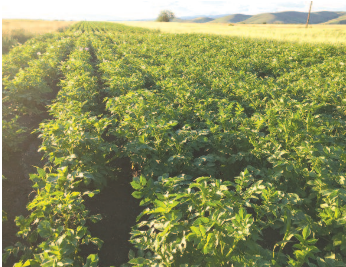
A szóban forgó burgonyaültetvény 2018. július elején

is több helyen előfordultak. A főként füves területeken történő lassú vándorlásuk során elérték egyes települések határát, több helyen ezreléssel keltek át közutakon, riadalmat keltve a gazdákat, a lakosságot és az autózók körében. A megyei hatóságok a leginkább érintett Gyergyószárhegy határában több mint ötvenhektáros területen rovarirtó szerekkel permeteztek, más érintett területeken végül elmaradt a rovarirtás. Ugyan nem kártevő rovarként tartják számon, de a tavaly jelentősen elszaporodott fogasfarkú szöcskék elsősorban a nagy levelű kétszikű növények (pl. bojtorján, nadálytő, pitypang stb.) levelének megrágásával minden bizonnyal okoztak termés kiesést azokon a füves területeken – elvételre lucernásokban, lóherésekben –, ahol átvoztak, látványosabb kárt a Szárhegy határában lévő Tatárdomb közeléből jeleztek. Mezőgazdasági- lag művelt területeken, kertekben kimutatható kártételről nem érke-