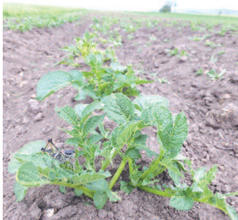
Fogasfarkú szöcskék a Gődücs-patak közelében lévő burgonyaültetvényen 2018. május végén

Általában a talajban lerakott peték nem egyszerre, hanem kisebb-nagyobb mennyiségben kelnek ki az egymást követő években. Bár egyértelműen nem ismert, hogy pontosan milyen környezeti tényezők váltják ki a tömeges elszaporodást, a korábbi megfigyelésekre is alapozva 2018-ban a szokatlanul enyhe tél és a rekordmeleg április kedvezett annak, hogy a fogasfarkú szöcske petéi nagy számban tudjanak kikelni. 2019-ben a csapadékosabb és hűvösebb tavaszi időjárás miatt kevés pete kelt ki és érte meg a felnőttkort.