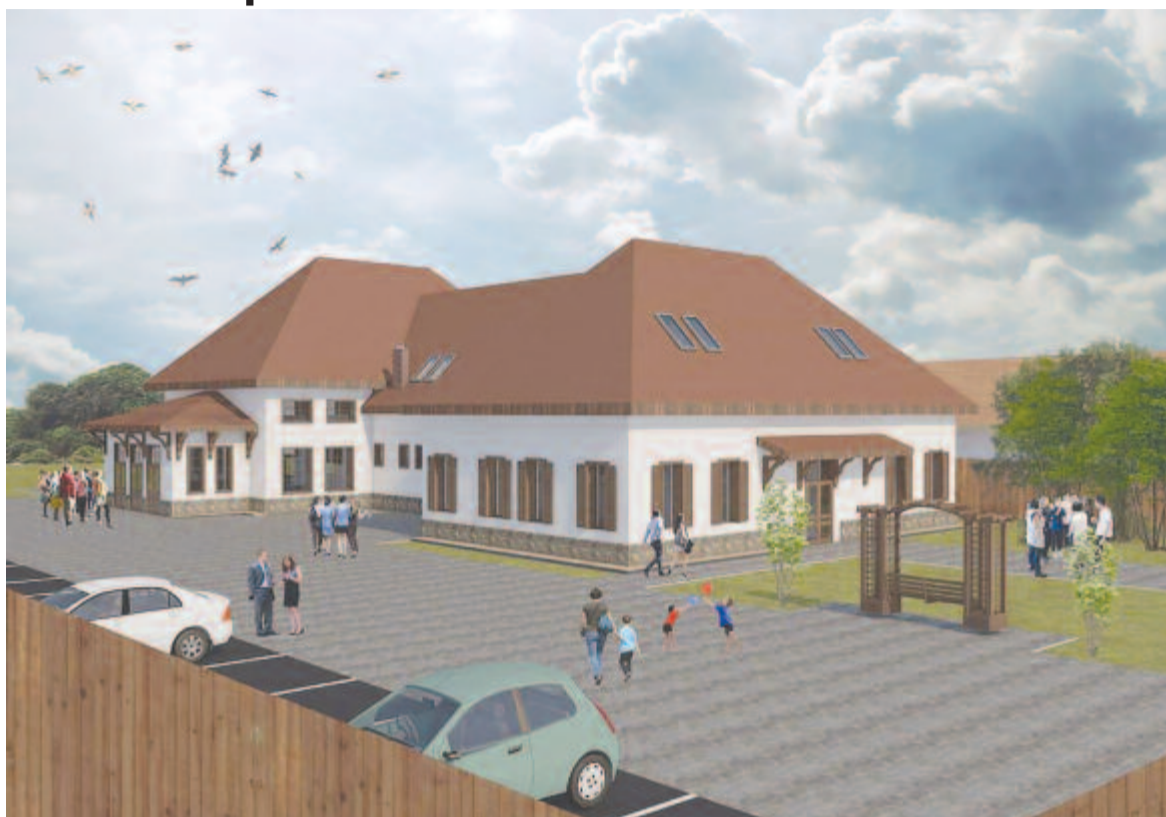
Göcsön közös épületben lesz az iskola és a kultúrotthon

Az utóbbi két évtized állandó fejlesztései ellenére még mindig sok a tennivaló a községben, de lassan elérkezett az idő, amikor saját épületek létrehozásába fektetnek be. Az önkormányzat elkötelezetten dolgozik ezért.