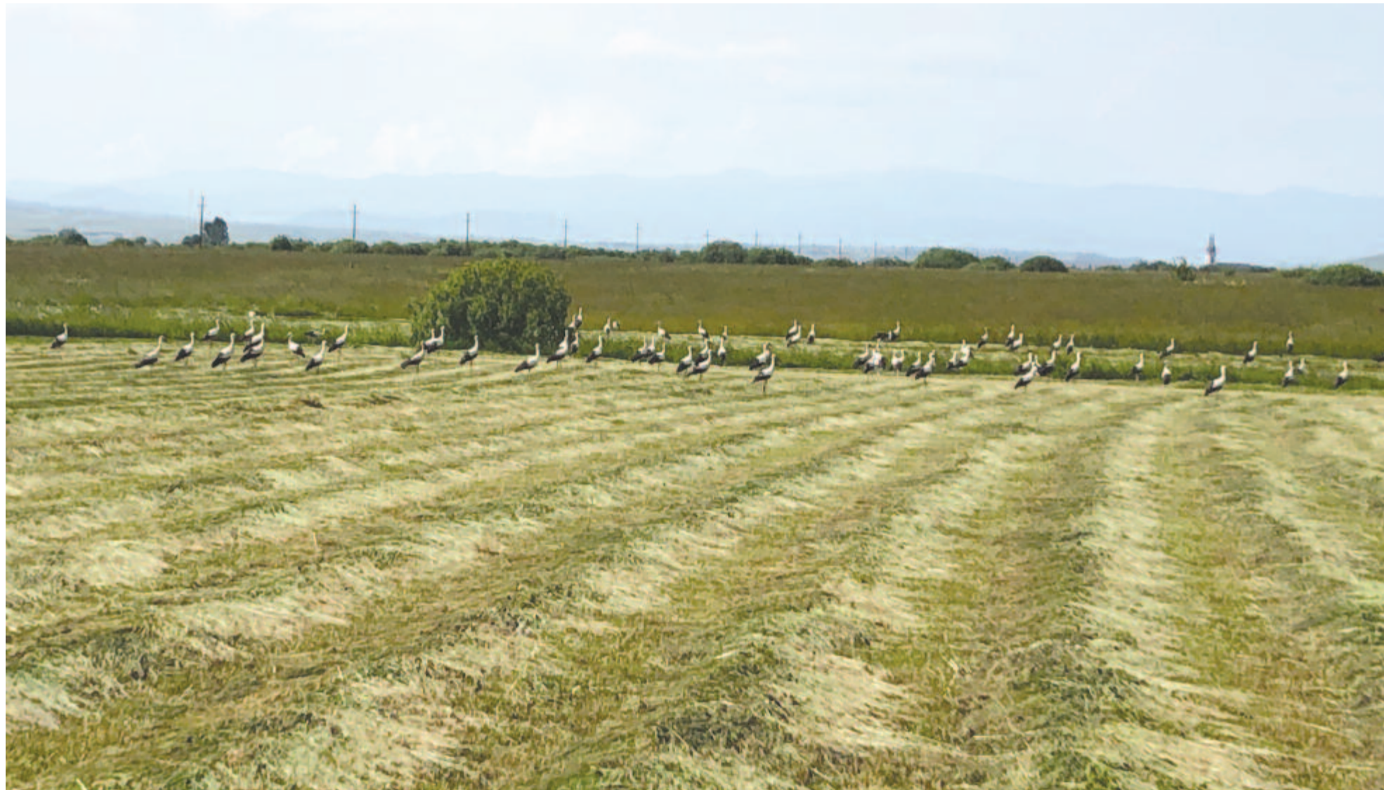
Gólyák a frissen kaszált területen 2019. június 17-én