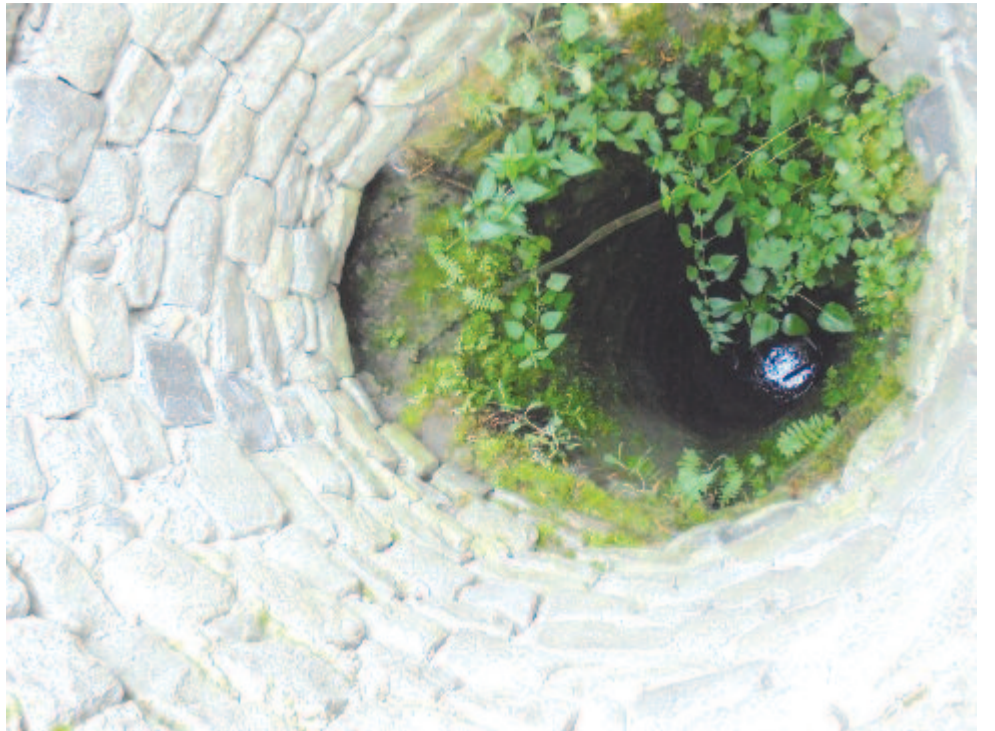
Kút – lejárát az alsó világba

A cél a nap erejének megerősítése volt, a