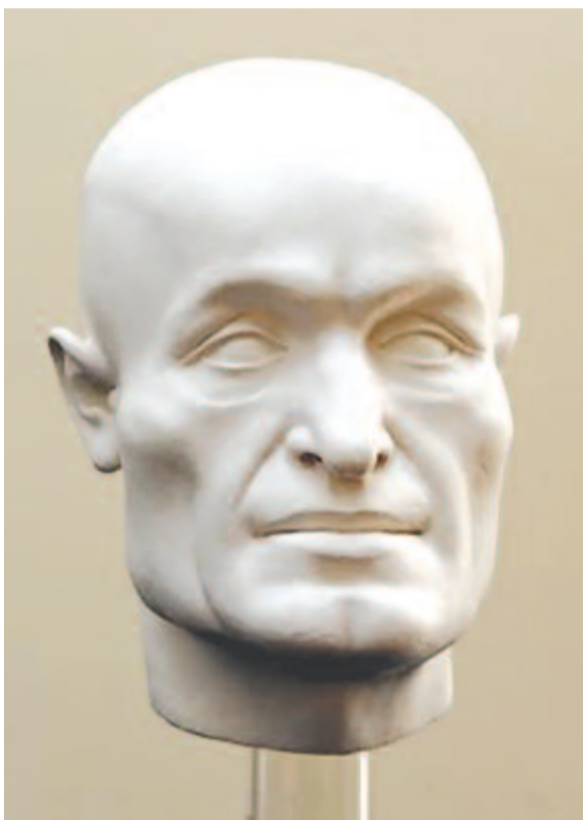
Janus Pannonius arcreekonstrukciója

Büszkék lehetünk arra, hogy magyarként kijelenthetjük, a reneszánsz idején nemzetünk az európai kultúra élvonalában állt – amihez hozzátartozott a zene is.