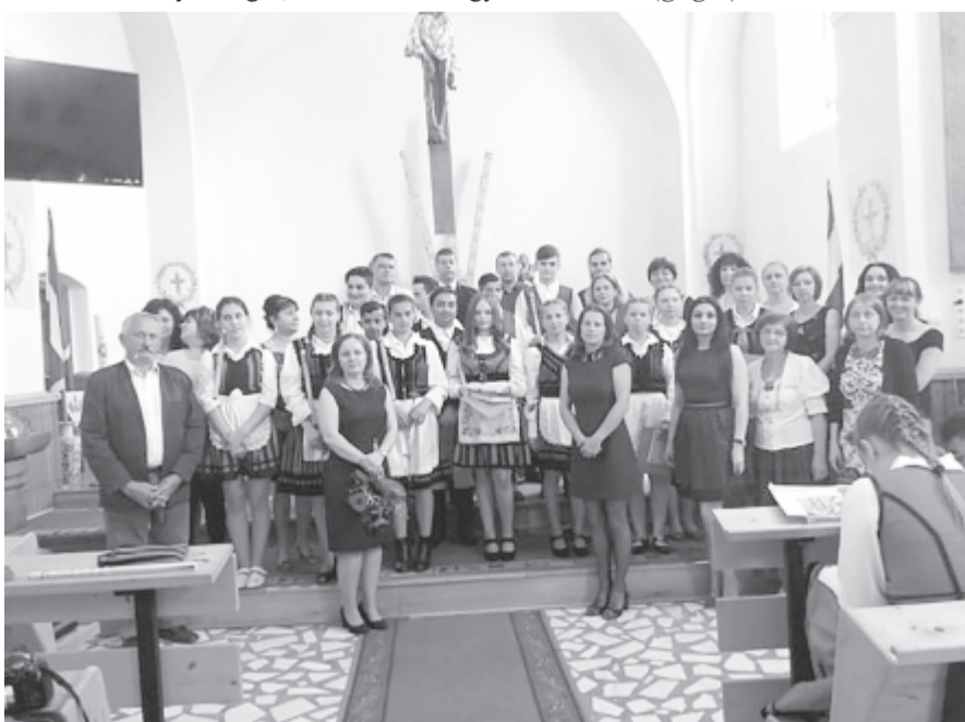
Hagyományosan szentmise keretében búcsúztatják a végzős diákokat a községben