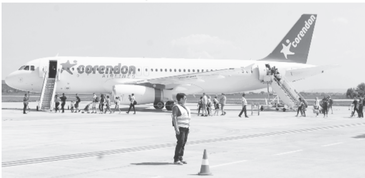
Felszállnak az utasok a Corendon Airlines gépére. Úti cél: Antalya