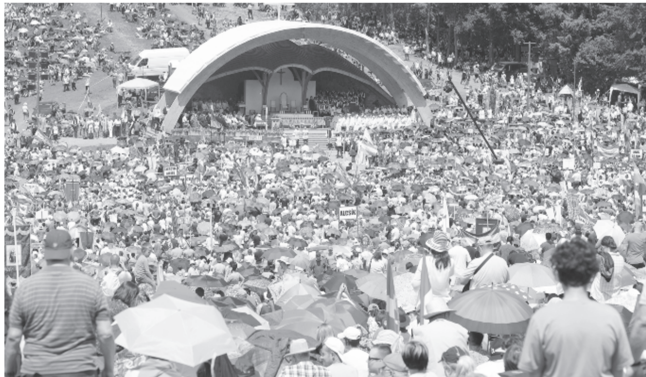
A csíksomlyói búcsú miséjének résztvevői a Kis- és Nagysomlyó közti nyeregben 2019. június 8-án.

A két csíksomlyói zárandoklat ölelte „nyújtott héttbe” ékelt köpködős, kődobálásos provokáció két lényeges kérdésre adott választ. A Kárpát-medencei magyarságot – bármennyire irritálja a berlini multikulti bukta csodálót ez – ma is tápláló csodálattal tölti el a hágók védelmezésére települt székelység kitartása. Ez az öntisztuló forrás eddig is képes volt, s képesnek kell lennie az idegen kultúrájú hatalom flegmáját lemosni Ábel fiáról. A másik kérdés a hatalom viszonyulása. Felvételek sokasága bizonyítja, hogy a kormányfő kedvenc főcsendőre, aki a tavaly augusztusi bukaresti tüntetésen vívott ki magának elévülhetetlen gyűlöletet, két kapura játsza tette lehetővé a román sírgyalozók úzvölgyi kegyhelyfoglalását. Ezek után nem csoda, hogy a csendőrség nem találja a provokátorokat, és a román külügy fittyet hány a magyar diplomácia felszólítására. Nekünk, akik megértjük a marosvásárhelyi fekete március, meggyőződésünk, hogy az ügy nyertesétől a politikai-gazdasági maffia érdekeivel összefüggő karhatalmi erők lesznek. Hát így köpnek szembe minket, bizakodó magyarokat és jóhiszemű románokat a hatalom bitórlói!