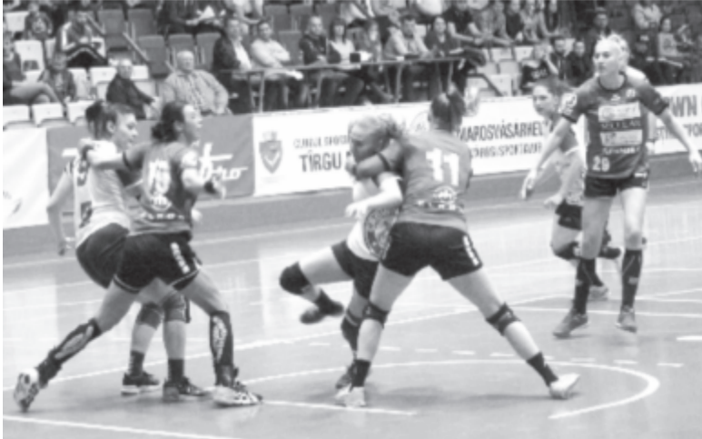
A kolozsváriak minden különösebb erőfeszítés nélkül szerelték le a marosvásárhelyi támadásokat, miközben túldalt szinte minden lövés gólt jelentett. Így sokkal kategorikusabb vereséget szenvedtek az U-tól, mint a kupában a tavasszal, amikor ez a felvétel készült. Fotó: Nagy Tibor

Csak hogy a második mérkőzés – a Kolozsvári U elleni – megpecsételte a marosvásárhelyi csapat sorsát. A találkozó (és ezzel együtt az is, hogy a CSM az ősztl is az A osztályban játszik) már az első tíz percben eldőlt. Lassú, minden fantáziát és átütő erőt nélkülöző támadások, ellenfélnek adott passzok, fél méterrel a kapu fölé küldött lövések. Eredmény: a 9. percben 5-1-re vezetett Kolozsvár. És a folytatás sem volt jobb. A CSM teljesen nélkülözötte a gyors kontrákat, amely az idényben az egyik leghatásosabb fegyvere volt. Darie szinte soha nem kapott használható labdát a