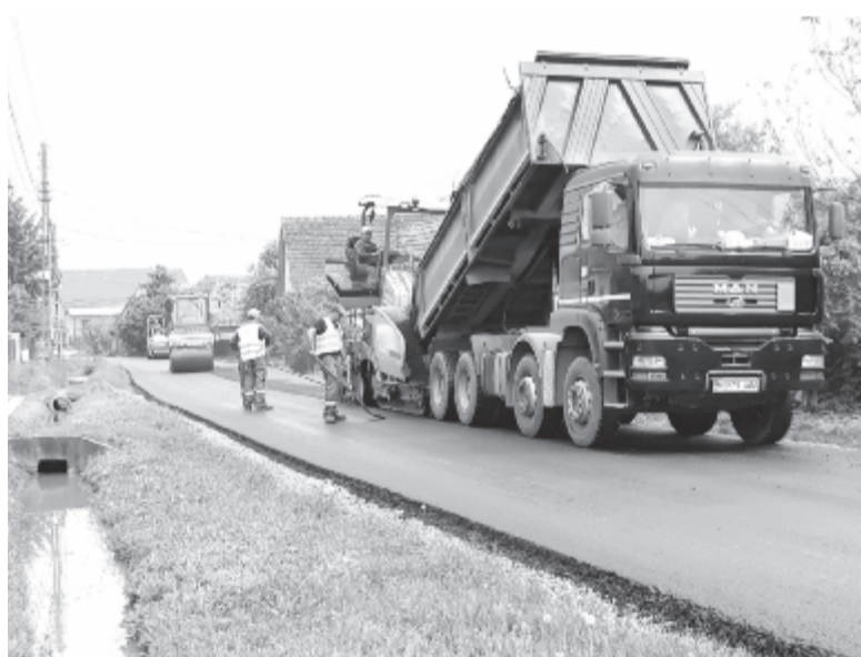
Gyorsan és jól dolgozik a kivitelező, ősz elejére befejezi a munkálatokat