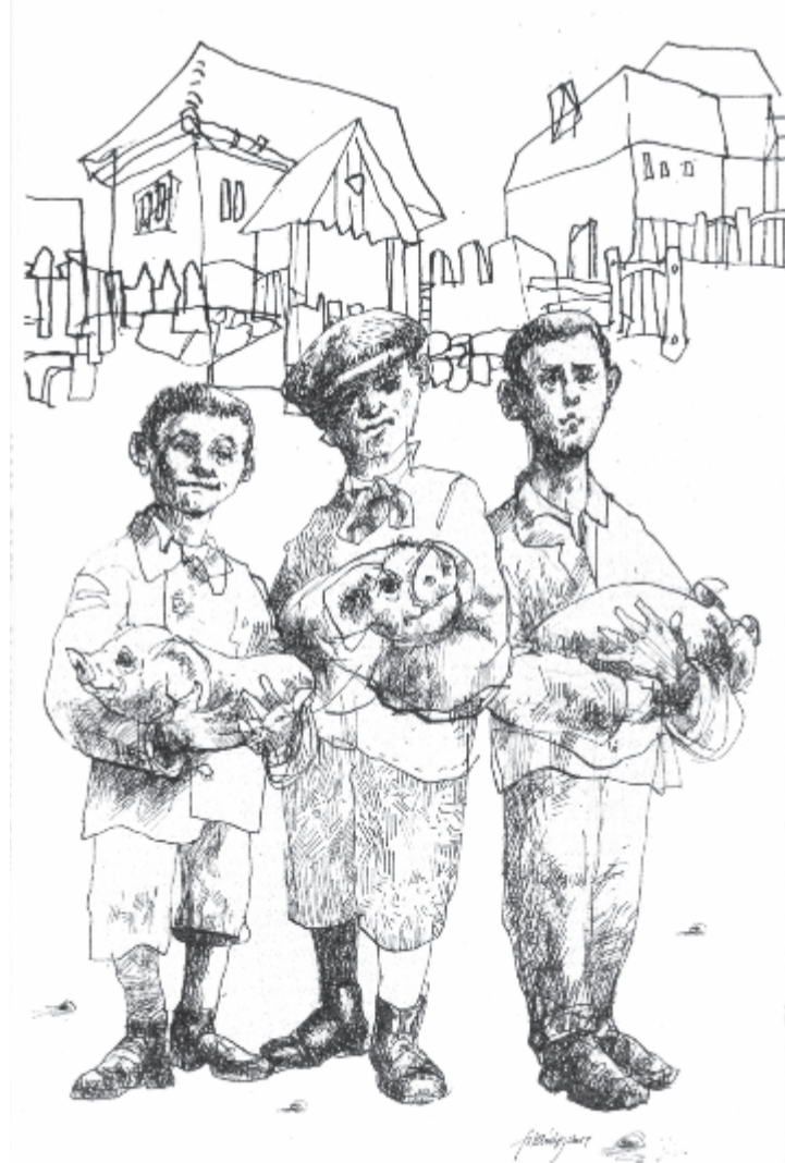
Siklody Ferenc illusztrációja