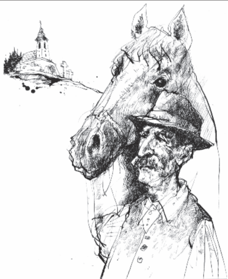
Siklody Ferenc rajza Sebestyén Péter új kötetének a borítóján

*81 éve, 1938. június 7-én hunyt el a költő