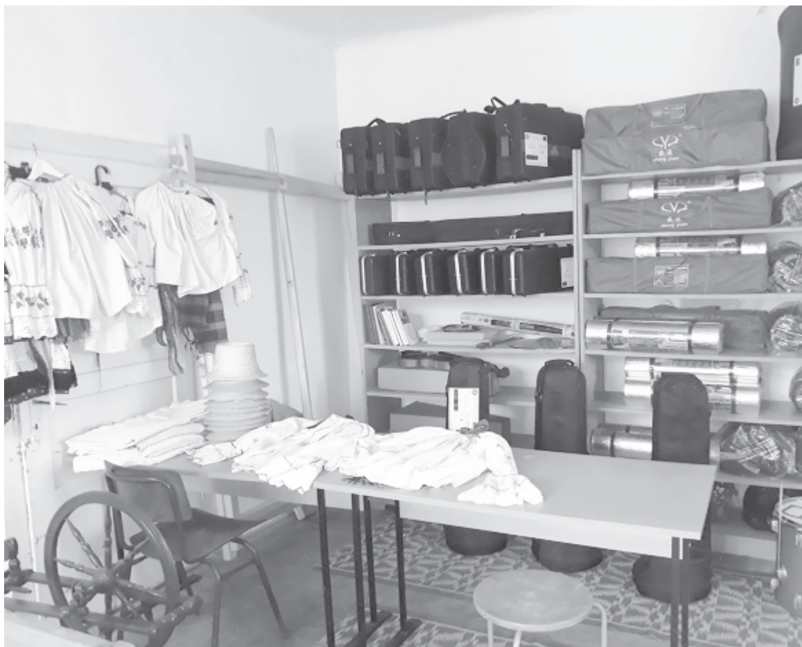
Korongozógépek és szövőszékek vásárlásával a népi mesterségek megismerését ösztönzik

pítása. A pályázat által olyan örökségvédelmi lehetőséghez jutott a Százfonat, amelyet saját forrásból nem tudott volna fedezni – véli az egyesület vezetője.