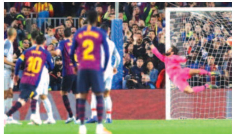
A katalánok sztárja a Liverpool elleni BL-mérkőzésen pazar szabadrúgásgóllal érte el a hat-százas határt.

Pályafutása során 85 ellenfél ellen lépett pályára, 76-nak betalált. Legtöbb gólját a Sevillának lőtte, 37 meccsen 36-ot. Utána következik az Atletico (29/38), a Valencia (27/32) és a Real Madrid (26/41). Messi csak az Udinese, a Murcia, a Gamenet, a Cádiz, az Al-Sadd, a Rabinet, a Benfica, az Inter és a Rubin Kazany ellenében nem tudott betalálni. A kapus, akinek a legtöbb gólt (21) lőtte, Diego Alves (Almeria és Valencia), a Liverpool célterületét őrző Alisson Becker pedig a 151. volt, akit az ötszörös aranylabdás matolni tudott.