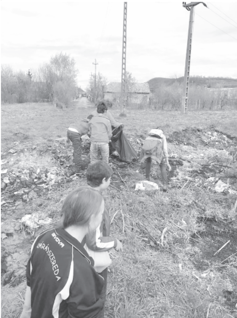
Három helyszínen gyűjtöttek hulladékot, de a környezet megtisztítása a közeljövőben is folytatódik