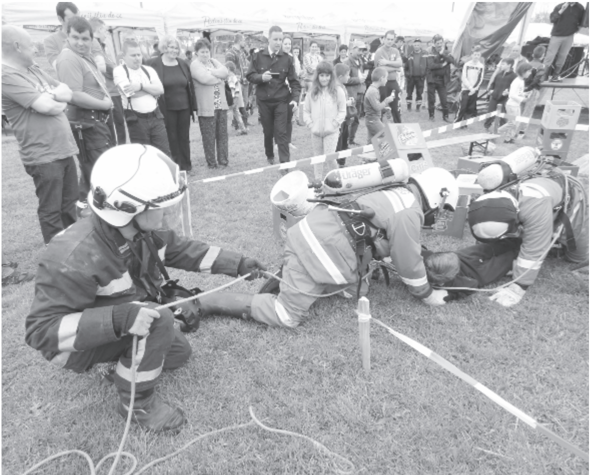
Az önkéntes tűzoltók is komoly felkészülést végeznek, de néha a találkozásra, szórakozásra is szánnak időt