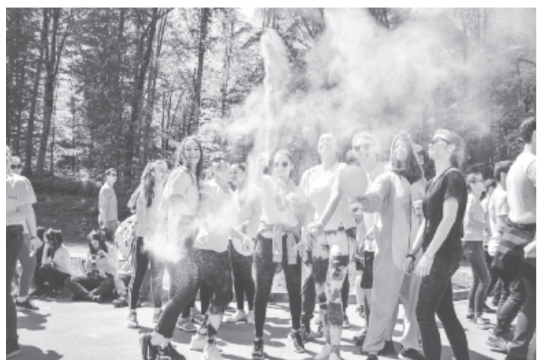
Nem hiányzott a zumba és a fiatalos jókedv sem