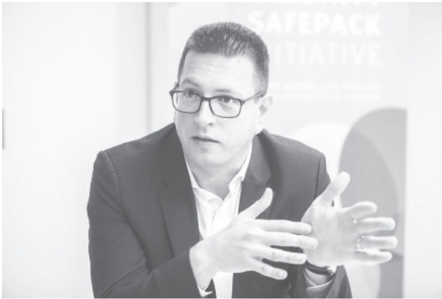
Vincze Loránt, a FUEN elnöke

Vincze Loránt kifejtette, a kisebbségi oktatás terén egységes európai standardok felállítására van szükség, a FUEN-nek és partnereinek ez a célja a Minority SafePack kezdeményezéssel, és reményét fejezte ki, hogy az ENSZ fórumának következtetése is ezt fogja szorgalmazni. Ismertette a szervezet oktatási szakértőinek következtetéseit. Ezek értelmében a kisebbségi oktatás kapcsán a minden szintű oktatás biztosítása, a megfelelő finanszírozás, a döntéshozatalban való részvétel és az önálló intézményrendszer megléte a