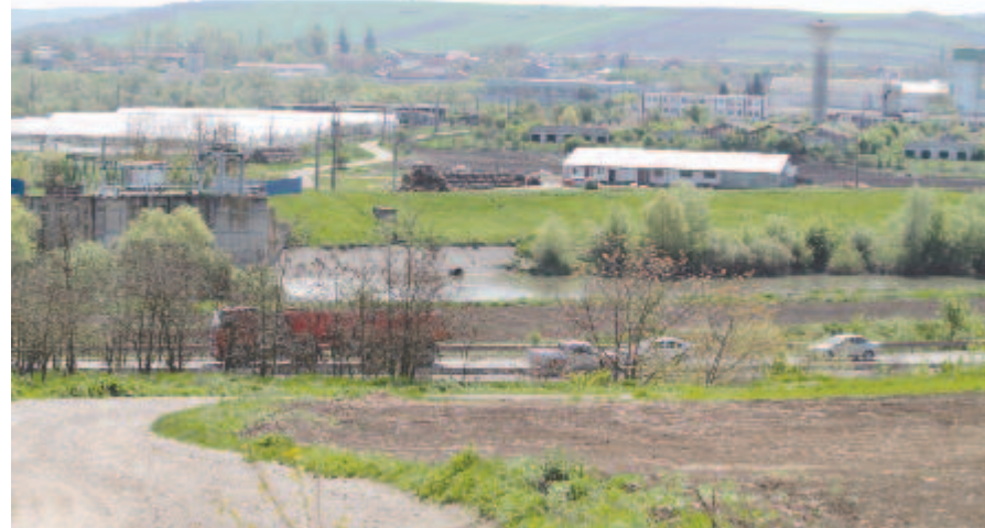
Ahová a hidat tervezik

– Ha Marosludas megkapná az engedélyt – amiért az önkormányzat és személy szerint a polgármester nagyon keményen lobbizik – arra, hogy a cukorgyár mellett egy bekötőút épüljön az E60-as és az ipari telep között, az lenne a legjobb megoldás, hiszen a tehergépkocsi-forgalom erre az útra terelődne, s a város központjában megszűnne vagy jelentősen csökkenne a kamionforgalom. Ez nagyon fontos lenne a városnak, hiszen az ipari zóna nagyon fejlődik, egyre több cég működik itt, s gazdasági szempontból nagyon is indokolt az út megépítése, amihez a Maroson átívelő híd megépítésére is szükség lesz.