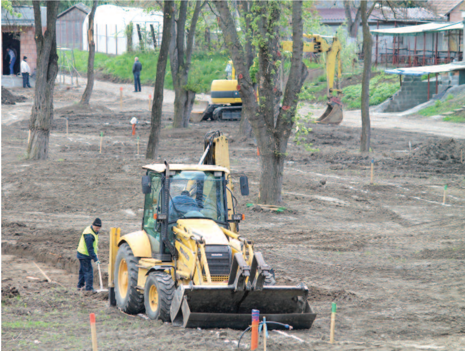
Marosludasi vendégoldal a 6. oldalon