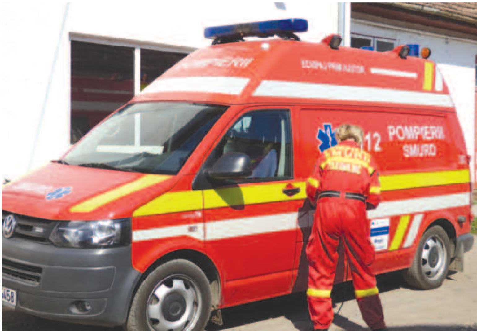
A bérek szavatolva vannak, a légénység készen áll a bevetésre