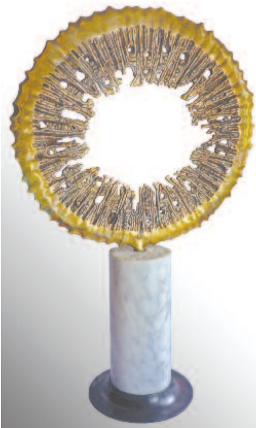
Rozsnyay Béla: Napkorong

Időtlenésre törekszem és összhangra a természettel.” Immár nem mérhető számára az idő, a természet befogadja. Legyen békés a pihenése. (N.M.K.)