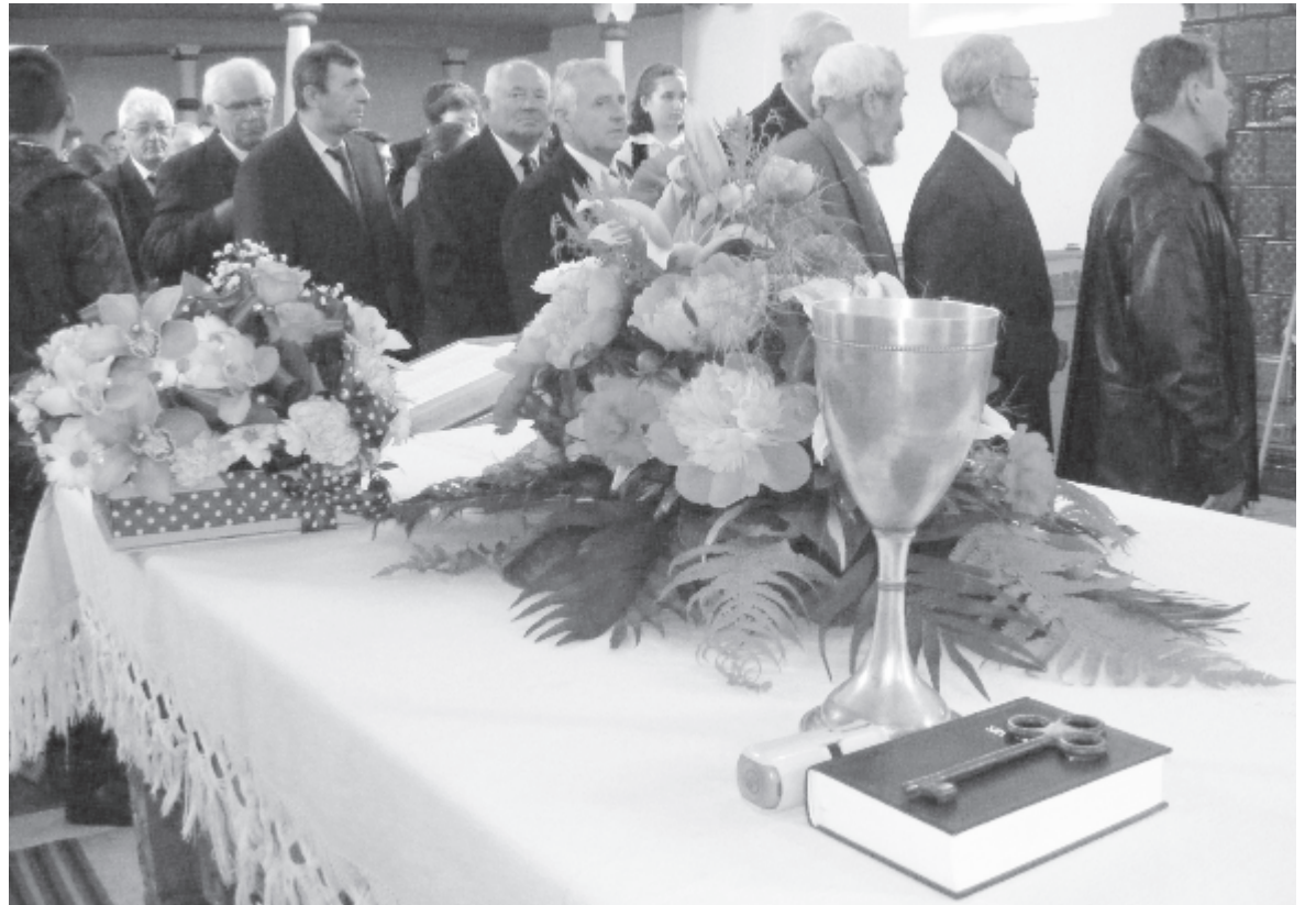
Az egyházközség jelképei