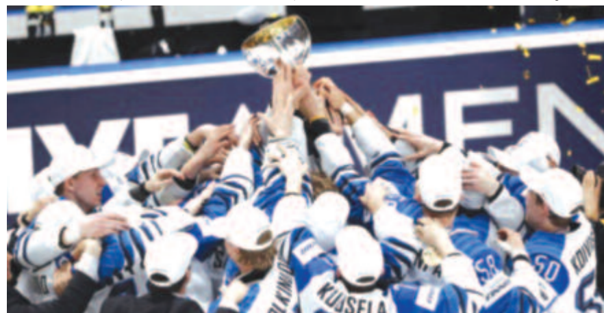
Finnország nyerte a jégkorong-világbajnokságot.

* Négy gólt lőtt vasárnap a már biztos kieső Concordia Chiajna a Jászvásári CSM Politehnicának az 1. ligás labdarúgó-bajnokság alsóházi rájátszásának 13. fordulójában. Az eredmény 4-1. A nap másik találkozásán a Medgyesi Gaz Metan mindhárom pontot elvitte Călăraşi-ról, ahol 1-0-ra nyert a helyi Dunărea ellen. A forduló másik két mérkőzését tegnap, lapzárta után rendezték, a FC Voluntari a Nagyszebeni Hermannstadtot fogadta, a FC Botoşani a Bukaresti Dinamóval mérte össze erejét. Az alsóházi állás: 1. Medgyesi Gaz Metan 45 pont, 2. Bukaresti Dinamo 42, 3. FC Botoşani 38, 4. Jászvásári CSM Politehnica 31, 5. FC Voluntari 27,