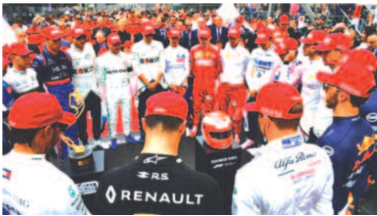
A rajt előtt egyperces gyászszerűn emlékeztek meg a múlt hétfőn 70 évesen elhunyt háromszoros világbajnok osztrák Niki Laudáról.

A start gond nélkül zajlott le, Hamilton megtartotta a vezető pozíciót, mögé Bottas és Max Verstappen (Red Bull) sorolt be a második és harmadik helyre. A 15. kockából rajtoló Charles Leclerc (Ferrari) igyekezett nagyon hamar előrébb jönni, de az egyik előzési kísérleténél megpördült, defektet is