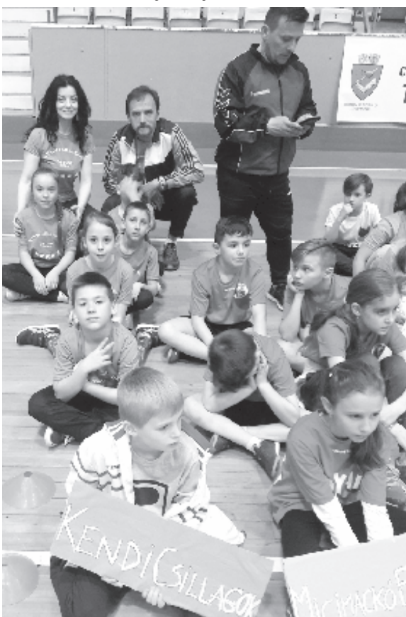
Pillanatkép a díjazásról