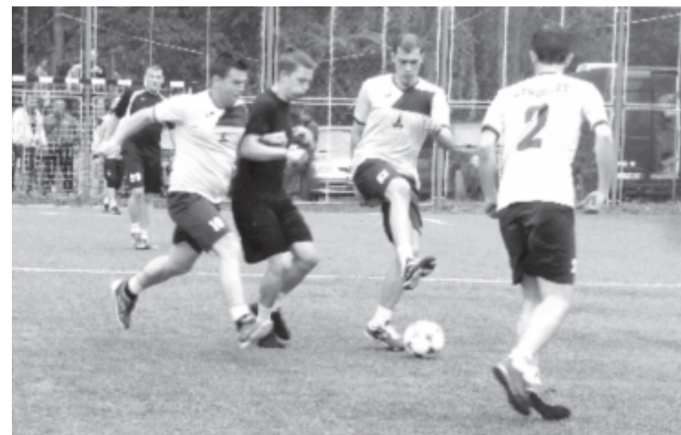
A legnépszerűbb sportszámnak a kispályás foci bizonyult.