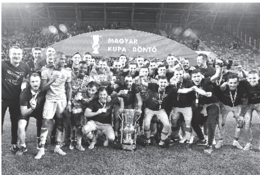
A MOL Vidi FC játékosai ünneplik győzelmüket a labdarúgó Magyar Kupa döntőjében a Budapest Honvéd ellen játszott mérkőzés után.

A kispesti szurkolók a csapatok kivonulásakor piros-fekete füstbe borították a szektorukat, és azzal a szöveggel fogadták kedvenceiket, hogy „kupát mindenáron”. Az első percek kiegyenlített játékot hoztak, mindkét csapat a biztonságos védekezésre helyezte a hangsúlyt, kockázatot egyik fél sem vállalt a támadásvezetések érdekében. Az első helyeztet Holender Filip hagyta ki, aki ziccerben hat méterről nem találta el a kaput. Az OTP Bank Liga társigkirálya másodikára már nem hibázott, az ellene elkövetett szabálytalanság miatt megítélt büntetést a jobb kapufa érintésével értékesítette. A Honvéd lendületben maradt a vezetés megszerzését követően, több veszélyes akciót vezetett a széleken, a befejezések viszont nem sikerültek. Később néhány percre beszorította riválisát a Vidi, de helyzetet nem tudott kialakítani, majd ismét a kispestiek vezettek veszélyesebb akciókat. Amíg a Honvéd