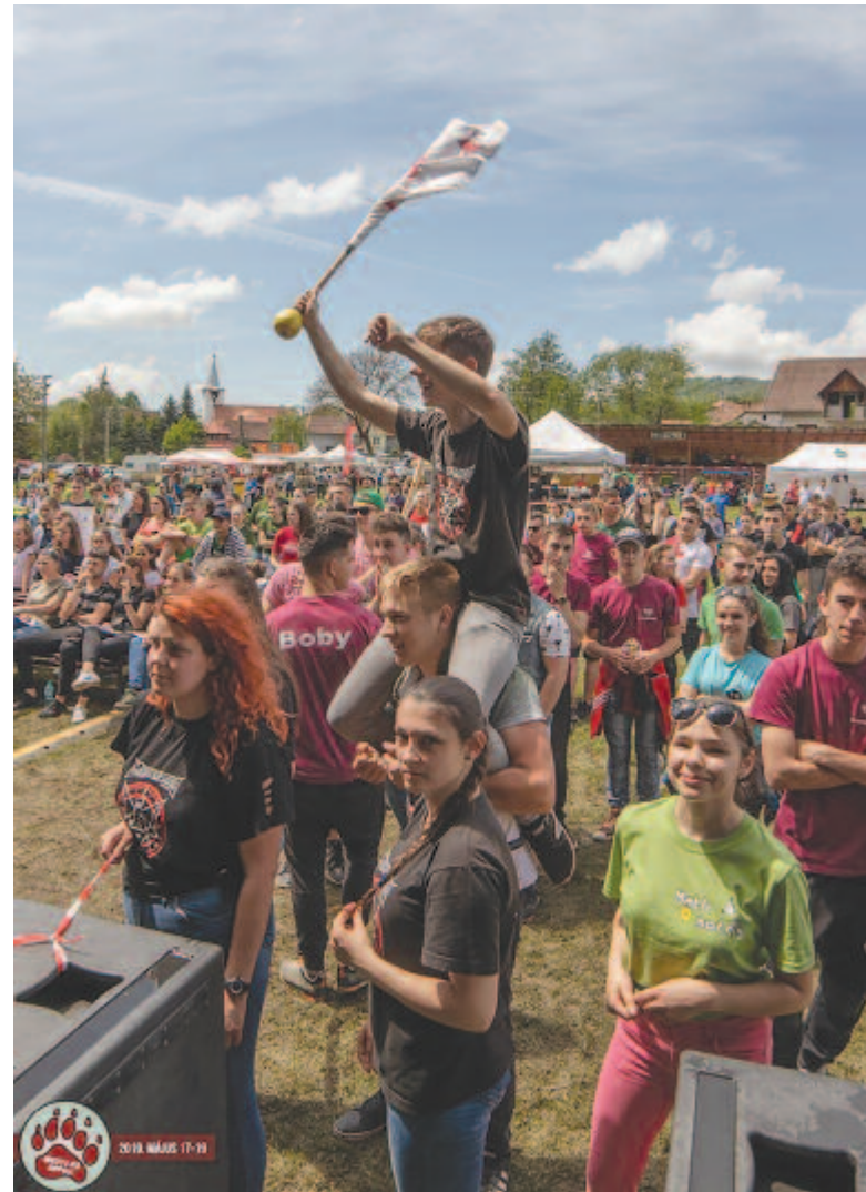
Tömeg a pénteki gyermek- és ifjúsági programokon

tal, gumicsizmával „felszerelkezve” részt vesznek a rendezvényeken. Húsz évvel ezelőtt fiatal kézilabdásként ő is részt vett az első városnapi rendezvényen, amelyet a Medve-tó melletti körforgalomban rendeztek, azóta minden évben ott van, így rálátása van arra, hogy honnan indult és hová jutott az ünneplés: órást fejlődött mind tartalmilag, mind anyagi vonatkozásban. A szükséges pénzalapokat a város és nagyobb helyi vállalkozások biztosítják, de nem erre, hanem az eredeti célra kell összpontosítani: a Medve-tó május végén jött létre, ezt ünneplik. A lényeg, hogy a nyári turistaidény előtt olyan rendezvényt szervezzenek, amely nemcsak a helyieket, hanem a turistákat is megmozgatja, szórakoztatja. Ma is ez a cél: mindenki elégedetten térjen haza, a turisták pedig vigyék el a fürdőváros jó hírét. Ezt valószínűleg sikerül is elérni, hiszen egyre több idegen és környékbeli érkezik Szovátára a Medve-tó napjaira.