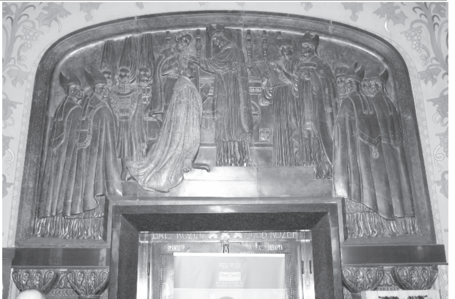
Sidló Ferenc: I. Ferenc József megkoronázása (Kultúrpalota)

2006. május 8-án, 13 éve hunyt el a Kosuth-díjas, négyszeres József Attila-díjas költő, író, esszéíró, műfordító, a Digitális Irodalmi Akadémia alapító tagja, a magyar költészet napjának kezdeményezője. 85 évet élt.