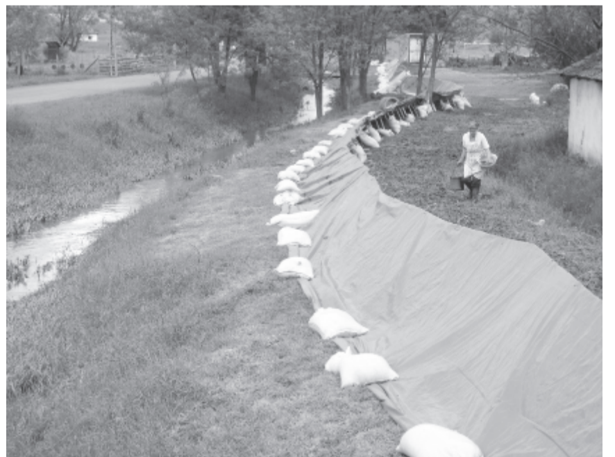
Hodoson a Nagy-patak mellett lakó családokat érintette leginkább a levonuló árhullám