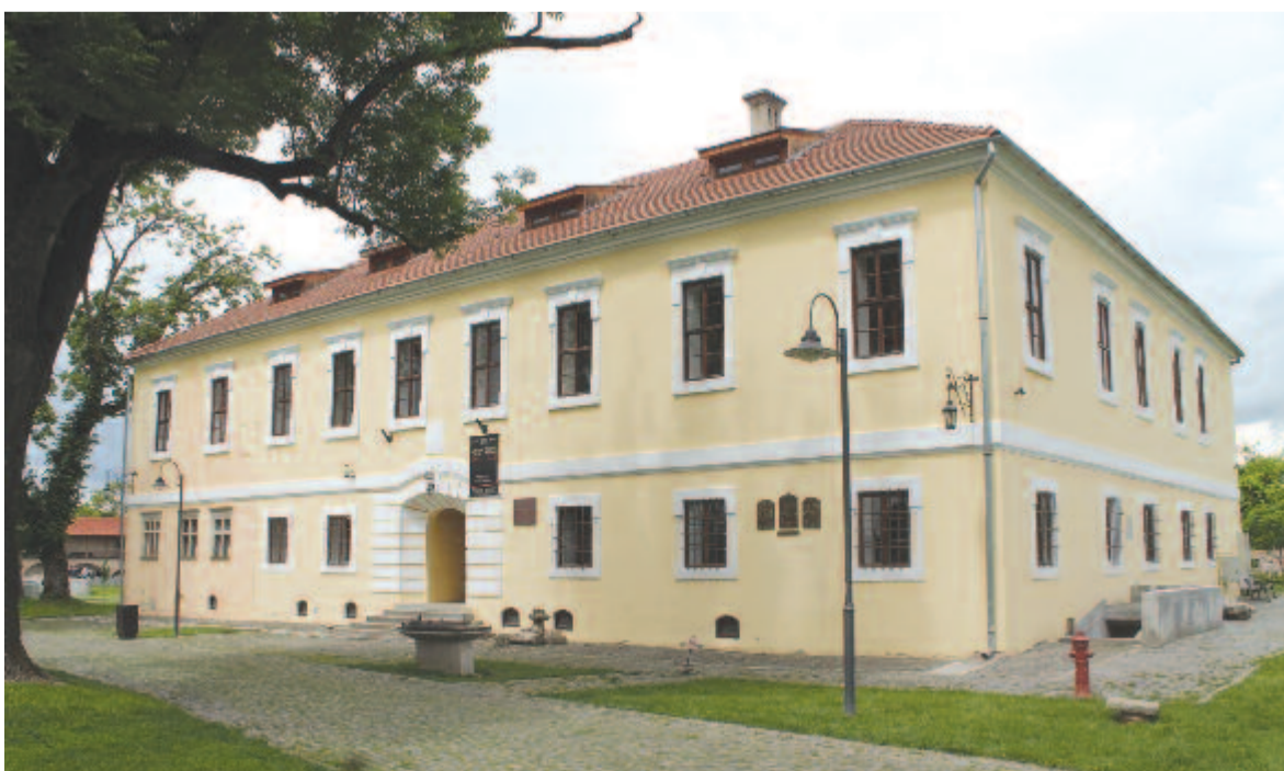
A régi, várbeli városháza