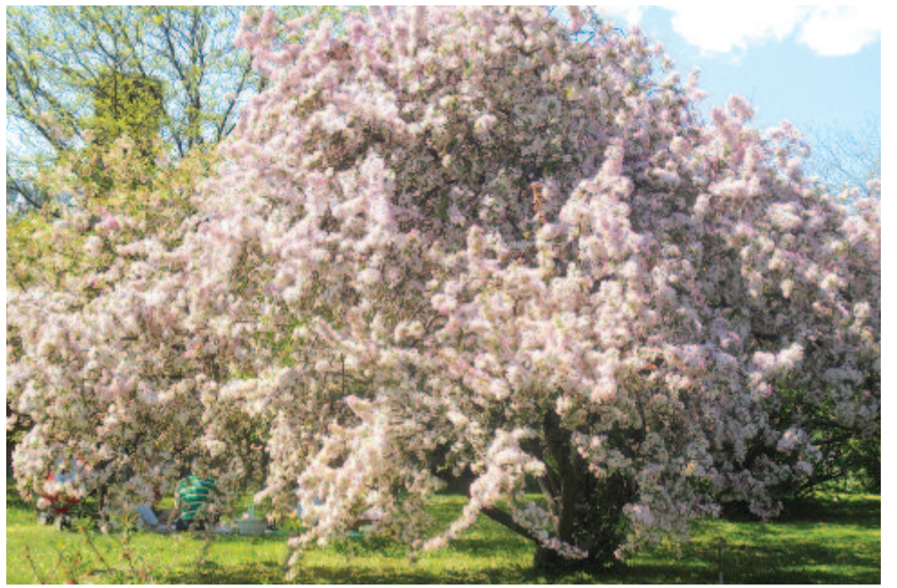
Ösvény nincs a gyümölcsfa-labyrinthban; fűvel van a fák alja benöve egészen

Hanem ahol a fák közül kilátni, ott egy virágos kert hívogat a közelebb jövőre, az is csodálatos mezei virágokból összegyűjtve, miket a szokott kertekben nem találni, a sötétkék csengettyűkék csoportjai, a selyemtermő krepin fényes gubancokja, pettyes turbánliliomok; az álkörmös vérfürtei, a gyö-