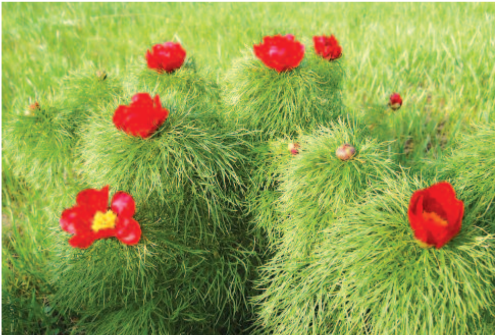
A sztyeppei bazsarózsa levélsallangcsodái fény felé emelik bíbor koronáikat

Ehhez képest kicsiny az a 3,5 hektáros mezőzahi rezervátum, amely a sztyeppei bazsarózsa jégkorszak előtti refugiuma a Kárpát-medencében. A Paeonia tenuifoliát a Nagy-Bota-völgy fejtében 1846-ban találták meg. 1956-ban nyilvánították védetté. A 20-30 cm magas, bokros növény levele finoman szabdalts, sallangjai alig 1 mm szélesek.