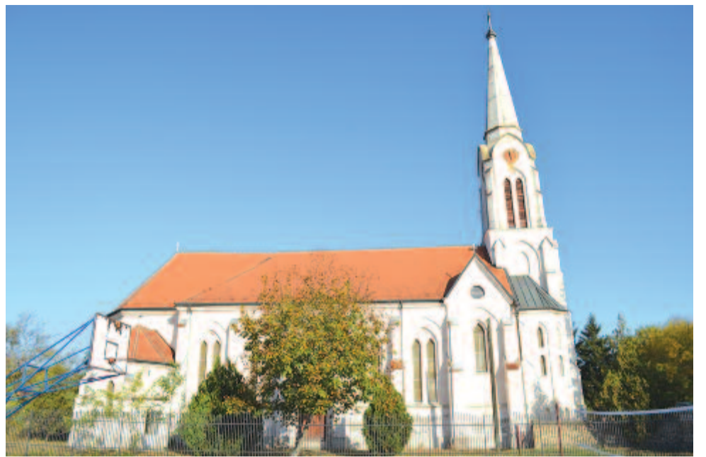
Római katolikus templom magyar és bolgár (palyán) hívekkel