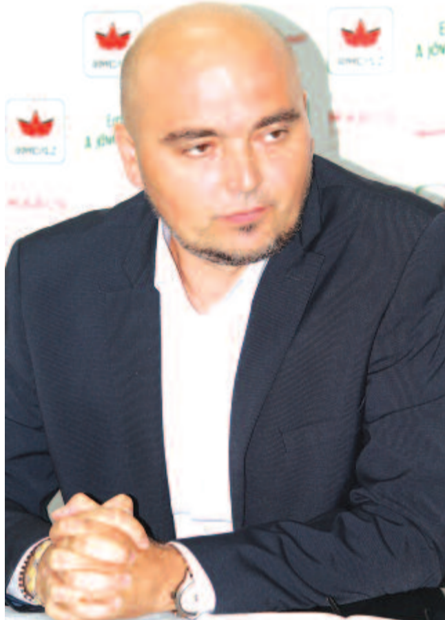
Fotó: Nagy Tibor – Milyen adatokat tartalmaznak a szócikkek?

– A centenárium kapcsán ünnepelni nem volt okunk, de olyan típusú projektekben gondolkodtunk, amelyek segítenek eligazodni közösségünk tagjainak a 20. század történéseiben, konstruktív jellegűek, megmutatják a többségi társadalomnak és magunknak is, amit már Kós Károly is megfogalmazott annak idején a Kiáltó szövegben, hogy dolgozni akarunk, hogy túl akarjunk élni a történelem viharait, hogy értékeremtő közössége vagyunk ennek az országnak. Az arcképcsarnokban száz olyan személyt mutattunk be, akiknek eredményei a saját közösségen túlmutatva a többség szempontjából is mérvadók.