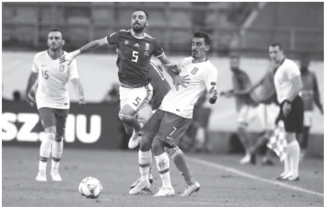
Fiola Attila (5) visszatérőnek számít Marco Rossinál is.

* támadók: Bódi Ádám (Debreceni VSC), Dzsudzsák Balázs (al-Ittihad), Eppel Márton (Kajrat Almati), Holender Filip (Budapest Honvéd), Nagy Dominik (Legia Warszawa), Németh Krisztián (Sporting Kansas KC), Szalai Ádám (Hoffenheim), Varga Roland (Ferencvárosi TC), Vida Krisztopher (DAC), Zsótér Donát (Újpest FC)