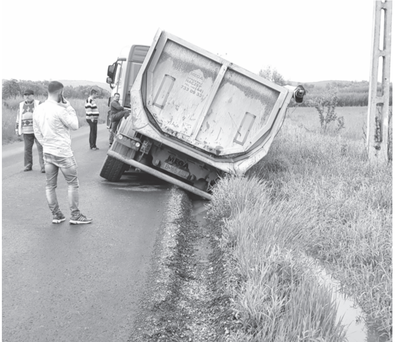
Egy pillanat alatt a sáncban kötött ki a nyerges vontató

Érdemes ébernek lenni az adott szakaszon, de nem csak ezen eset miatt. Az utóbbi időben hullott nagy mennyiségű csapadék miatt az amúgy is keskeny útpadka átítatódott, meglágyult, ezért nem tanácsos ráhajítani. Nem figyelt erre csütörtökön délután egy nyerges vontatót vezető férfi, aki Jobbágyfalvát mintegy 200 méterre elhagyva pillanatok alatt lehajtott az úttestről, és a sáncban kötött ki. A tengelyig elsüllyedt jármű kiemelésére két darusautót rendeltek Marosvásárhelyről, így sikerült kiszabadítani a járművet és visszaállítani a normális forgalmat az adott útszakaszon. (gligor)