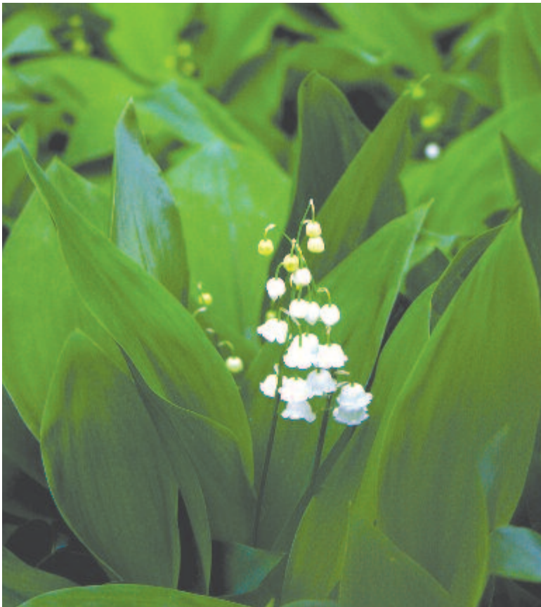
És kling-klang, megszólal a májusi erdők harangja, a gyöngyvirág

Kelt 2019-ben, 500 évvel az első reneszánsz polihisztor halála után