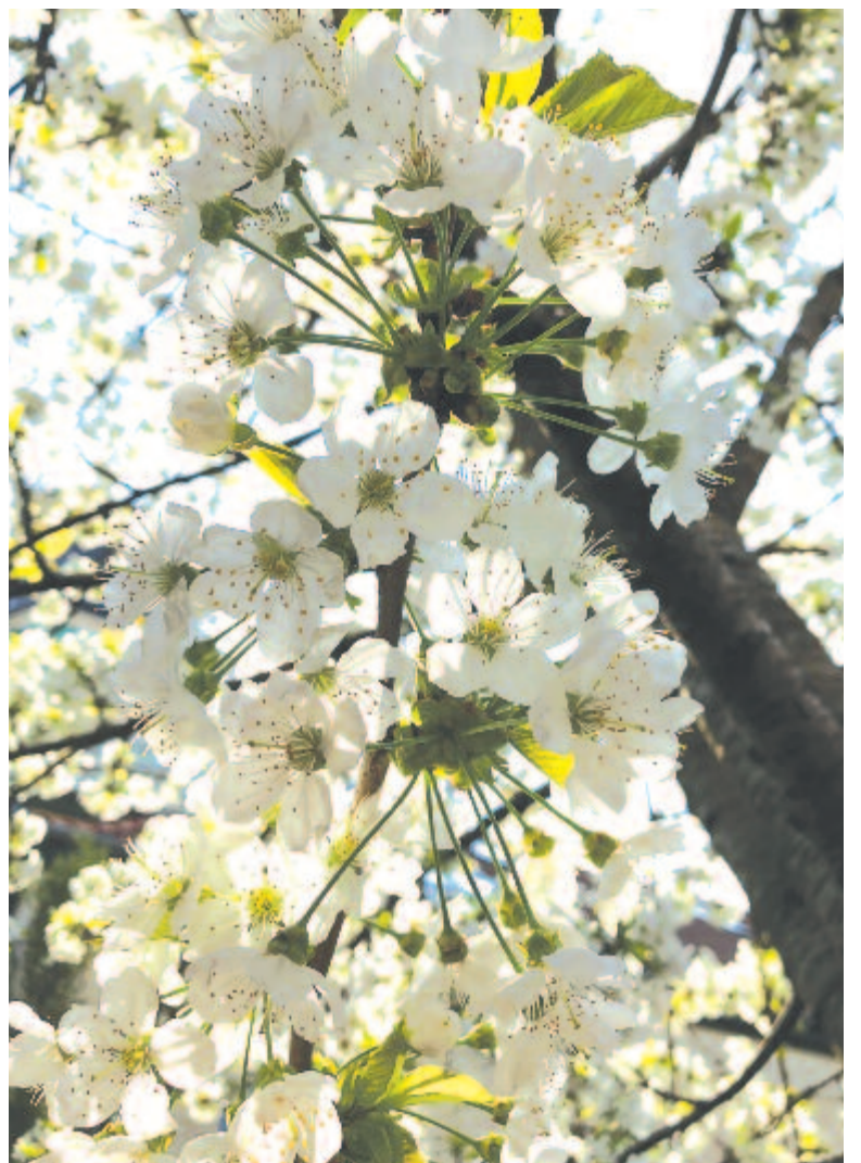
A bimbók reszkető selyemgubóiból zománcos fényű pompa, ezer szelíd szírom lepkéje tört elő

Világ körüli turnéja és több százezer látogatója után március 16-án Magyarországra érkezett a XV. századi zseni több festményének reprodukciója, valamint közel 60 műszaki találmányának interaktív és kipróbálható makettje. Nemcsak festő, hanem a saját idejét több száz évvel megelőző, ezerarcú tudós. A kiállításon több tucat, fából épült találmánnyal is találkozhatunk. Ezeket egy mai olasz mérnökcsoport da Vinci eredeti rajzai alapján állította össze olyan anyagokból, amelyek az ő idejében is elérhetőek voltak.