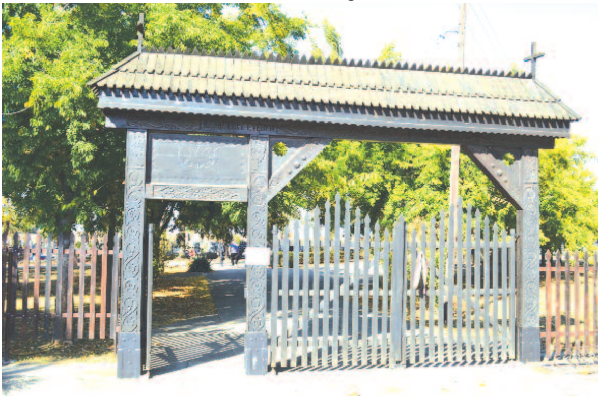
Székely kapu a temető bejáratánál (Székelykeve)

A ma már bozóttal és akácokkal benőtt gondozatlan bukovinai sírokban megpihenők unokái, dédunokái zsigereikben hordozzák a fájdalmas igazságot: őseik, az egész moldvai