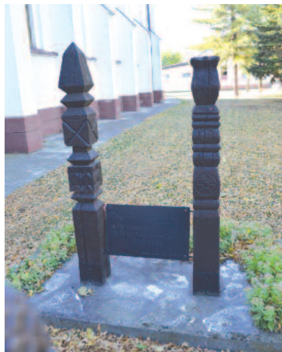
Mi itt vagyunk és itt maradunk, 1886–1996 (Székelykeve)

Hazaérkezésem után a túlélésért küzdő al-dunai magyaroknál a három faluban eltöltött idő – éjszakától összesen húsz óra – hangulatait, beszélgetéseit, a szerzett információkat és a látottakat, tapasztaltakat papírra vettem. A következő cikkben a bukovinai székelyek és az al-dunai települések rövid történetét összegzem, majd külön írásként foglalkozom Hertelendyfalva, Sándoregyháza és Székelykeve múltjával, jelenével és jövőjével. Reményem szerint ezáltal sikerül közelebb hoznom, ismertebbé tennem a bukovinai székely bujdosást, kiemeltem a déli végeken élők mindennapjait. Egyrészt a már említett „minden magyar felelős minden magyarért” jegyében, másrészt annak tudatában, hogy a kisebbségben vagy ma még egyenesen, akár többségben élő magyar közösség részére is csángó sorsot szánnak egyesek. Márpedig rajtunk is múlik, hogy akaratukat ne igazolja az idő.