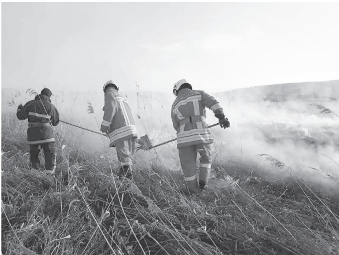
Múlt hónapban tíz esetben riasztották tarlótűzhez a szeredai önkénteseket

ha időben jelzik a tűzoltóknak, azok megakadályozhatják, hogy katasztrófába torkolljon az eset. „Örülünk, hogy megbíznak bennünk, és hívnak” – tette hozzá a parancsnok.