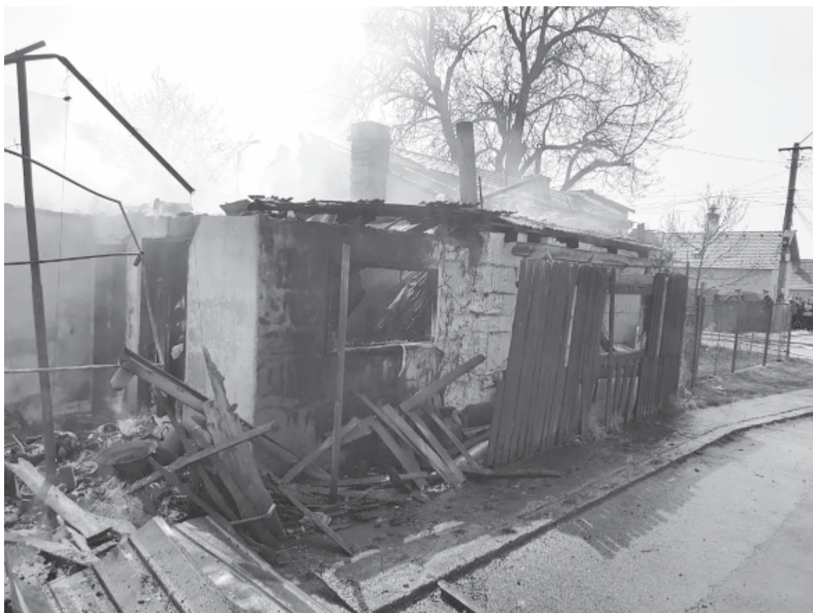
A Rozmaring utcai ház maradványai

Április 7-én, vasárnap a marosvásárhelyi Rozmaring utca 36. szám alá riasztották a tűzoltókat, ahol egy 150 négyzetméteres ház égett le, a tűz oka egyelőre ismeretlen. A gyorsan terjedő lángok között egy 67 éves nő életét vesztette, két személyt pánikrohammal szállítottak a sürgősségi ügyeletre.