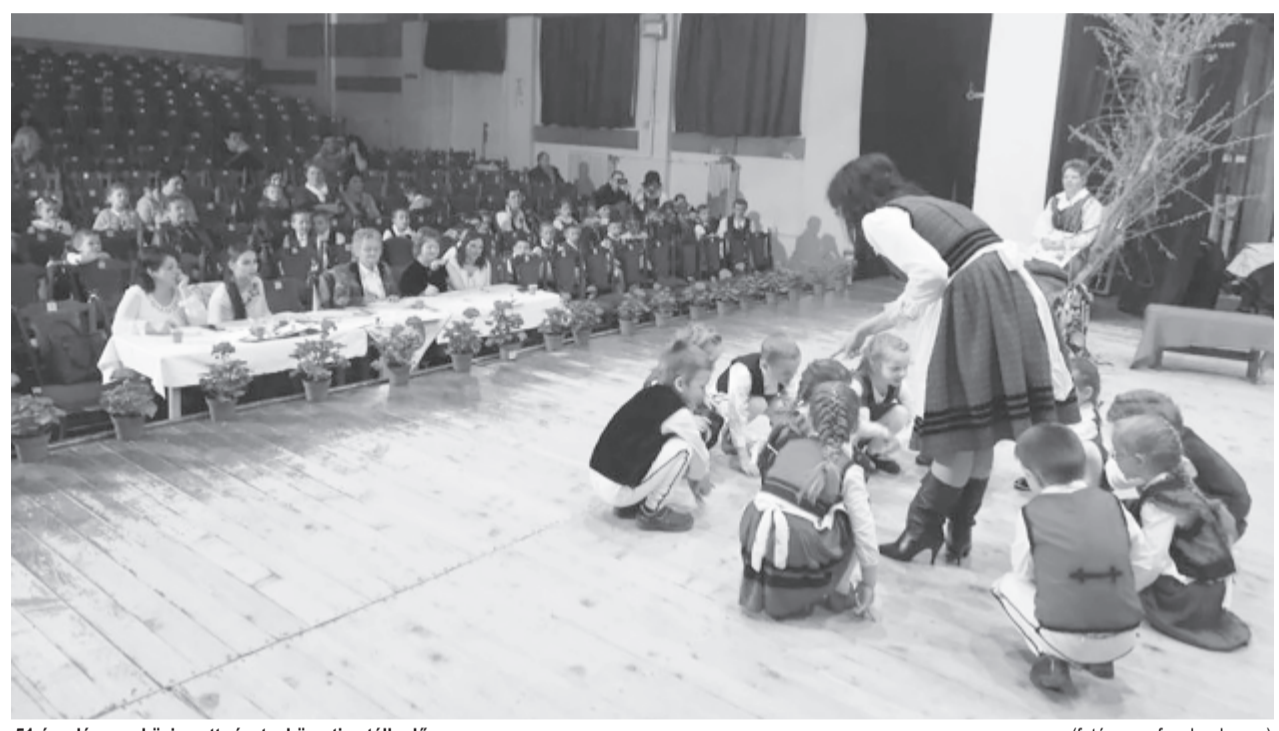
51 óvodás, napközis vett részt a körzeti vetélkedőn