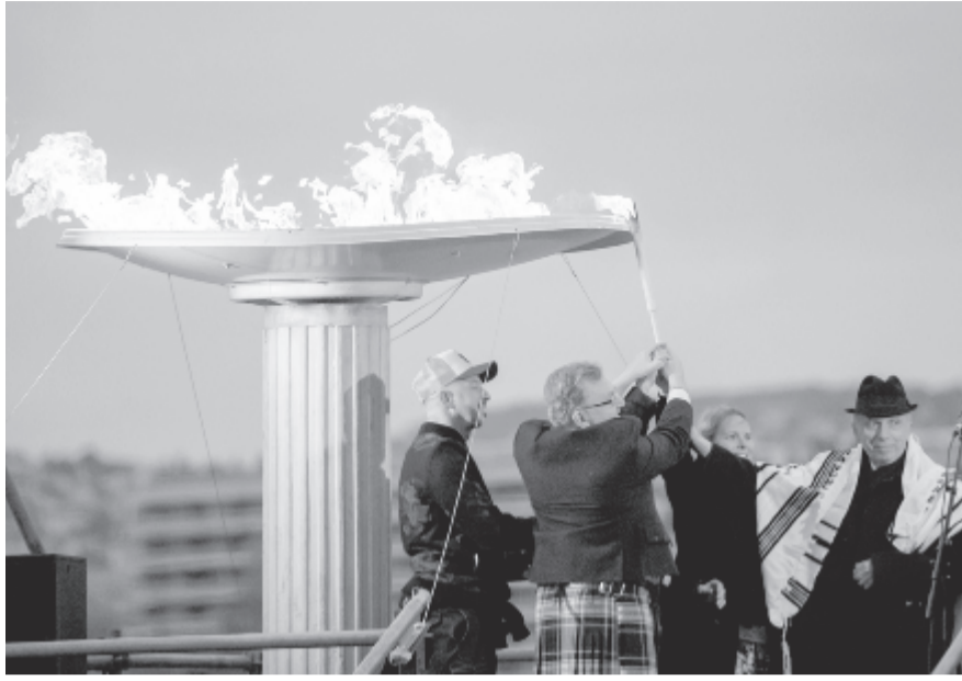
Meggyűjtják az óriásfáklyát a holokauszt magyarországi áldozatainak emléknapja alkalmából megrendezett Élet meneten Budapesten, a Cipők a Duna-parton emlékműnél.