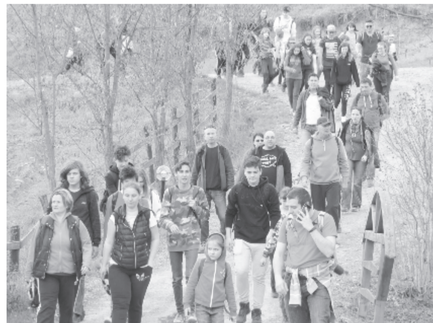
Idén száznyolcvan személy jelentkezett a táv megtételére