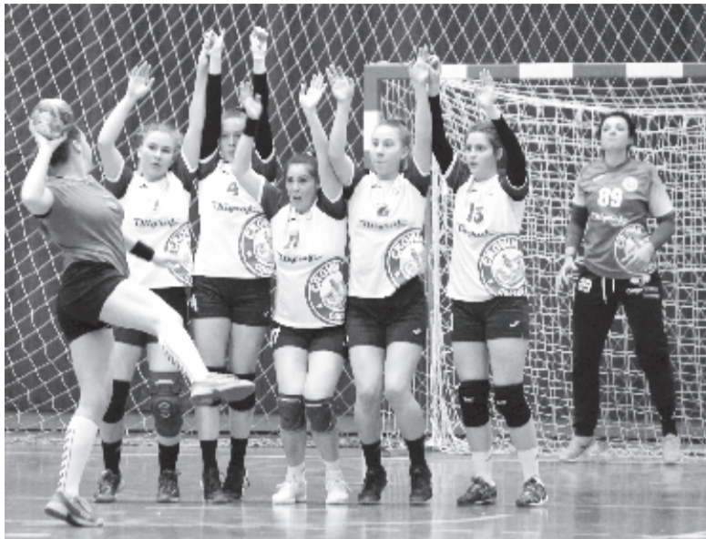
A legutóbbi hazai mérkőzéshez képest szinte egészében más összetételben lépett pályára a marosvásárhelyi együttes a Köröskisjenő elleni, idegenbeli találkozón.

Ilyen körülmények között az eredeti kezdőcsapatból a mezőnyben csak Stăngu tartózkodott a pályán (ő dobta a csapat góljainak több mint felét), és csupán három tartalék mezőnyjátékossal jelent meg a marosvásárhelyi gárda a mérkőzésen, miközben korábban a szakvezetésnek folyamatosan az volt a gondja, hogy kit hagyjon ki a maximálisan nevezhető keretből.