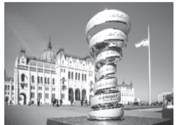
Az olasz országúti kerékpáros körverseny győztesének járó serleg a Kossuth téren, háttérben a magyar Országgyűlés épületével.

Tavaly a verseny össztávja 3563 kilométer volt. A győztes brit Chris Froome a 21 szakaszt több mint 89 óra tekeréssel teljesítette – egy percnél is kevesebb idővel előzte meg a második Tom Dumoulin.