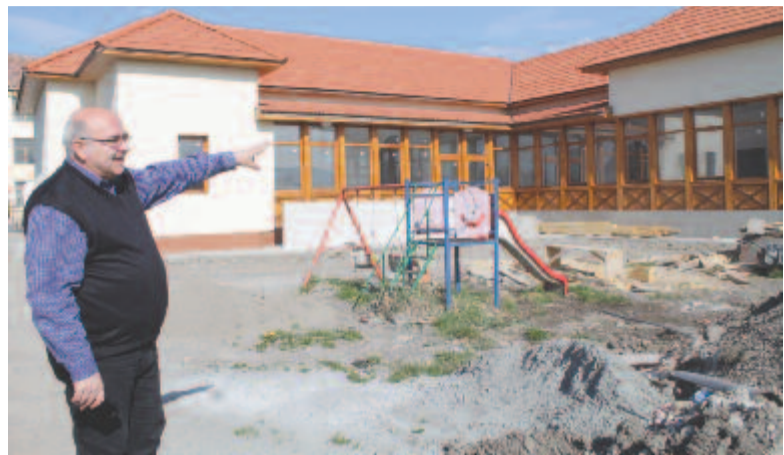
A kibővített óvoda