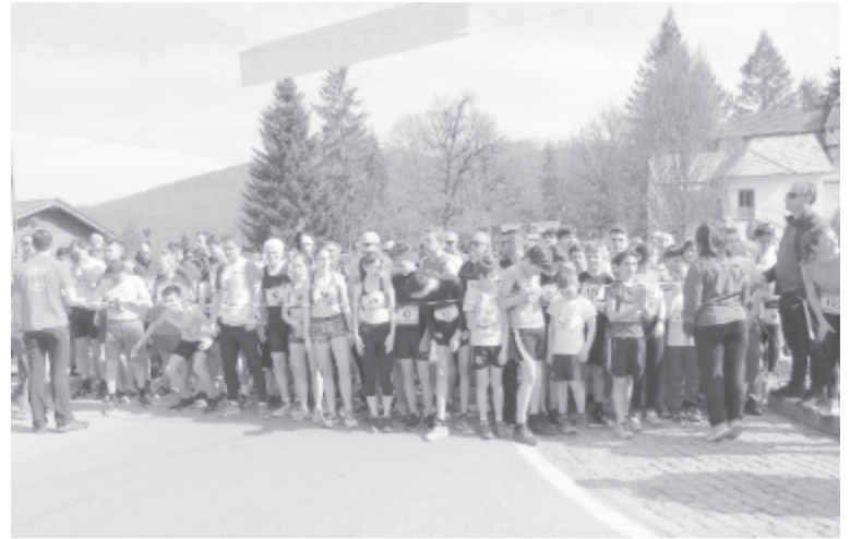
316 versenyző indult, 304 érkezett célba