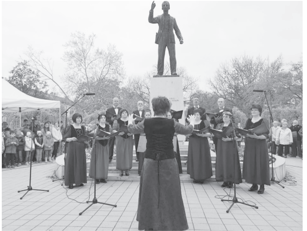
A szovátai kórus és a polgármester Angyalföldön ünnepelt