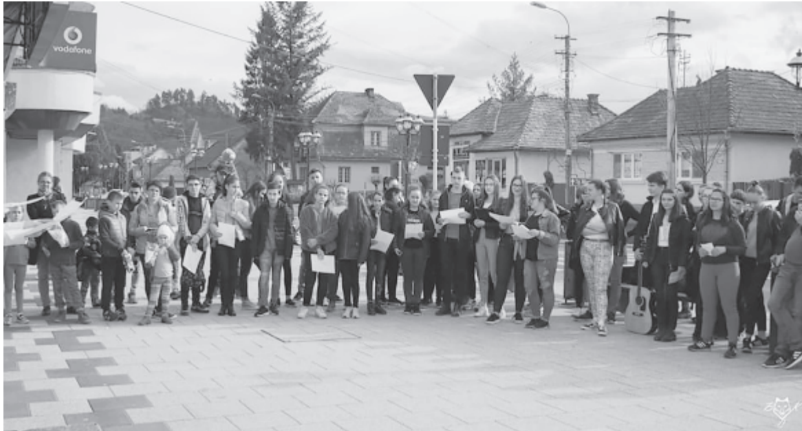
Szovátán első alkalommal szerveztek verses villámcsődületet