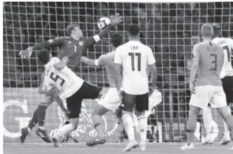
Legutóbb a Nemzetek Ligájában találkozott Hollandia és Németország, a két csapat mostani összecsapása az első dupla forduló leginkább várt mérkőzése lesz.

Szintén kiemelkedő találkozóknak ígérkezik a tavaly házigazdaként vb-negyeddöntős oroszok csütörtöki fellépése a vb-bronzérmes Belgium vendégeként. Az Európa-bajnoki címvédő portugálok – a vb óta először Cristiano Ronaldóval – hazai pályán, az ukránok ellen kez-