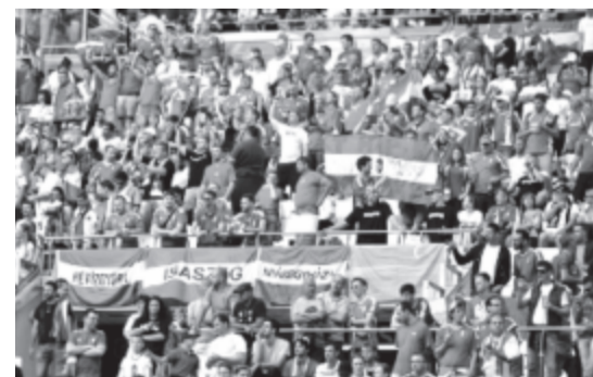
Kulturált viselkedésre kéri a csapat a szurkolókat, nehogy megint zárt kapus mérkőzésre kötelezzék őket.

egy a vendégszektorba, ahova kizárólag magyar, a hazaiba pedig kizárólag szlovák állampolgárokat engednek be a rendezők. Arra a felvetésre, hogy Marco Rossi szövetségi kapitány volt a Dunaszerdahelyi AC edzője, így pontosan tisztában van vele, mit jelent a magyaroknak egy Szlovákia elleni meccs, úgy reagált: az olasz szakvezető csak arra koncentrált, hogy mentálisan és taktikailag is a lehető legjobban felkészítse a csapatot a mai meccsre.