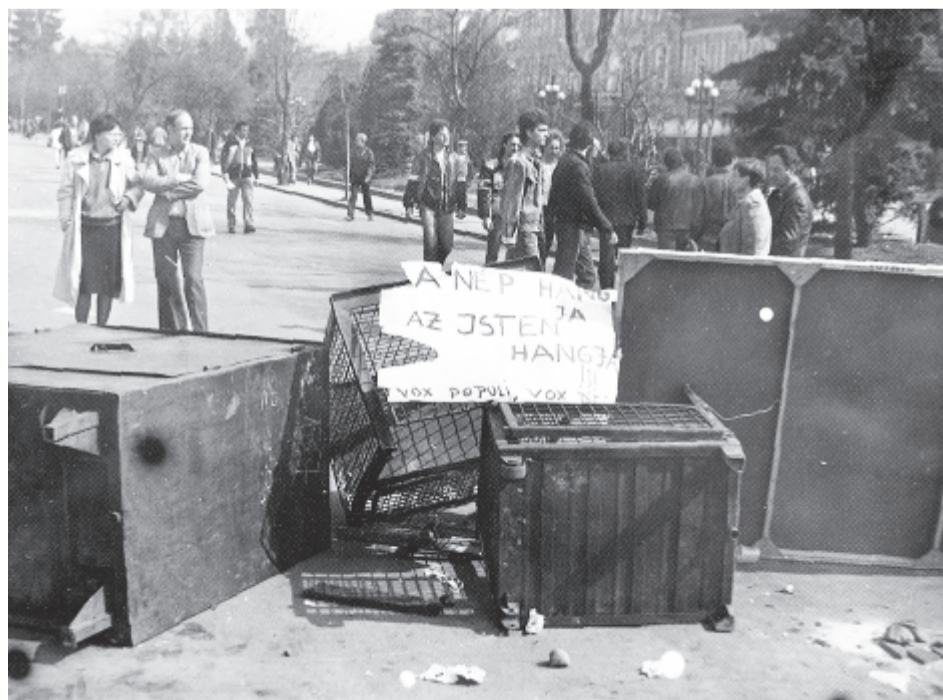
Barikád a főtéren

Nem szabad feledni. De emlékezni is úgy kell, hogy a múlt eseményeiből okulva előretekintünk. S remélem, ebben egyetértünk mi, akik maradtunk: a normális magyarok és a normális románok egyaránt.