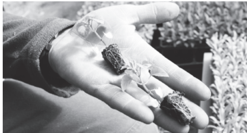
Ebből lesz a szálvia

A fóliasátorban szépen sorakoznak a begónia-, a szekfü-, a szálvia-, a verbéna-, a napranyiló-, az impatiens (pistike-) palántákkal frissen beültetett cserepek. A ládában tátingó-, rózsá-, különféle begónia- és levendulátövek