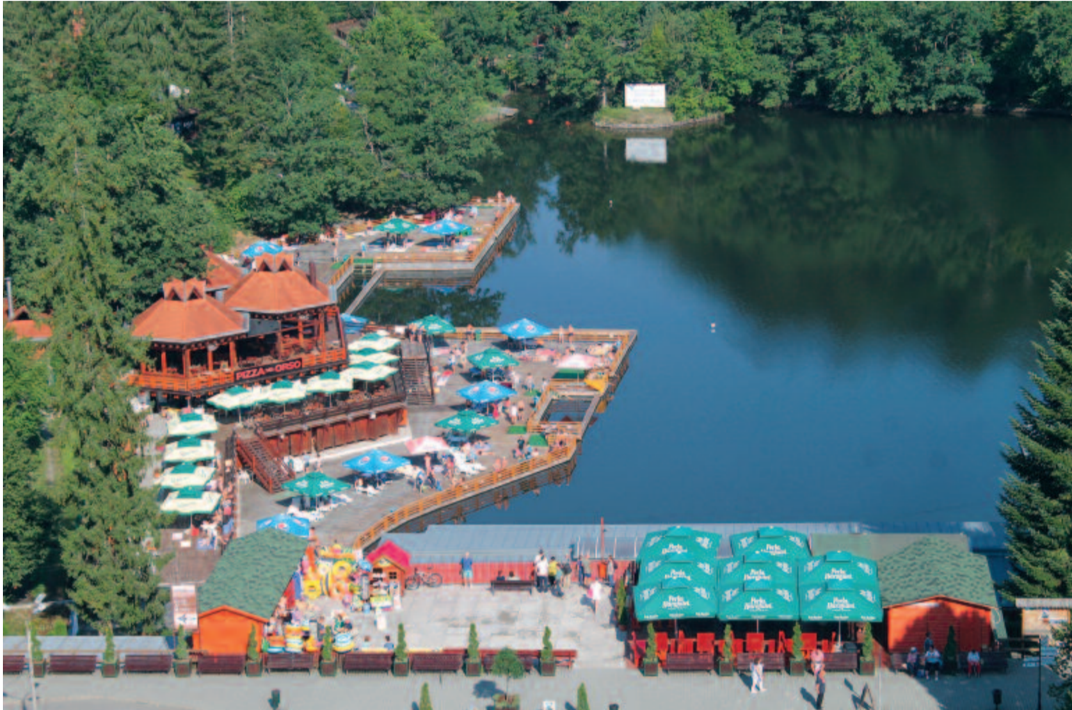
A szováti Medve-tó strandja