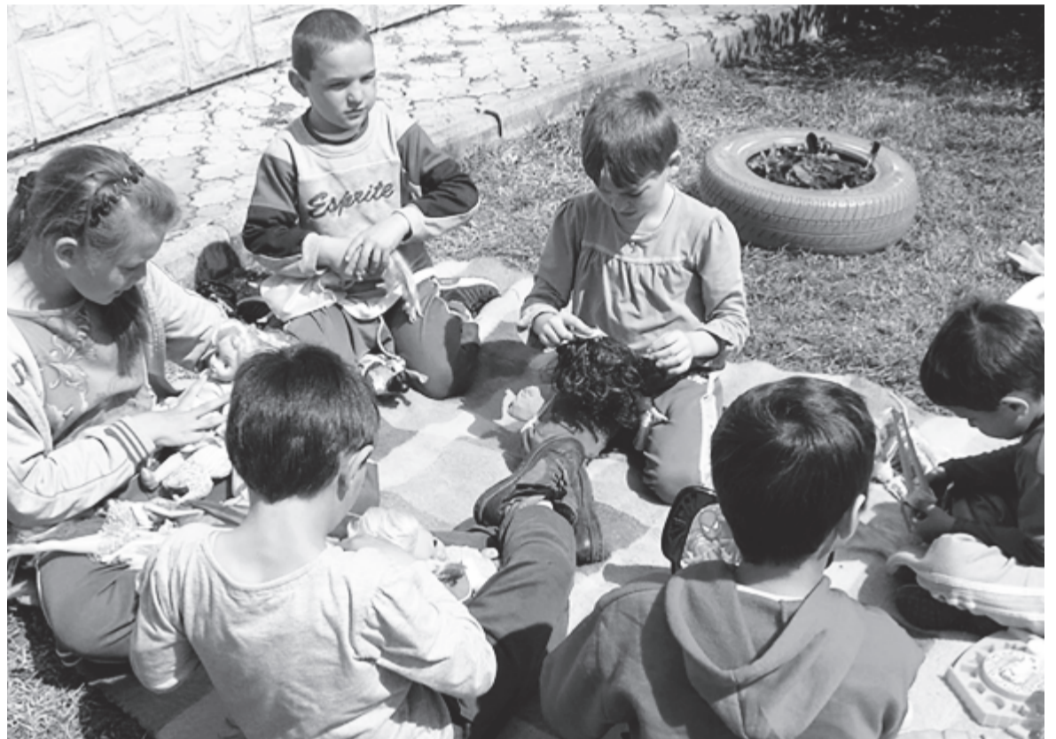
A magyarfülpösi Szivárvány Ház is támogatókra vár

kíteni. Az Azopan Fotóarchívum egy olyan online archívum, amely azt tűzte ki célul, hogy megmentse, megőrizze és a közönség számára is elérhetővé tegye Románia analóg fotós örökségét. Hogy az ezt felvállalók önkéntes munkájukat minél hatékonyabban végezhessék, szükségük volna olyan eszközökre, amelyekkel digitalizálják és tárolni tudják a képeket, ugyanakkor szeretnének online tárolási szolgáltatásokat vásárolni. Erre is lehet