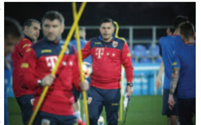
Cosmin Contra (k) hétfőn vezényelte az első edzést a román csapatnak az első két Eb-selejtező előtt.

Az állás: felsőház: 1. Kolozsvári CFR 33 pont, 2. CSU Craiova 29, 3. FCSB 28, 4. Viitorul 22, 5. Astra 21, 6. Sepsis OSK 19; alsóház: 1. Medgyes 22, 2. Jászvásár 20, 3. Dinamo 19, 4. Botoşani 19, 5. Voluntari 17, 6. Nagyszeben 17, 7. Călăraşi 12, 8. Chiajna 11.