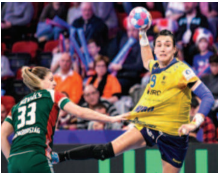
A román válogatottban, a magyar csapat elleni mérkőzésen.

A román kézilabda-válogatott és a Bukaresti CSM balátlövője tavaly pályafutása során másodszor lett a Bajnokok Ligájának gólkirálya 110 találattal, ugyanakkor sorozatban negyedszerre választották a BL legjobb balátlövőjévé. 2018-ban Neagu a CSM-vel bronzérmes lett a Bajnokok Ligájában, ugyanakkor meg-