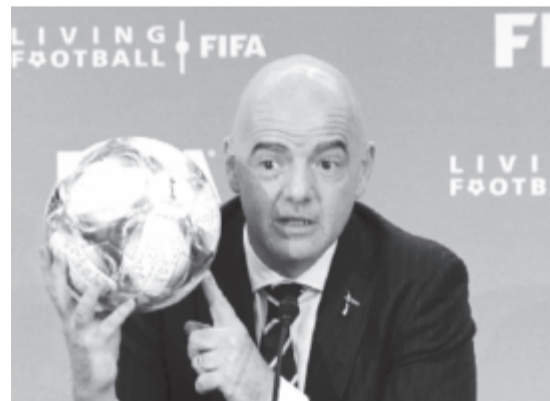
A Nemzetközi Labdarúgó-szövetség elnöke, Gianni Infantino tavaly október végén beszélt először annak lehetőségéről, hogy a létszámbővítés már a katari tornán megvalósulhat.

A FIFA tanácsa pénteken Miamiában ki mondta, hogy Katarnak szüksége van legalább egy környékbeli országra, ahol