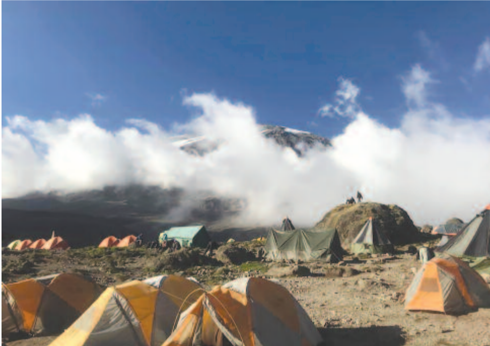
Táborozás a felhők között

A világ egyik legnagyobb vulkánja körül létesült park összterülete 753 négyzetkilométer, és 1910-től vad-, 1921-től erdőrezervátum. Innen indul a csúcsra szervezett túra is, érintve a különböző vegetációs övezeteket (az 1830 méteren levő Mandara menedékházat, 3718 méteren a Horombo házat, majd a 4630 méteren elhelyezkedő Kibo házat). A hegyen mintegy 2500 növényfaj él, számos szigorúan védett állatfaj található (egyebek mellett: kafferbivaly, afrikai elefánt, királykolobusz, leopárd, keskenyszájú orrszarvú). Számunkra azért is jelentős ez a hegy, mert a sáróberki gróf Teleki Sámuel volt az, aki európaiként elsőként érte el a Kilimandzsáró 5310 méter magasán húzódó hóvonalát, az első felfedező volt, aki a Kenya-hegyre lépett. Mint ismeretes, ő fedezte fel 1888. március 5-én az először Jáde-tengerként említett tavat, amelyet az Osztrák–Magyar Monarchia trónörököséről később Rudolf-tónak ne-