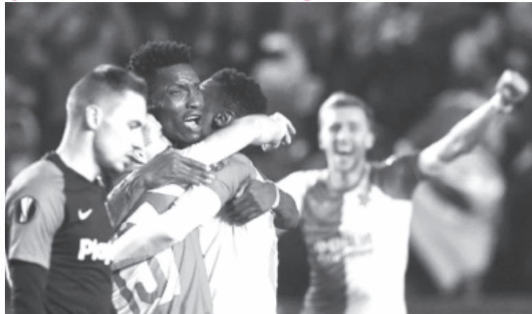
Traorét ölelgetik a cseh csapat játékosai: a ráadás hajrájában elért találatát továbbjutást ért.

Gólszerzők: Szulejmanov (85.), illetve Guedes (93.).