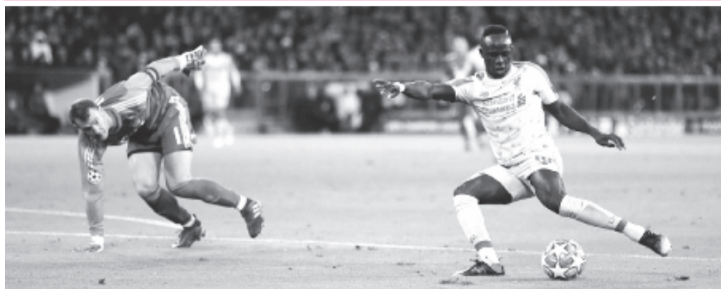
Münchenben a Liverpool Sadio Mané villanásával szerzett vezetést.

Gólszerzők: Messi (18., 78., – az első 11-esből), Coutinho (31.), Piqué (81.), O. Dembélé (86.), illetve Tousart (58.).