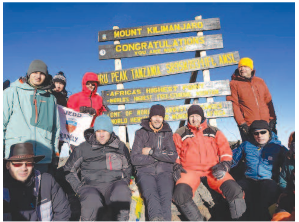
Csúcson az expedíció tagjai

Talán ez is ösztönözte a csapatot, amikor tizenötén hozzáálltak az előkészületekhez. A Székelyek a magasban elnevezésű expedíció-sorozatát szervező Tudit Zsombor sepi-szentgyörgyi hegymászó szívesen adta a védjegyet az expedíciónak. Az előkészületek nemcsak szervezői teendőkkel jártak. A repülőjegy-foglaláson kívül egy erre szakosodott céghez be kellett fizetni az utazási költséget,