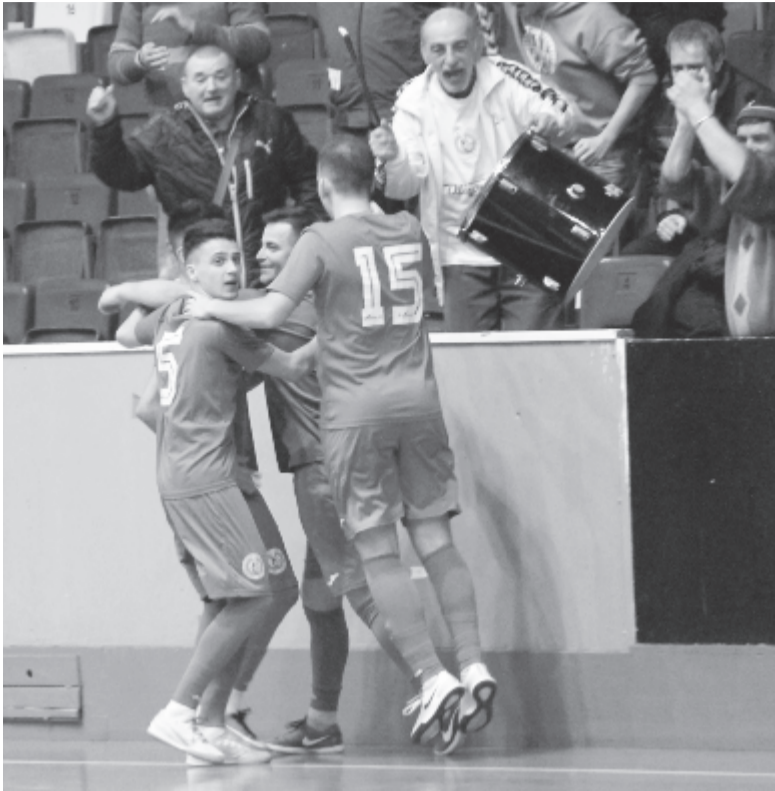
Másfél perccel a vége előtt egyenlítő gólt ünnepezhettek a marosvásárhelyi teremfocisták a Románia-kupa elődöntőjében.

Egyáltalán nem volt akkora különbség a két alakulat között, mint amit a papírforma mutatott. Tény, hogy a galaciak többet birtokolták a labdát, és Cătinean kapuja is többet forgott veszélyben, így a győzelmük akár megérdemeltnek is mondható, Lucian Nicușan tanítványai azonban sok mozgással zárták a szögeket, és amikor csak lehetőség nyílt rá, veszélyeztették Wellington kapuját. Már az ellenfél térfelének felső felén kitámadták, így Galacnak minden labdafelhozatallal meg kellett küzdenie. Amikor pedig a Duna-partiak túljutottak a védőkön, akkor Cătinean avatkozott közbe, egyetlen kivétellel: a 13. percben Lascu lövését nem tudta hátrítani.