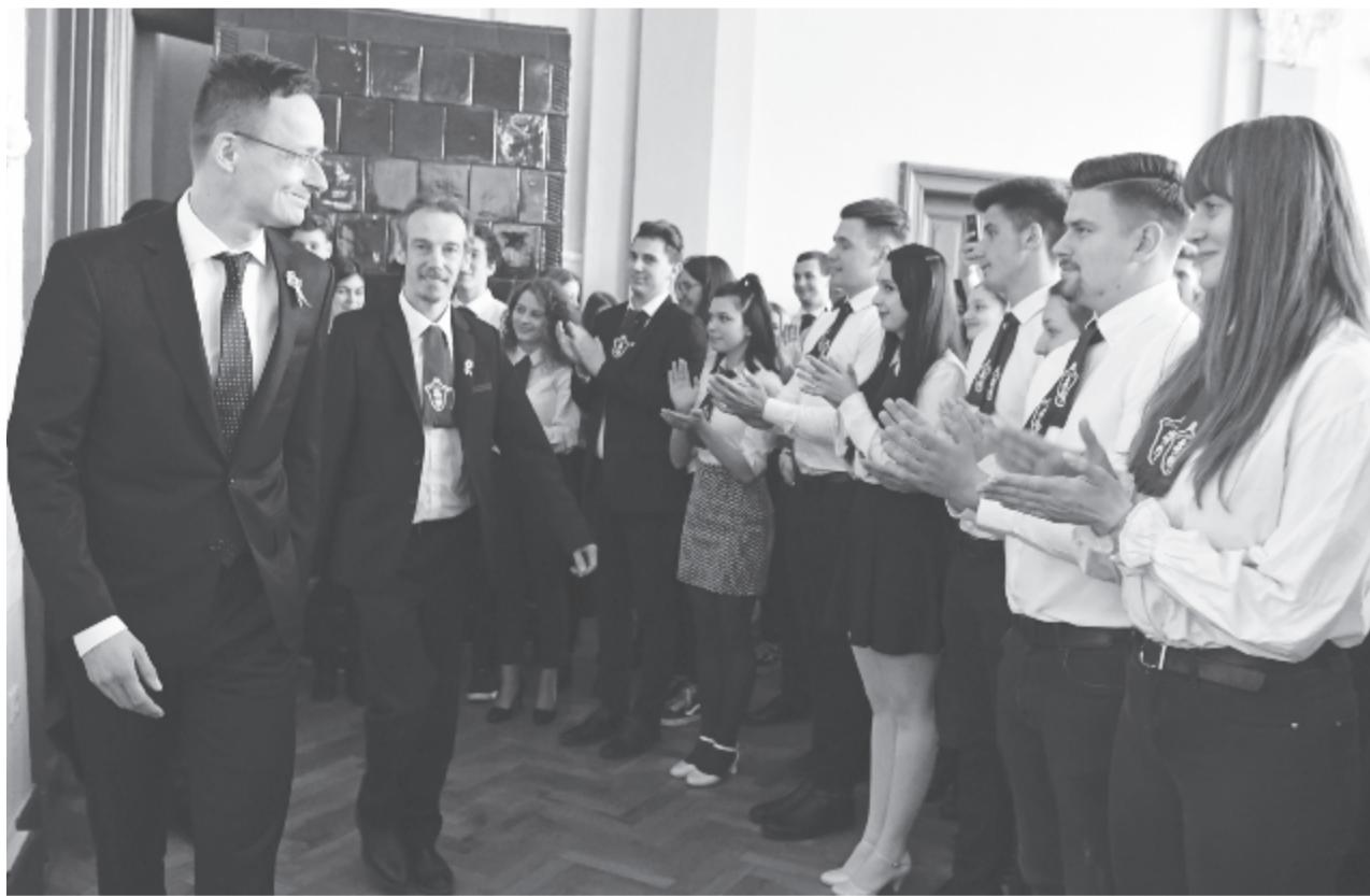
Szijjártó Péter külügyminiszter (b) és Tamási Zsolt József, a marosvásárhelyi római katolikus líceum igazgatója az intézményben tartott díjátadó ünnepségen

A marosvásárhelyi római katolikus líceum diákjai, tanárai és szülői közössége a bizonyíték arra, hogy a magyarságnak nemzeti identitásához, hitéhez ragaszkodó közösségként van jövője a Kárpát-medencében – hangsúlyozta Szijjártó Péter külügyminiszter szütörtökön, amikor elsőként átvette a tavaly újraalapított iskola által adományozott Rákóczi-díjat.