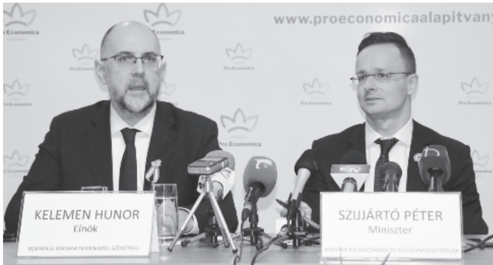
Kelemen Hunor és Szijjártó Péter