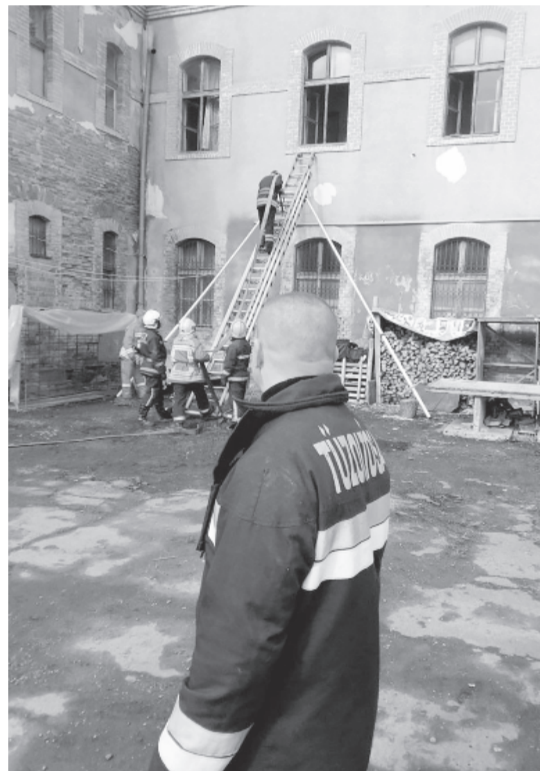
Különböző tűzoltási helyzeteket kellett megoldaniuk a jelölteknek.

ban tudnának együttműködni a Kárpát-medencei önkéntes tűzoltók hálózatával, és könnyebben hozzájuthatnának használható nyugati eszközökhöz, felszerelésekhez – tudtuk meg Kacsó Istvántól.