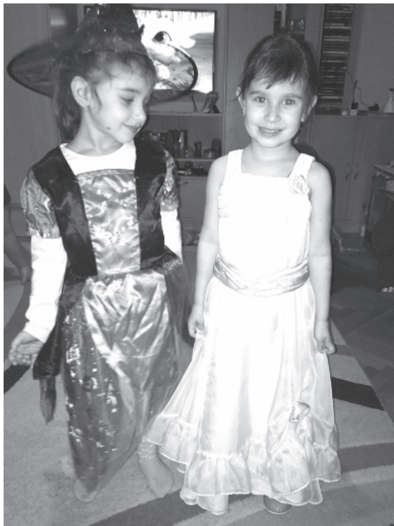
Boszorka és Tündérke