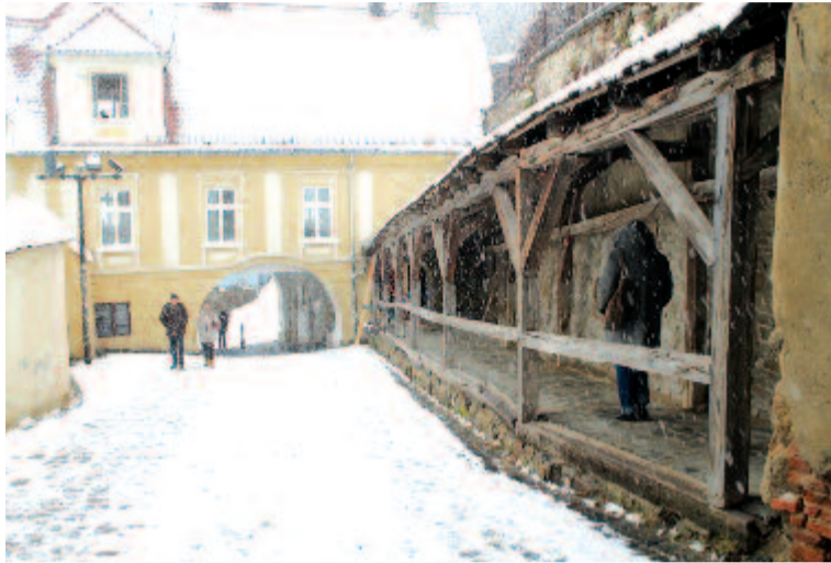
Idős hölgyek feljárója a városban

– Nem szokták az ilyesmit megindokolni. Ugyanilyen helyzetben van az óratorny melletti félfedett feljárt, az úgynevezett idős hölgyek feljárója, erre is készen volt az előtanulmány, a dokumentációt tavaly áprilisban adtuk le a minisztériumhoz, és most, január közepén kaptuk meg az engedélyt, hogy hozzákezdhetünk a felújításhoz. Tehát gyakorlatilag 9 hónap