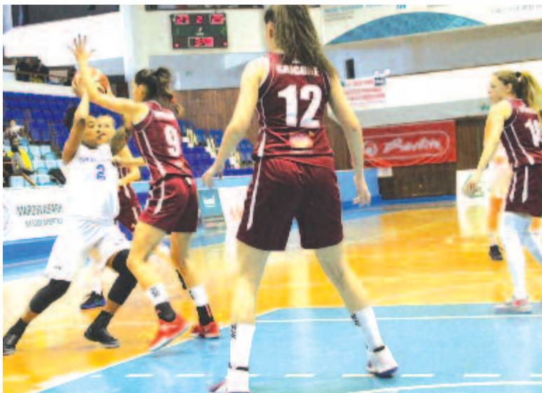
Szivósan kapaszkodott a Rapid, hiába erőlködtek a marosvásárhelyi játékosok, a végén a bukarestiek örülhettek.

szer is vezetett a Rapid, mégsem jutott dűlőre a meccs. Aztán a következő öt percben a CSM szerzett 3 pontos előnyt, de a hajrá a bukares-