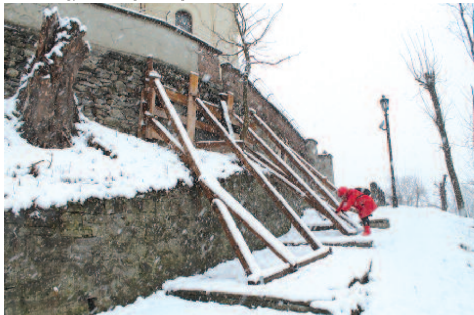
A kitémasztott várfal (A fotók múlt kedden szakadó hóesésben készültek)

A várfalnál adott pillanatban kérték, hogy egészítsük ki a dokumentumokat, sőt bakteriológiai vizsgálatot is kértek, hogy miért, nem tudom, azt is elkészítették, elküldtük Bukarestbe, és azóta is várjuk a választ.