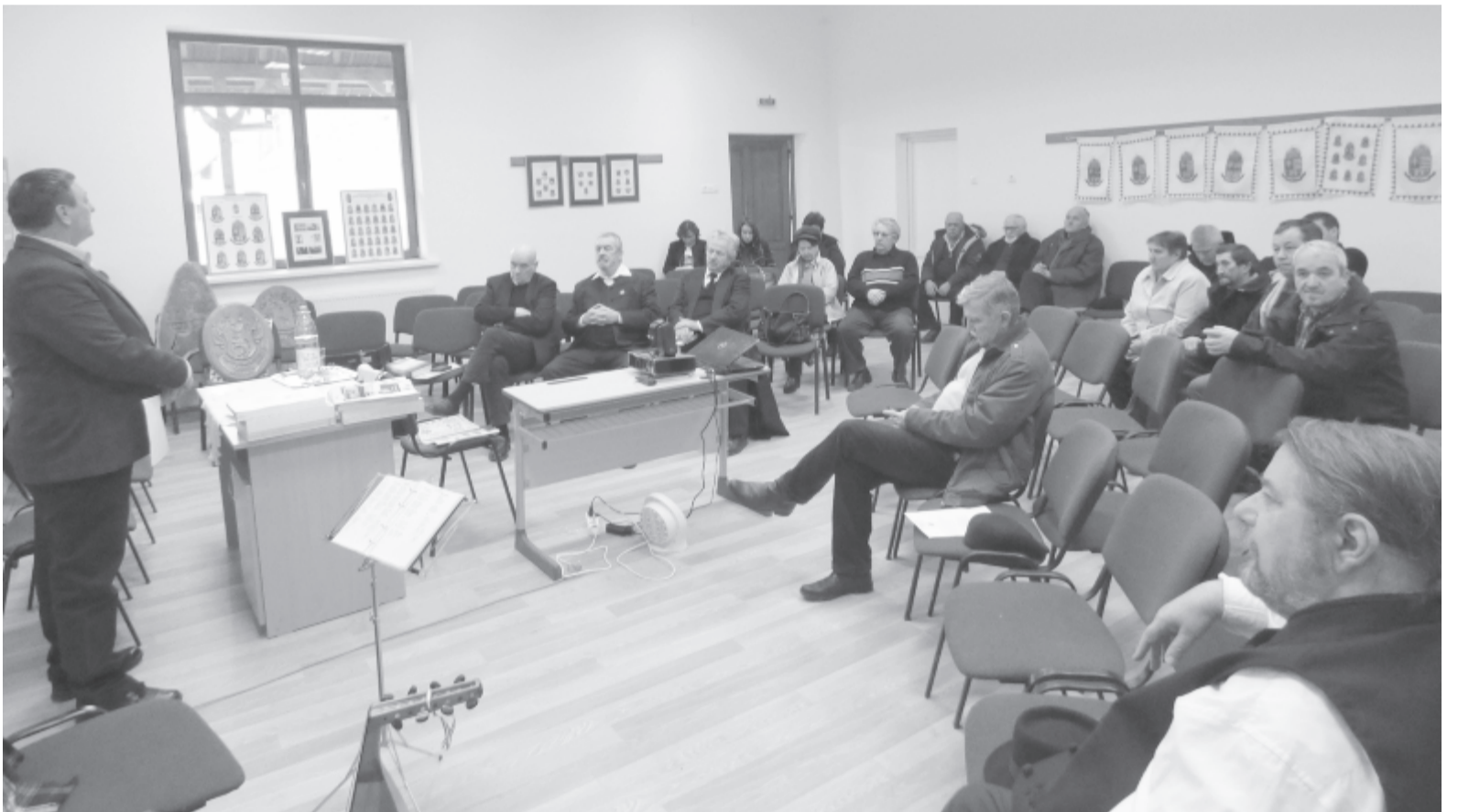
Érdekes előadások hangzottak el a három nap alatt