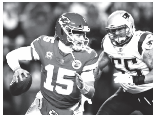
Patrick Mahomet (15) az amerikaifutball-liga alapszakasz legértékesebb játékosának (MVP) választották.

* Patrick Mahomet, a Kansas City Chiefs másodéves irányítóját választották az alapszakasz legértékesebb játékosának (MVP) a profi amerikaifutball-ligában (NFL). A 23 éves irányító az MVP-díj mellett a liga legjobb támadójátékosának járó elismerést is bezsebelte a szombat esti gálán. A NFL nagydöntőjét, a Super Bowl-t a mára virradó éjszakán rendezték a New England Patriots és a Los Angeles Rams között.