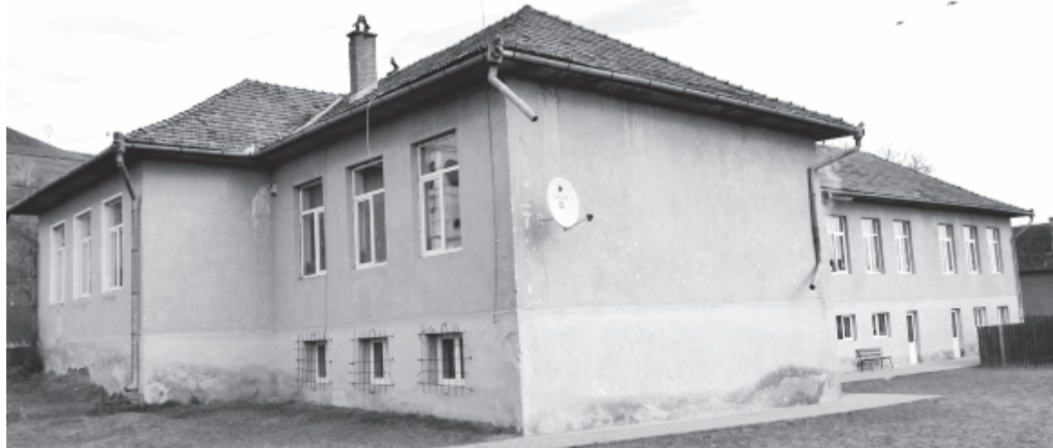
Teljesen megújul és ki is bővül az 1963-ban épült iskola