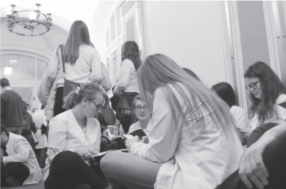
Tüntető diákok az orvosi egyetemen

Újabb megbeszélés az ígéretek szerint a második félév kezdetén lesz.