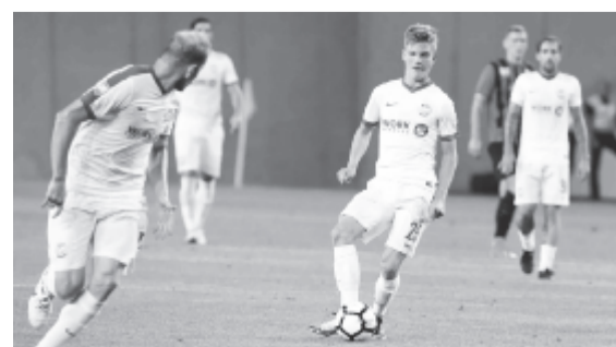
A Serie A-ban szereplő klub egymillió eurót fizetett a magyar játékosért (26).