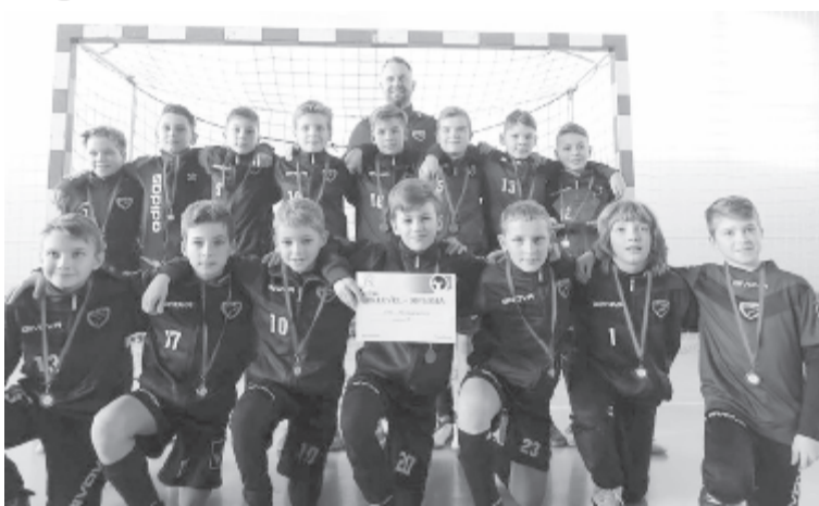
A 2007-es korosztályban a Bordó csapatával győztes Marosvásárhelyi MSE a klub közösségi oldalán ismertett felvételen

A4-B4: MSE – Nyárádszereda 2-0 A3-B3: Marosvásárhelyi Vulturii – Marosszentgyörgyi Kinder/Fehér csapat 0-1 A2-B2: Székelyudvarhelyi FC – Kolozsvári Sporting 0-3