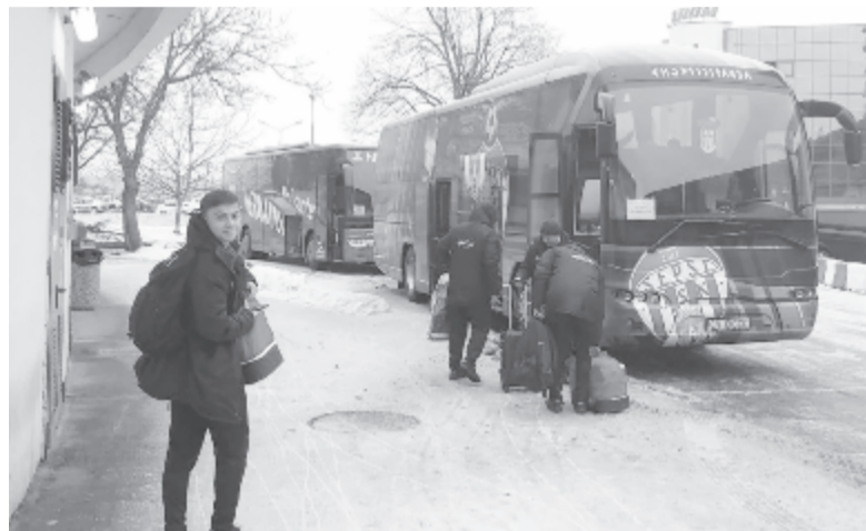
Két győzelem, két vereség és egy 1-0-s állásnál félbeszakadt találkozó – ez a labdarúgó 1. ligában szereplő Sepsi OSK törökországi alapozóján rendezett felkészülési mérkőzések mérlege.