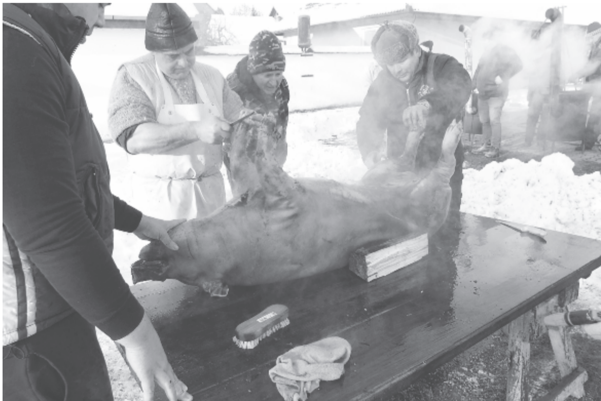
Idén székely és német hagyományok szerint dolgozták fel a kakasdi disznókat

A napokban Jobbágytelkéről utazik küldöttség az anyaországi Sajóvamosra, ahol a következő hét végén a Vámos-Toros elnevezésű gasztronómiai fesztivál zajlik, és ahol a felső-nyáradmentiek is feldolgoznak egy sertést saját hagyományaik és szájízük szerint: készül torokpecsenye puliszkával, tepertő, töltött káposzta, kolbász és májas, amit a résztvevők meg is vásárolhatnak. A rendezvényen fellép a jobbágytelki hagyományörző néptáncosok. A sajóvamosi szervezők rekordot döntenének a fesztiválon, egy 2019 méter hosszú kolbászt szeretnének készíteni.