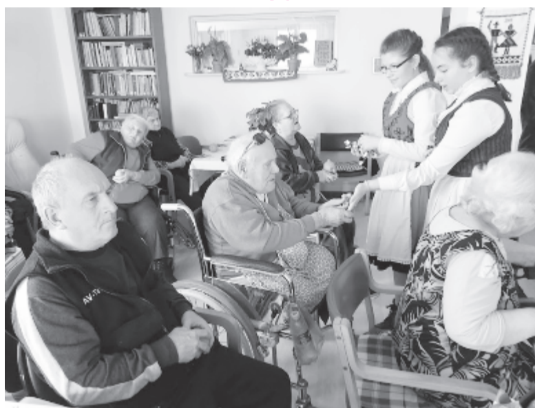
A szerény ajándék is része volt az áldásos programnak

Egy, a szegedi Európai Magyar Ifjúságért Alapítvány által működtetett, immár tízéves versenyprogramra jelentkezett november végén az Ákosfalvi Általános Iskola. A SzékelyKapuk-ZöldKapuk címet viselő program aktuális pedagógiai üzenetet hordoz, célja az innovatív vállalkozói szellemre nevelés. Az 5-8. osztályos diákoknak szóló vetélkedő célja a résztvevő tanulók és pedagógusok életmódszerű együttműködésének elősegítése. Az ákosfalviak egy szatmári iskola meghívására léptek be az ököcivilizációs játékba, mentoruk a Kincskeresők csoport volt, amely évek óta részt vesz a vetélke-