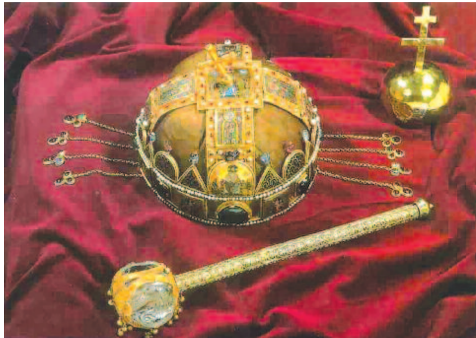
Az Országház kupolacsarnokában őrzött koronázási ékszerek

A második világháború végén a nyilas nemzetvezető Szálasi Ferenc is a Szent Koronára tette le az esküt. A koronázási ereklyéket az előrenyomuló szovjet csapatok elől 1944. november elején Veszprémben, egy múzeumi óvóhelyre vitték, december elejétől Kőszegen őrizték, majd Velemben egy bunkerben helyezték el. A koronaörök 1945. március 27-én az ausztriai Mariazellbe, majd a Salzburg melletti Mattsee községbe menekítették, ahol április 26-án éjjel egy hordóban