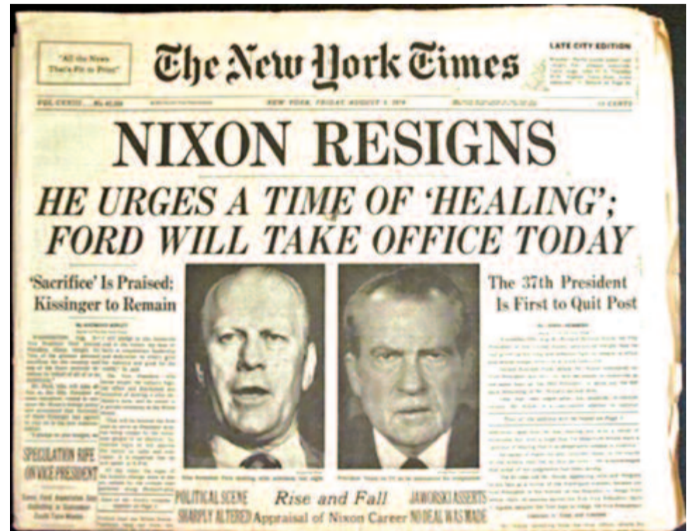
A The New York Times címlapja az elnök lemondásáról