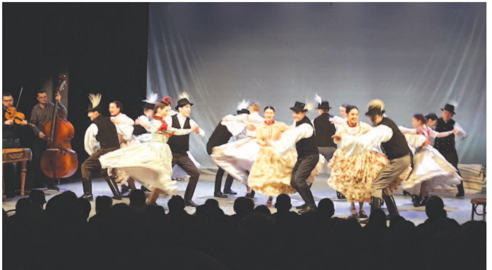
Az együttes idei fellépéseinek száma eléri az ezret

Ha bejutott volna a Páva idei döntőjébe, az ott szerzett összeget a Bekecs a Bőjte Csaba atya által irányított Dévai Szent Ferenc Alapítványnak ajánlotta volna fel. Mivel ez nem valósulhatott meg, az idei évzáró gála alkalmával a közönség és az egyik támogató által tett adományok felhasználásával az együttes tavasszal egy előadást visz az alapítvány gondozásában élő gyermekeknek.