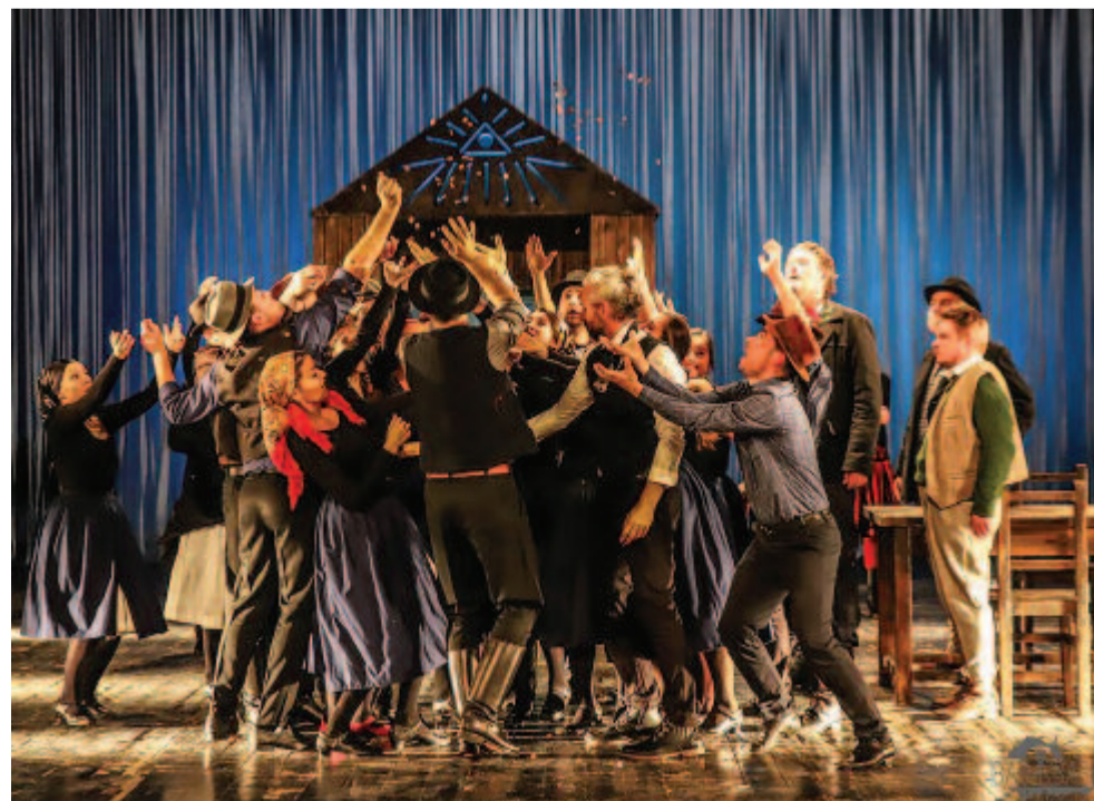
A Tündöklő Jeromos a marosvásárhelyi színpadon