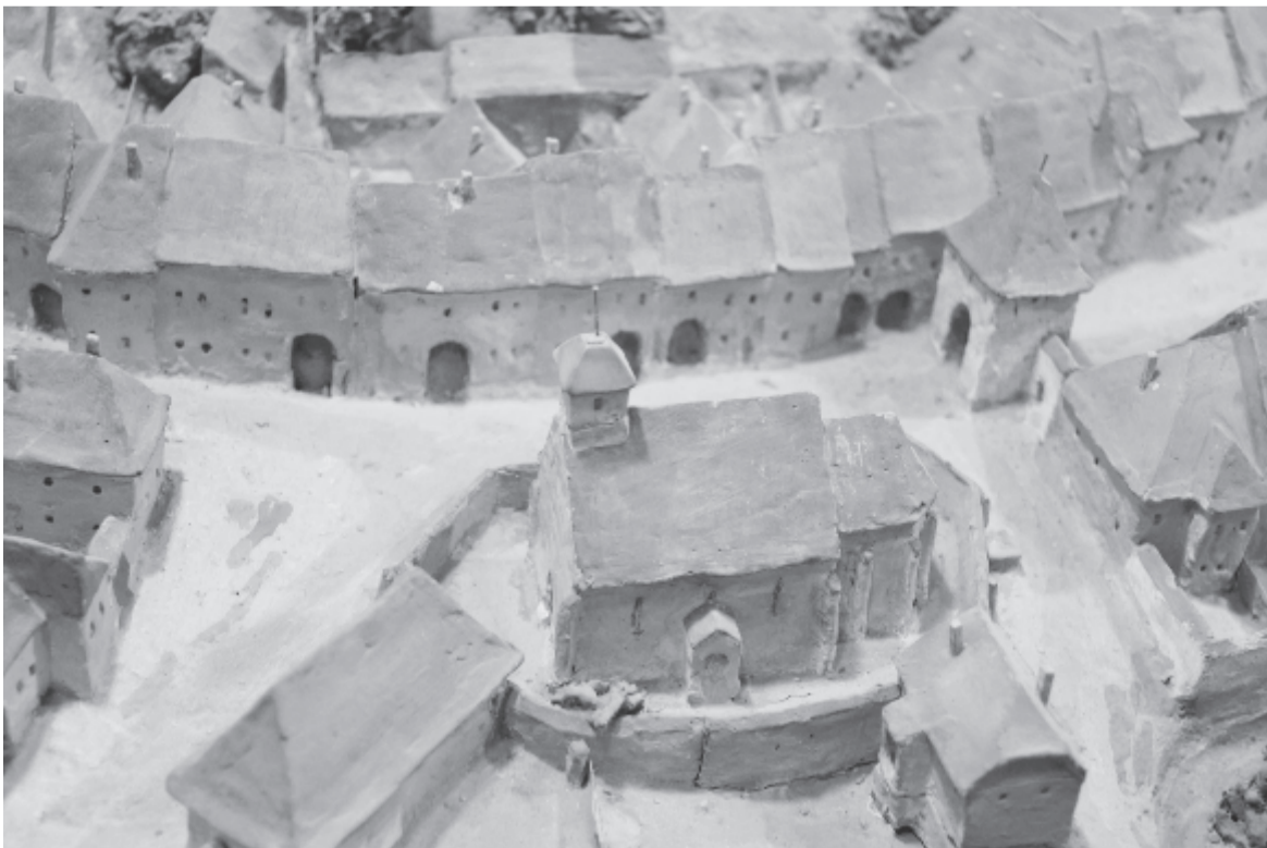
Az egykori Szent Antal-kórház

A Szent Antal tüze betegséget olyan vízzel „gyógyították”, amelyben a kovács a tüzes vasat hűtötte, mondván, hogy „tűznek tűz a legjobb orvossága”. Gyógyfüvek főzetével borogatták, mosogatták, liszttel szórták be, füstölték a sebet.