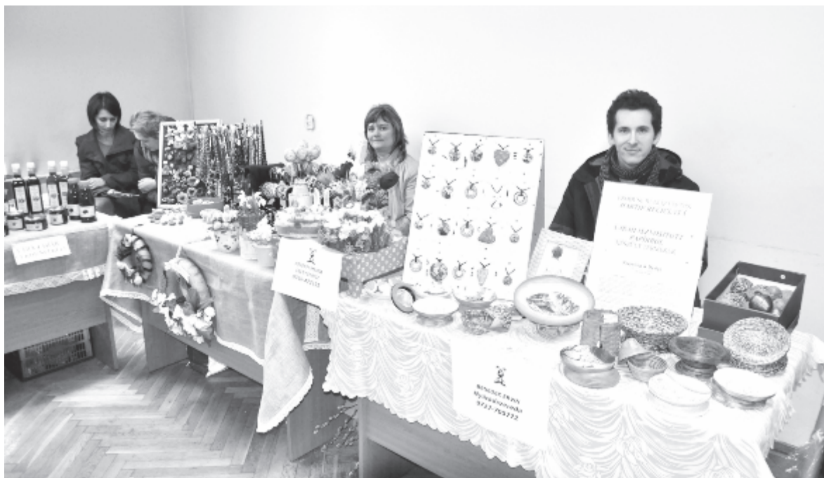
Helyi termékek vására az RMGE Maros székházában

az általuk a gazdáinknak nyújtott operatív segítséget. Együttműködünk a MIERT-tel az agrárakadémiai szervezésében, résztvevők biztosításával, tagjaink mozgósításával. Tagja vagyunk a megyei mezőgazdasági kerekasztalnak mint civil szervezet. Nemrég négy tagunk segített az APIA szakembereinek, hogy a kifizetések határidejét be tudják tartani, és közösen ellenőrizték a támogatásra benyújtott dossziékat. Egyedüli szervezet vagyunk, amely tagja a LAPAR-nak (mezőgazdasági termelők országos ligája), az ország legnagyobb szakmai szervezetének. Nemrég meghívást kaptunk a Fekete-tenger övezetében levő hét ország konferenciájára, ahol közös állásfoglalást hoztak a 2020-as európai uniós mezőgazdasági támogatási rendszeréről. Ezen a konferencián is véleményt mondhattunk. Kapcsolatot teremtettünk a magyarországi Nemzeti Agrárkamara és a LAPAR képviselői között. Ahol a szakma része az agrárdiplomáciának, annak érdekében, hogy a gazdák érdekét szolgáló törvénymódosítás vagy valamilyen finanszírozási rendszer beinduljon, olyan értelemben mi is részt veszünk a politikában, de csak szigorúan szakmailag. Mi tevékenységünkkel szolgáljuk a gazdátársadalmat és azon túl az erdélyi magyar és a hazai társadalmat.