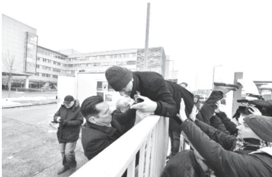
Ellenzéki képviselők az önkéntes túlmunkaidő bővítéséről szóló törvény ellen demonstrálnak az MTVA székháza előtt, és élő adásban szeretnék elmondani nyilatkozatukat.

Mindezeket figyelembe véve, az ellenzéknek semmi esélye nincs a csütörtöki kormánybuktatásra. Persze jogában áll időnként bizalmatlansági indítványokat benyújtani. Csak nem önös érdekből kellene, nem a cirkusz kedvéért, hanem úgy, hogy utána azonnal egy jobb kormányprogramot, megvalósítható alternatívát mutassanak fel, és ültessenek életbe. A lakosság érdekében.