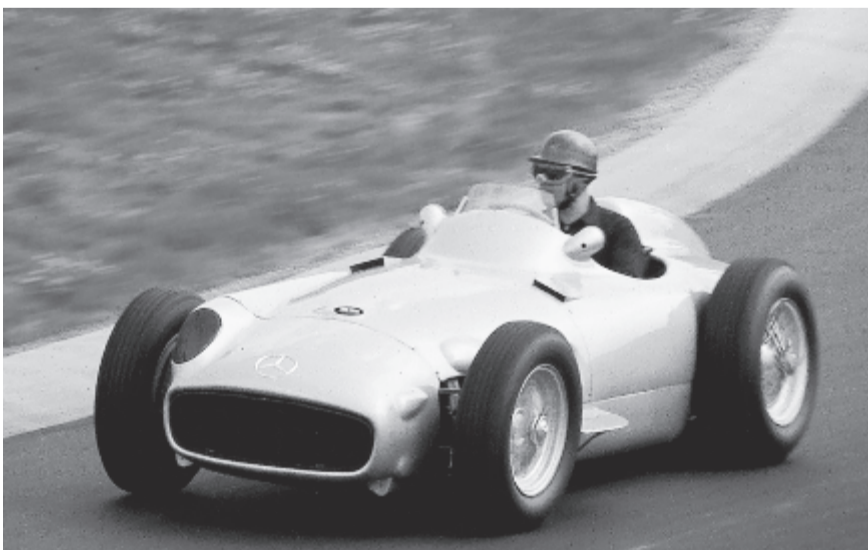
Az 1950-es évek kétszeres világbajnok Mercedesese