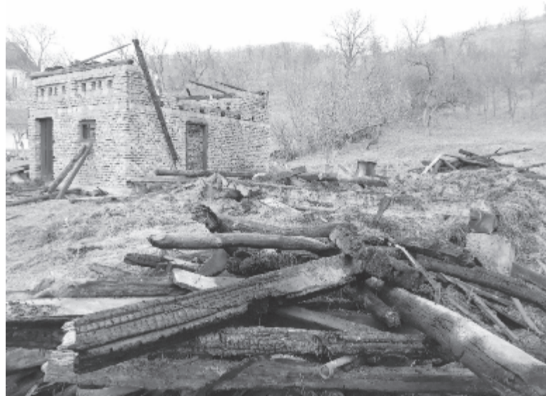
A szomszédos gazdasági épületből is csak a falak maradtak meg

A gyülekezeti otthonnál keletkezett tűz nyomán nem sok jel maradt, amiből az okra lehetne következ-