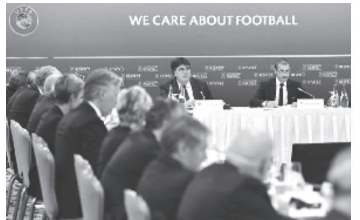
Alexander Ceferin elnök (j1) szerint az új sorozat több meccset jelent több csapat számára.

Az UEFA a napokban kihirdette, hogy 2021-től a Bajnokok