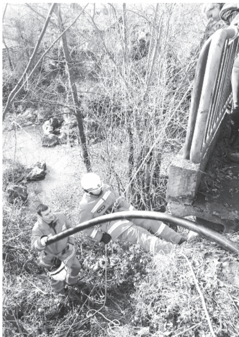
A mélyből való kiemeléskor egy kötélről függ a mentő és az áldozat élete

A Békés Megyei Tűzoltó Szövetség öt éve jár Erdélybe az önkéntes tűzoltókat képezni, és úgy érzik, lerakták a beavatkozás és a tűzből