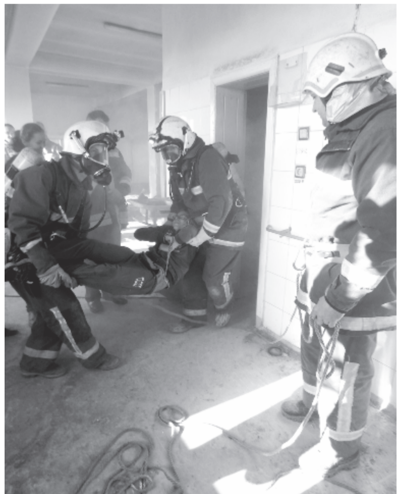
Néhány perccel múlt az áldozat élete – ezért fontos mindent helyesen tenni egy füstbe borult épületből való mentés során

ság alig egy éve működik. Tevékenységük megkezdése előtt egy négy hónapos képzést szervezett számukra a megyei tűzoltóság, de az többnyire a tűz eloltására vonatkozott, nem mentési akciókra. Így egyes dolgokról van fogalmuk, de a képzések többnyire elméletiek voltak, ezért számukra nagyon hasznosak az ilyen alkalmak, amikor a gyakorlatban is megtapasztalják a tennivalókat, és számos fontos információt szerezhetnek – vallotta belapunknak Iszlai Győző Levente parancsnok.