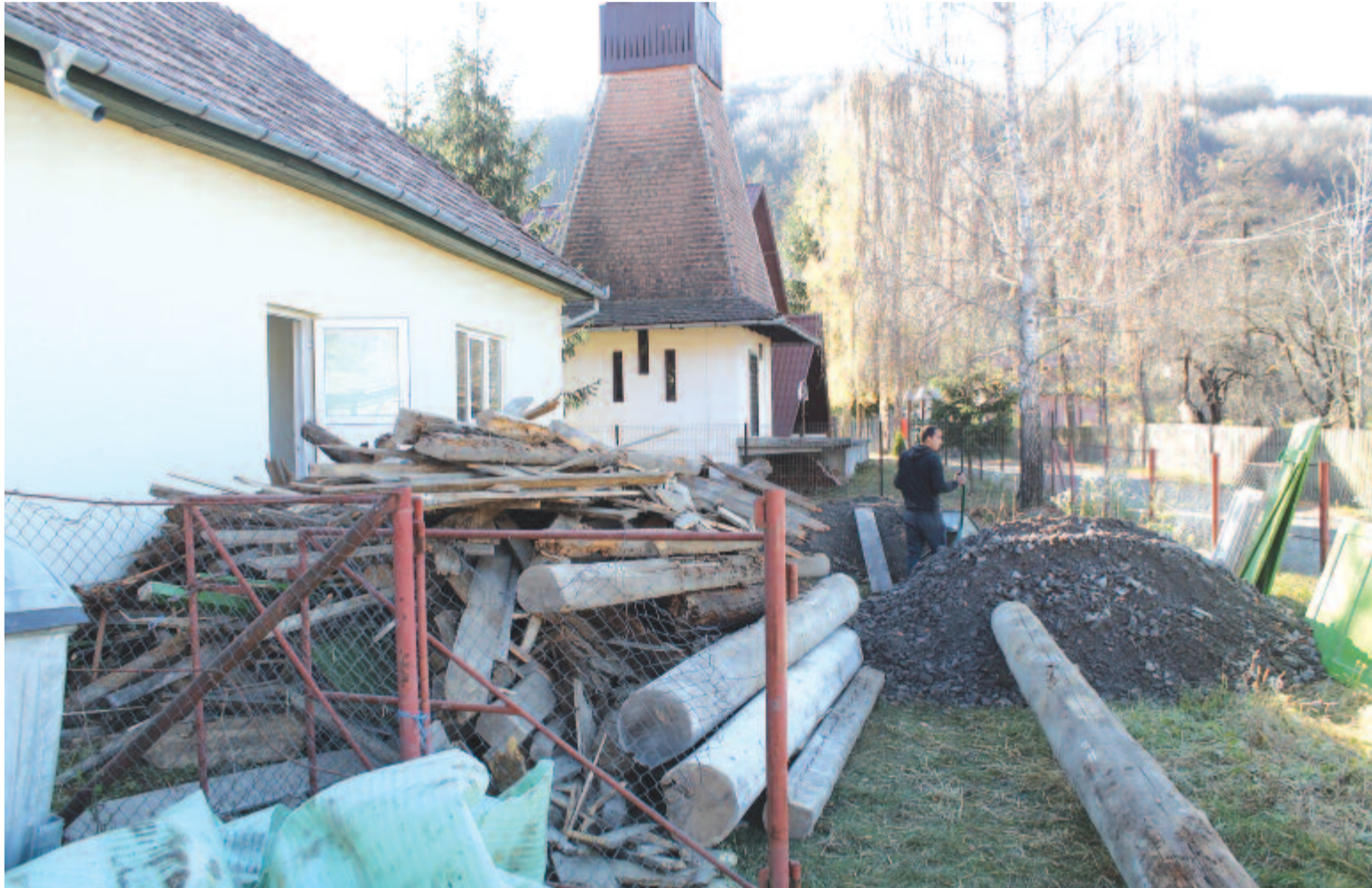
Szovátai vendégház a 6. oldalon