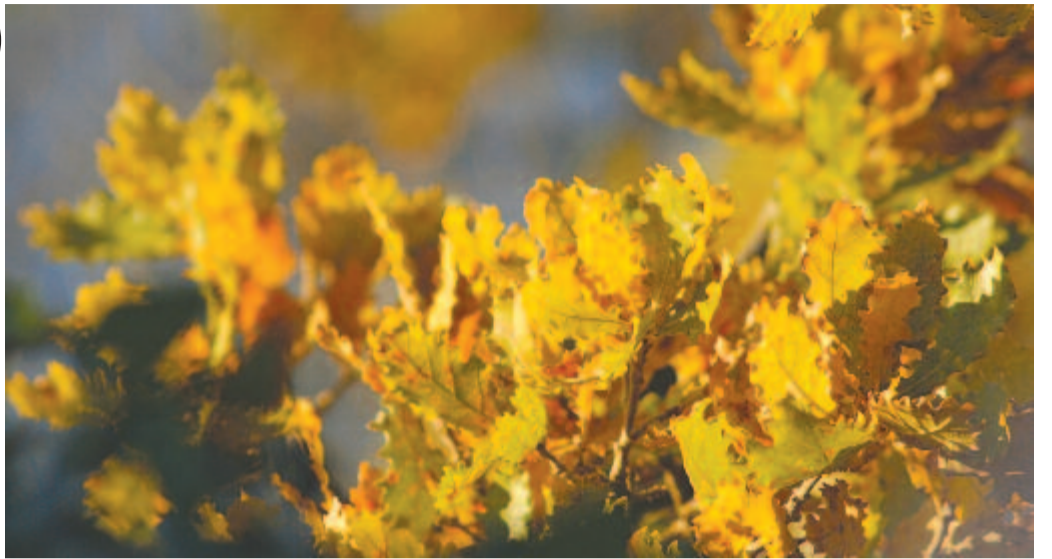
Gondolkoznak ők is a mulandóságról

A kertemben járok, és szomorú vagyok, szomorú, mint a fák, s hervadt virágok. Az egész föld olyan árva, oly elhagyott, mintha meguntta vón Isten e világot (...)