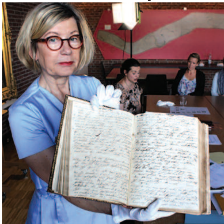
Rhédey Claudia német nyelvű naplóját Stuttgartban őrzik

A Székelyföld Napok keretében zajlott hétvégi erdőszentgyörgyi konferencián a szakemberek beszámoltak a Rhédey családot és kastélyt vizsgáló kutatásaik újabb eredményeiről. Egy lépéssel közelebb kerülhetünk a kastélyba megálmódott, a Rhédeyeket és korukat bemutató tárlat megvalósításához.