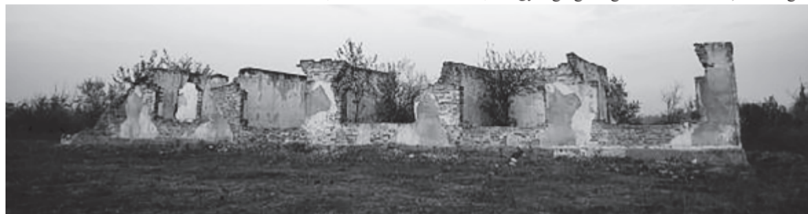
Romok az egykori munkatáborból

Aki még tovább merészkedik, és még jobban eltávolodik a szállótól, az elérhet az egykori munkatábor túlsó felében létrehozott állatfarm maradványaihoz. Ennek a mai neve, amint tábla is hirdeti az irányt: Granja. A táblán, mint mindegyiken, a háttérben egy sakál figurája és a terület neve: Ultima Frontiera. A termelőszövetkezet tehenészete helyén itatásra szolgáló robusztus betonvályú, számos épület helyén még feltehető szellős ajtók és ablakok, cseréppel fedett istállók, tehéncsontok. Nos, a termelőszövetkezetek virágzásának a korszakát is betemette már a történelem. Pedig olyanok is voltak a munkatábor politikai elítéltejei között, akik kezdettől fogva nem támogatták a magántulajdonú gazdálkodás helyére kényszerített közösségi szövetkezeti formát. A munkatábor is, az állatfarm is a pusztulás martalékává vált immár!