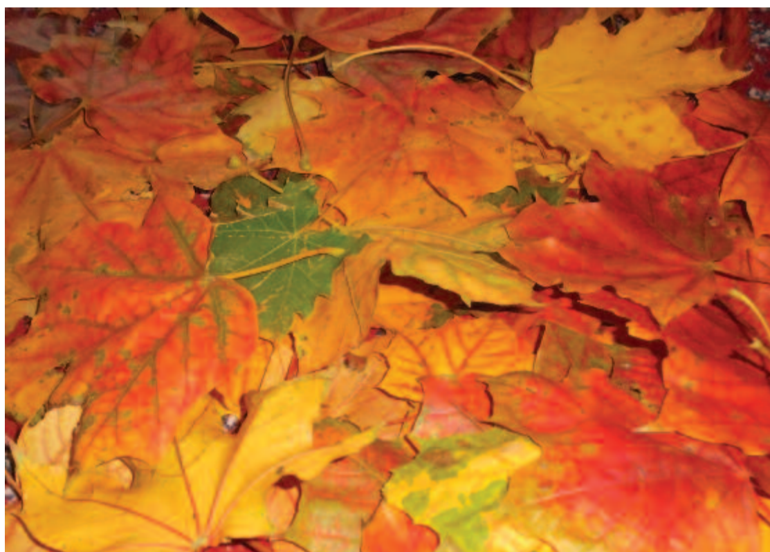
Falevél hull, hulldogál az ágról