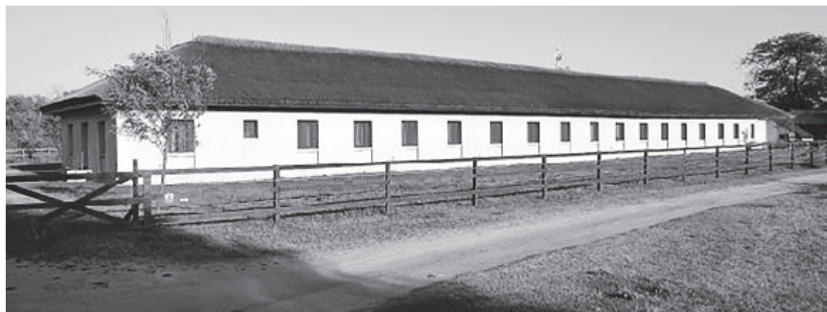
A lágerparancsnoki épület ma négycsillagos szálló

Amúgy a munkatábor negyven évvel ezelőtti megszűnését követően számos téglapépület, barakk lebontódott, és már legfeljebb sejtető halomok, némi törmelék, esetleg látható módon betonlépcsődarabok maradtak meg. De töbttucatnyi épületmaradvány is fellelhető a környéken. Ezeket is három csoportba lehet osztani, az eligazító táblák logikája szerint. Az egykori láger mintegy hatvanhektáros területére belépve fellelhető az egykori vízállomás néhány épületének a maradványa, aminek az azonosításához mások magyarázatára van szükség. Száz méterrel arrébb az út elágazik. Balra épültek ki a börtönalkalmazottak és családtagjaik elszállásolására hivatott