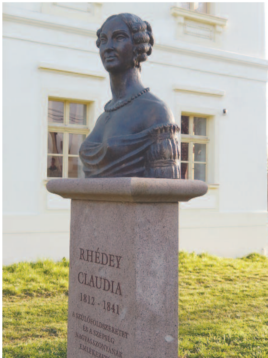
A Rhédey család és Claudia kultuszát növeli majd a kastélyban kialakítandó tárlat

megvalósítása céljából, a szerződést idén februárban írták alá. A kivitelezést megnehezítette az, hogy minden műtárgyat egy helyről kell megvásárolni, és ilyen ajánlattevő Romániában nem akadt, így külföldi cégtől fognak vásárolni összesen 53 tárgyat, ami bútoraraboktól fegyverekig is a legapróbb darabig, egy pipáig terjed. A fejlesztési ügynökség múlt heti döntésével elhárult minden akadály, hiszen a többi közbeszerzés – mint például a tárlószekrények kivitelezése – is ettől a lépéstől függött. A megvásárolandó műtárgyakat akár egy-két héten belül leszállítják, így következhetnek a kastélytermek berendezését célzó további lépések. A projekt értéke mintegy 65 ezer euró, ennek fele költhető műtárgyakra, a többi műszaki cikk és tárlatberendezési eszköz lesz.