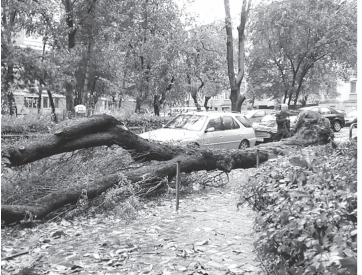
Tegnap a déli órákban kidőlt egy fa a marosvásárhelyi Brassó utcában, szemben a Darina vendéglővel, a 3. és 5. számok közötti zöldvezetben. A szerencsétlen kimenetelű balesetben egy 70 éves férfi sérüléseket szenvedett, a rohammentősök szállították el – tájékoztatót Virag Cristian, a katasztrófavédelmi hivatal sajtófelelőse.