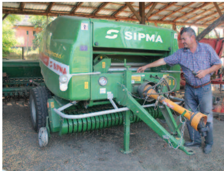
Az új bálázógép

A mezőmadarasi portát és gazdaságot szemlélve ismét megfogalmazódik: itthon, falun, a szülőföldön, az ősi birtokokon is lehet boldogulni, ha van hozzá szorgalom, munkakedv és kellő elszántság.