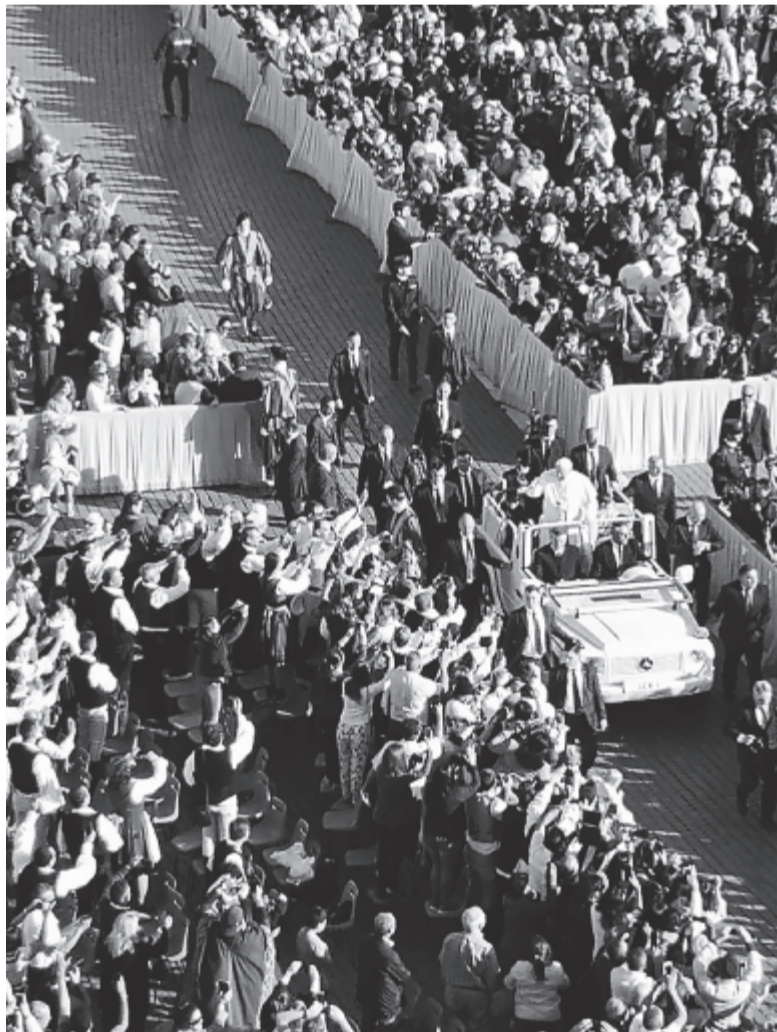
A felcsíkiak előtt elhaladó pápa